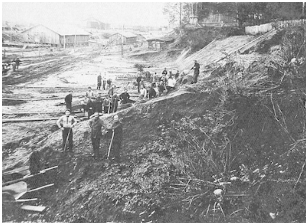
Один из множества лагерей ГУЛАГа

О тех страшных годах батюшка рассказывал: «Люди исчезали и пропадали. Расставаясь, мы не знали, увидимся ли потом. Мои драгоценные духовные друзья! Все прошло! Я долго плакал о них, о самых дорогих, потом слез не стало... Мог только внутренне кричать от боли... Ночью уводили по доносам, кругом неизвестность и темнота... Страх всех опутал, как липкая паутина, страх. Если бы не Господь, человеку бы невозможно вынести такое...»