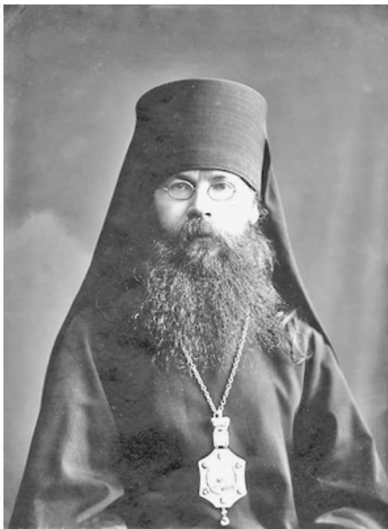
Вениамин, митрополит Петроградский и Гдовский с 1917 по 1922 г.

С детства будущий старец прислуживал в алтаре. Самой важной встречей для него была встреча со священномучеником Вениамином Петроградским, – маленький алтарник носил во время архиерейского богослужения его посох. И сам он потом стал пастырем, наставником очень многих людей.