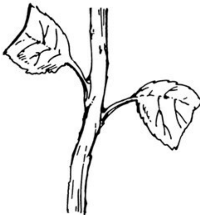
Рисунок 1. Черенок с частями листьев

Рекомендуется иногда даже оставить на почке только часть листа (рис. 1).