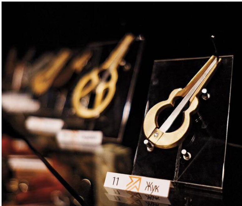
Варганы из коллекции продавца eBay Олега Родни- на

мира. Среди них много экзотических товаров и направлений: в Пуэрто-Рико отправляются отечественные радиоприемники, на Сейшелы и Гавайи – тюнингованные автозапчасти, в Японию – варганы.