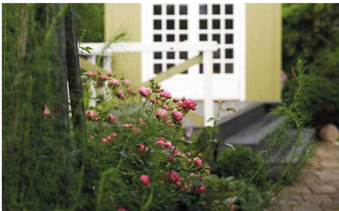
Роза Pomponella и полынь «божье дерево»