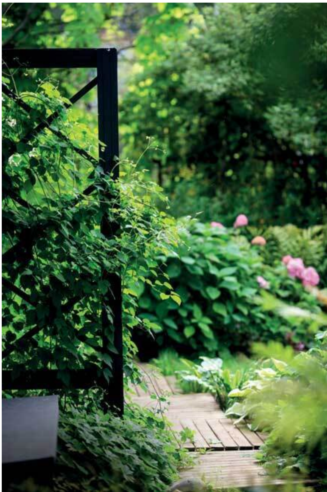
Клематис мелкоцветковый на опоре

Если вы купили эту книгу, то, скорее всего, у вас уже есть участок, или вы планируете его приобрести в ближайшее время. В любом случае вы уже задумались: каким должен быть ваш сад?