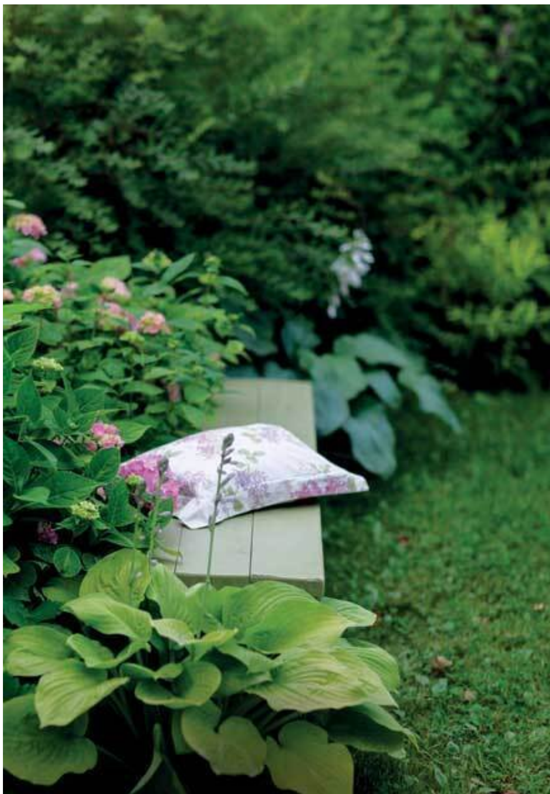
Хосты и крупнолистная гортензия