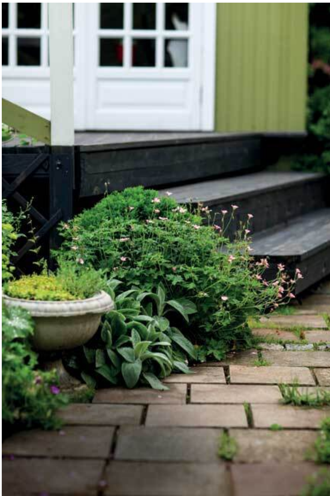
Герань гибридная, чистец, в вазоне камнеломка и гипсофила ползучая