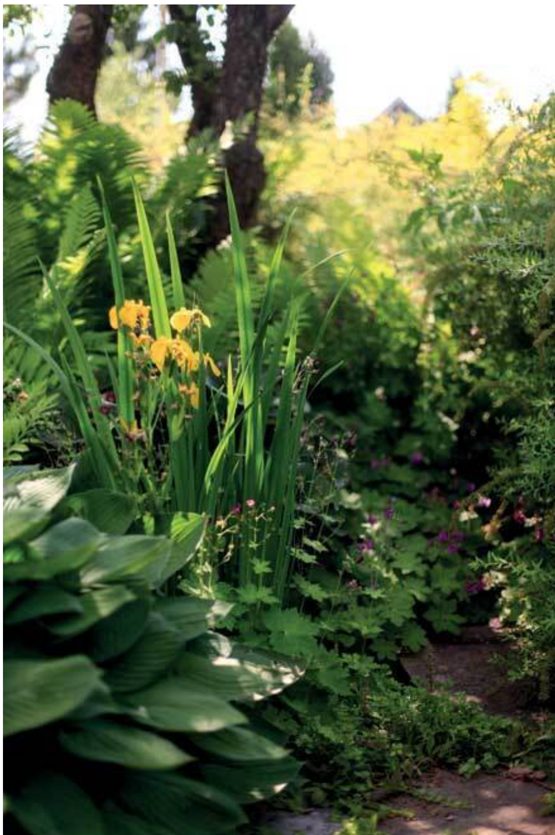
Хоста, ирис болотный, герань крупнокорневищная, на заднем плане страусник