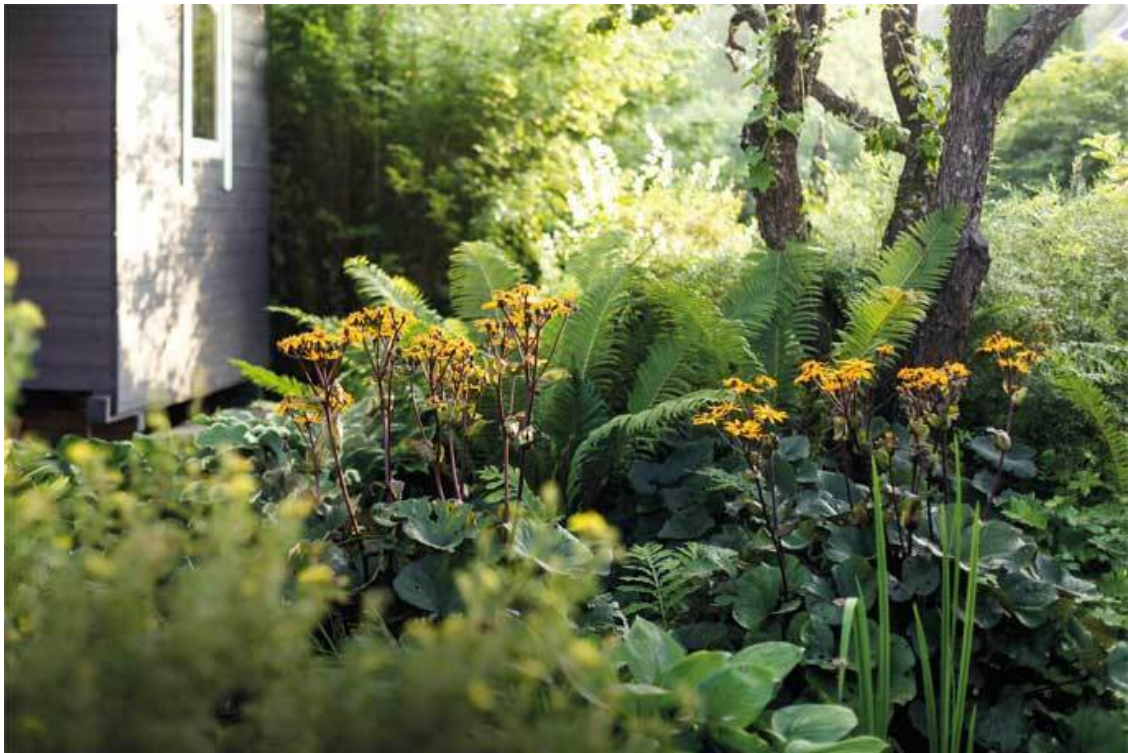
Под яблоней бузульник и страусник

Иногда можно подчеркнуть интересный вид аркой или перголой, которые будут служить «рамой» для вашей садовой «картины».