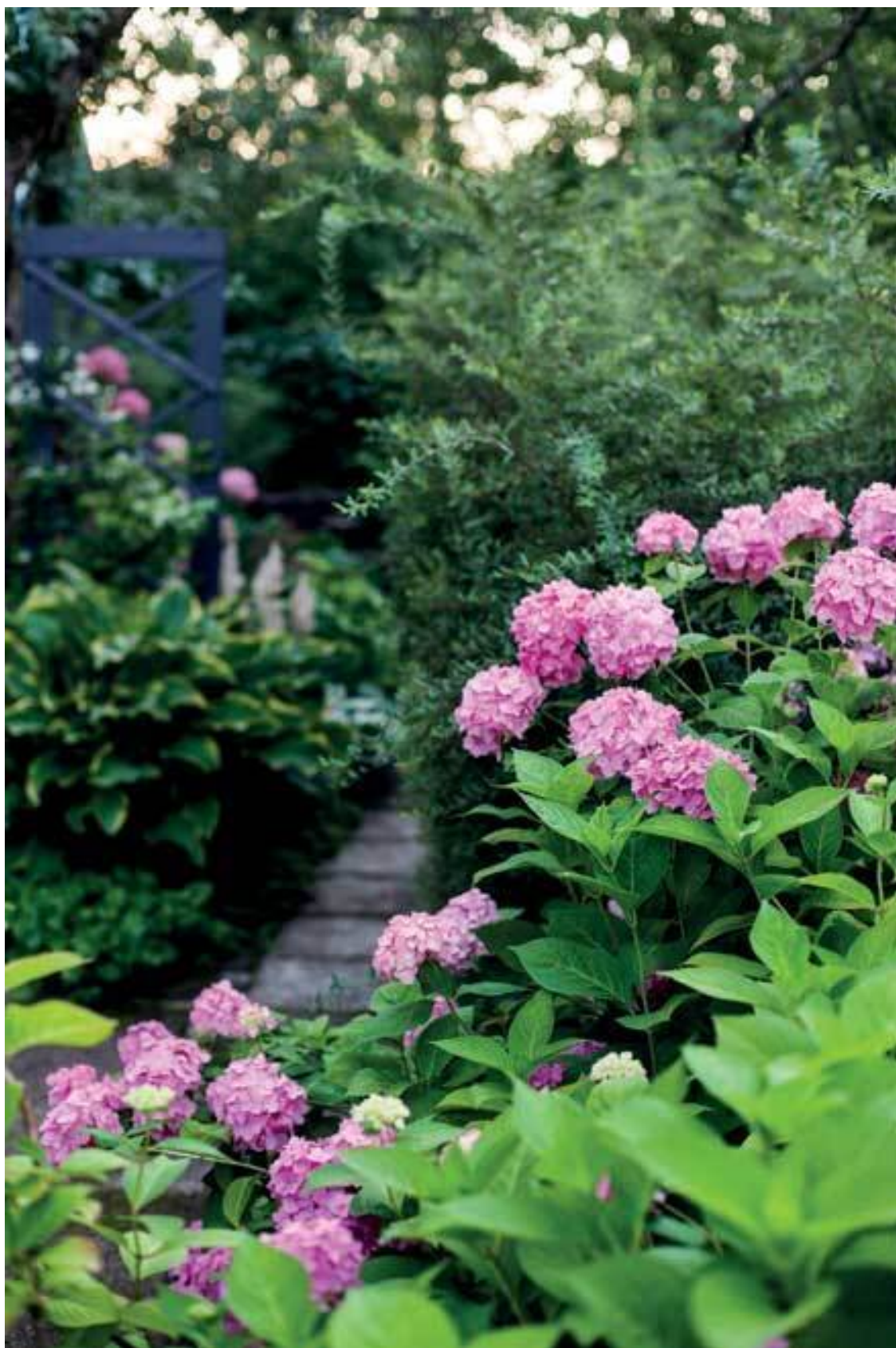
Гортензия крупнолистная, на заднем плане хоста и спирея серая