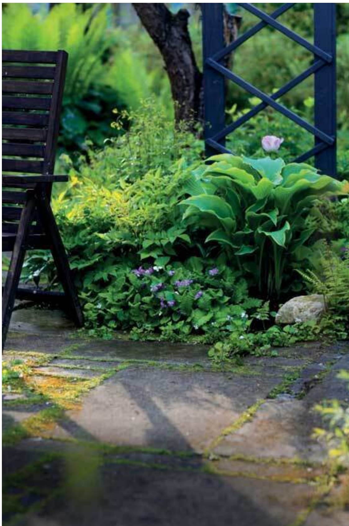
Хоста, астильба, примула коргузовидная и фиалка соррория