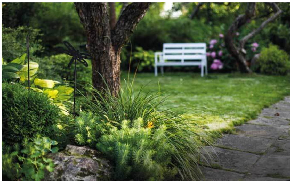
На переднем плане лилейник малый, молочай кипарисовый и хосты