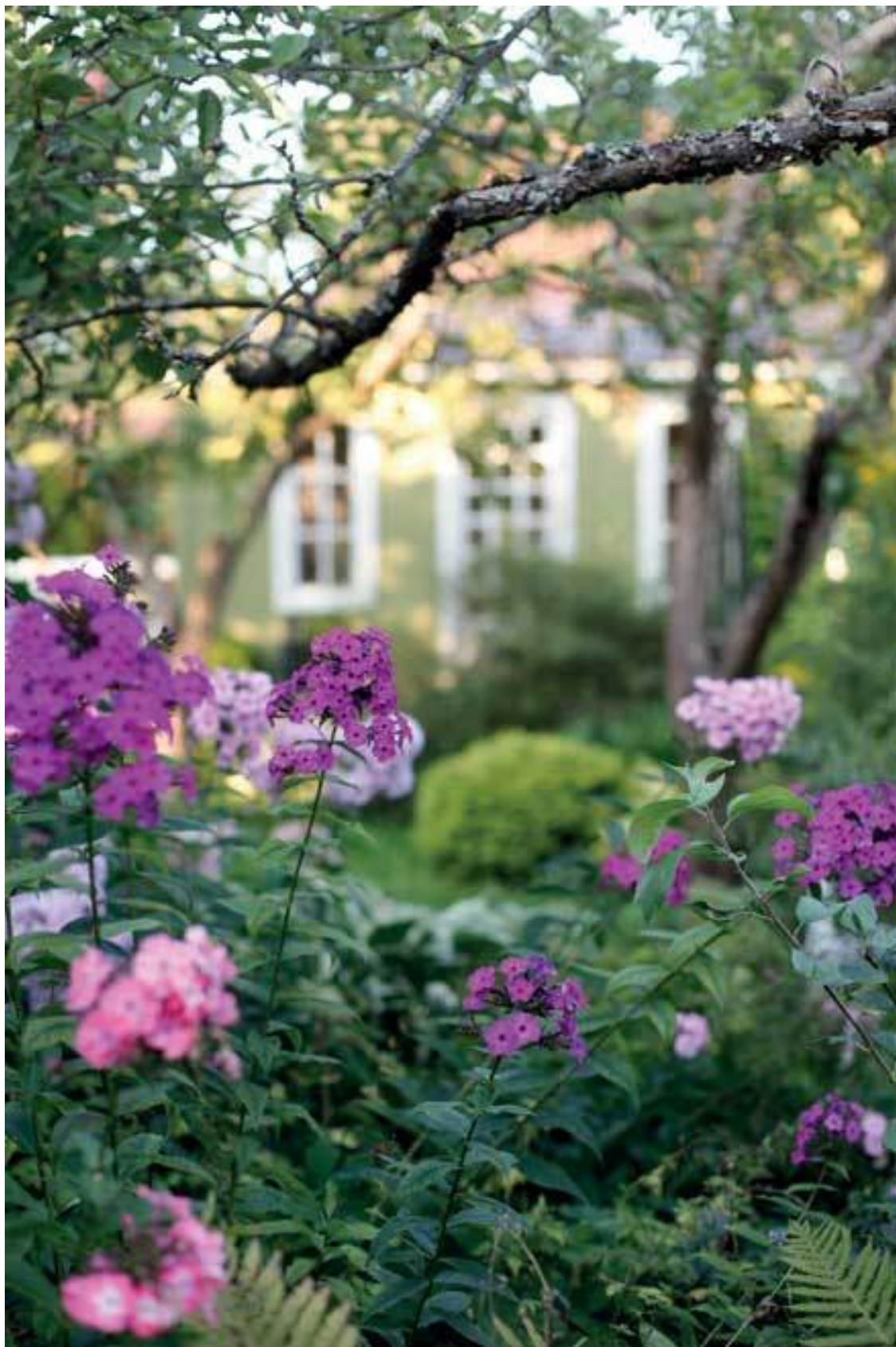
Флоксы, вдалеке спирея японская Gold Princess