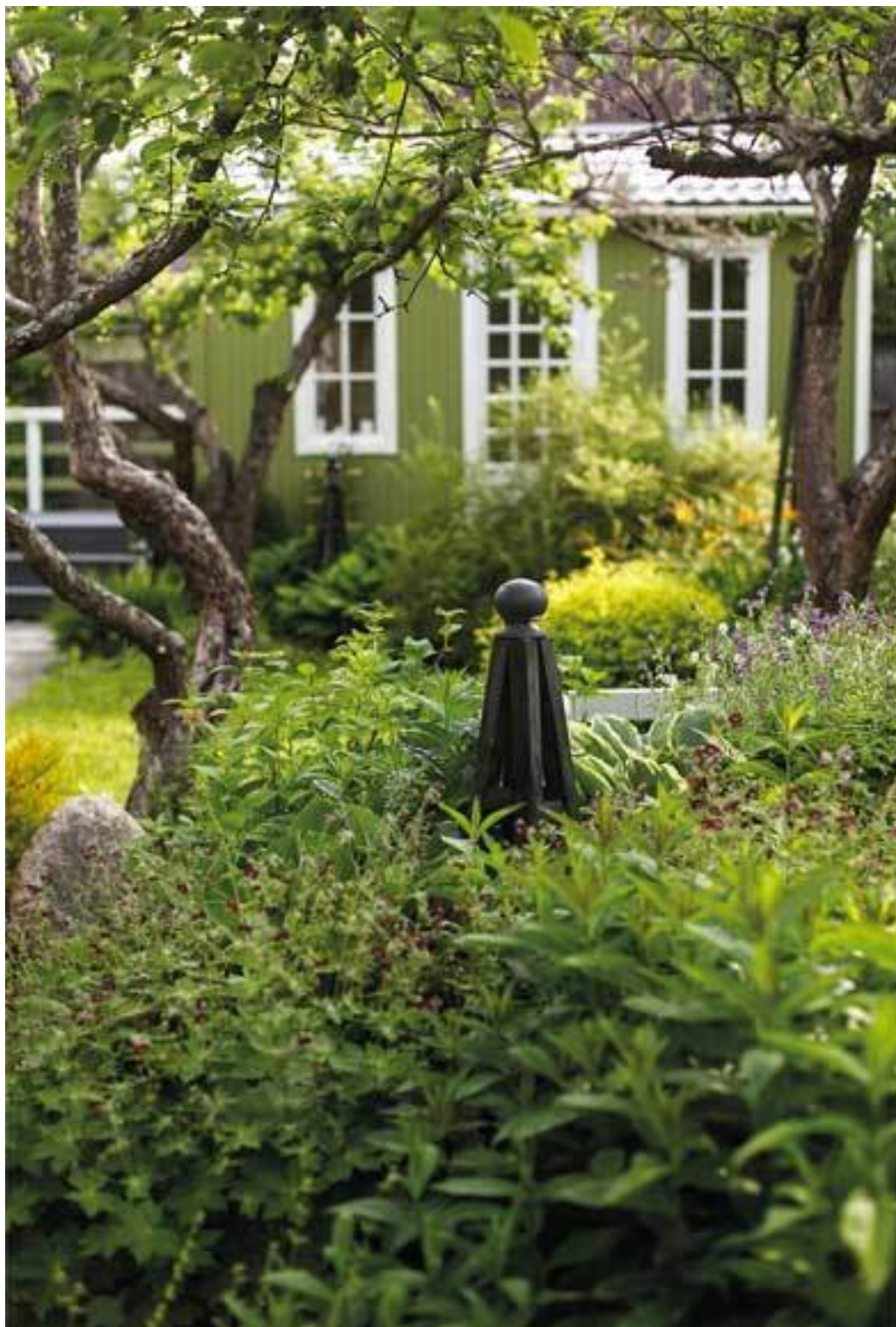
Сорта герани темной и флоксов

Есть ли домашние животные? Как они себя ведут? Например, некоторые кошки (но не все!) обожают котовник (одно из самых долгоцветущих и красивых растений в нашей полосе), при этом они просто ложатся на куст сверху. Возможно, ваш куст котовника полюбят и соседские коты, об этом тоже стоит задуматься, составляя список растений.