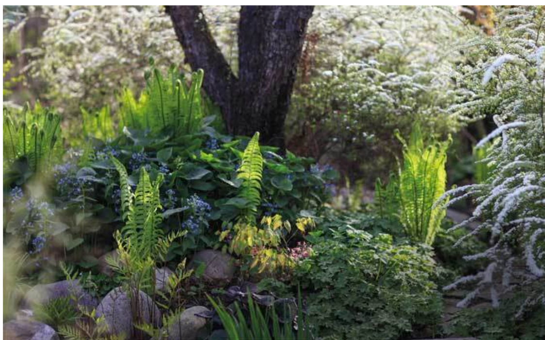
Страусник и бруннера на фоне кустов спиреи Грешайм