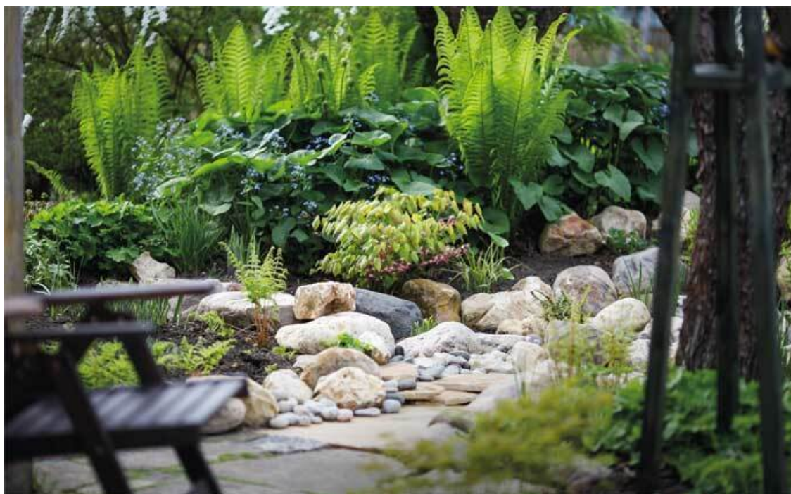
Страусник, бруннера и горянка