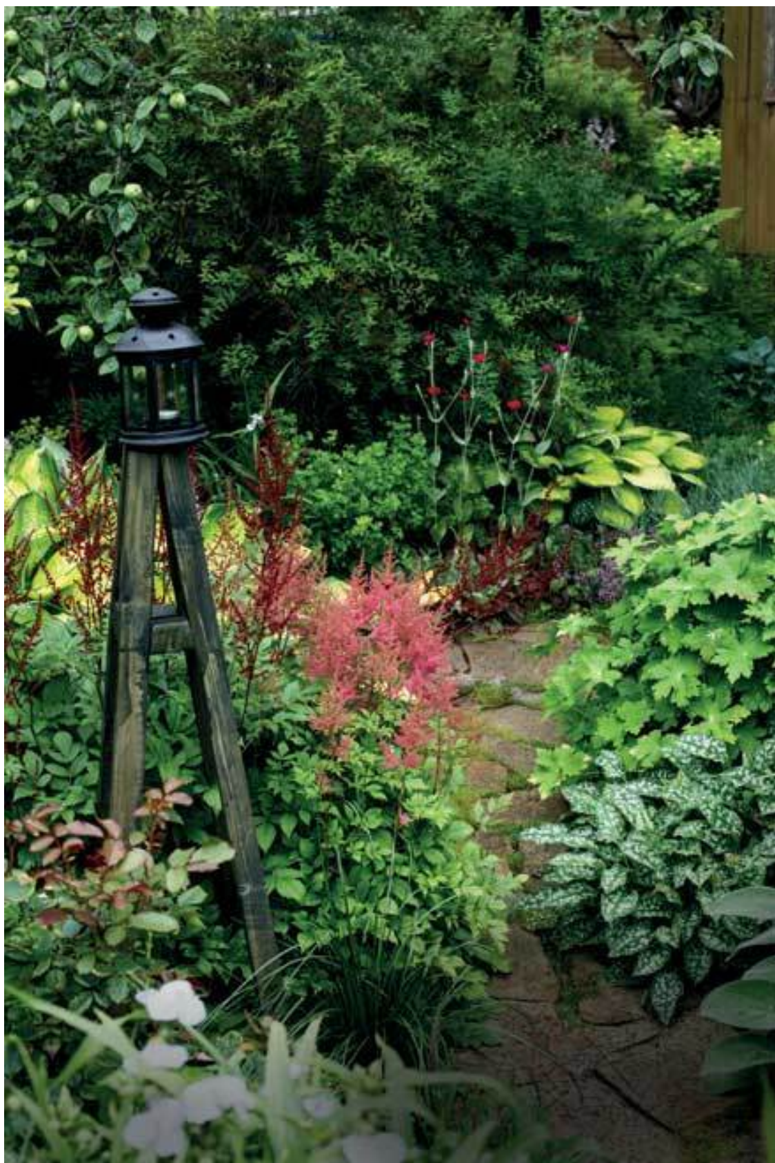
Справа медуница и герань темная, слева астильбы, вдалеке хосты и лихнис