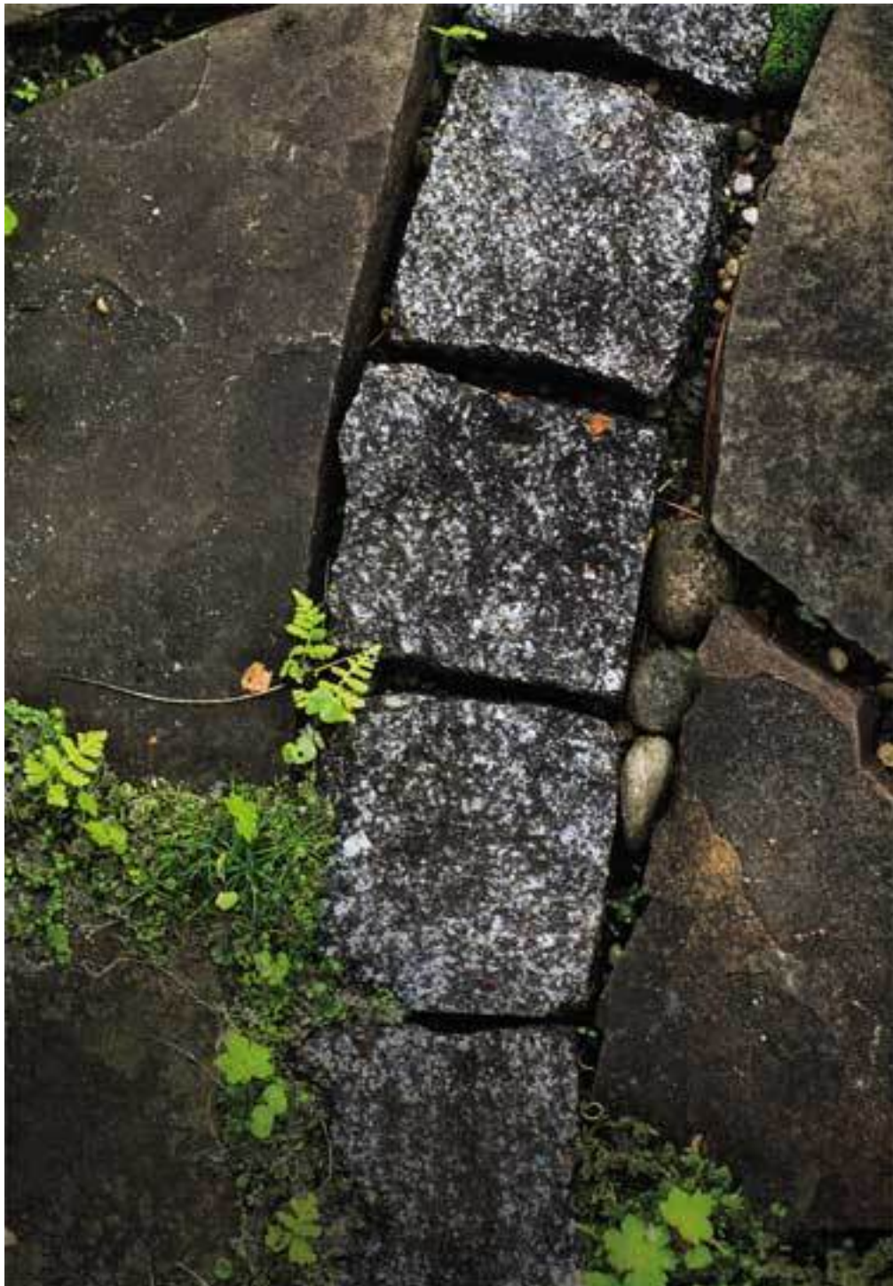
Плитняк и гранитная брусчатка, в щелях папоротник пузырник

Хочу заметить, что для хозяйственных целей принято использовать прямые дорожки, они короче, по ним удобнее идти с садовой тачкой, к тому же их проще укладывать. Но в саду гораздо интереснее смотрятся дорожки извилистые. Даже на небольшом участке можно подчеркивать повороты, правильно высаживая растения – например, так, чтобы они загораживали вид на следующий участок сада. Так сад можно сделать визуально больше.