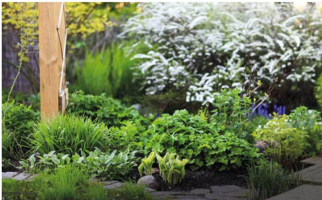
На переднем плане хоста, рядом ирис разноцветный и медуница, на втором плане герань темная и традесканция, вдалеке спирея серая