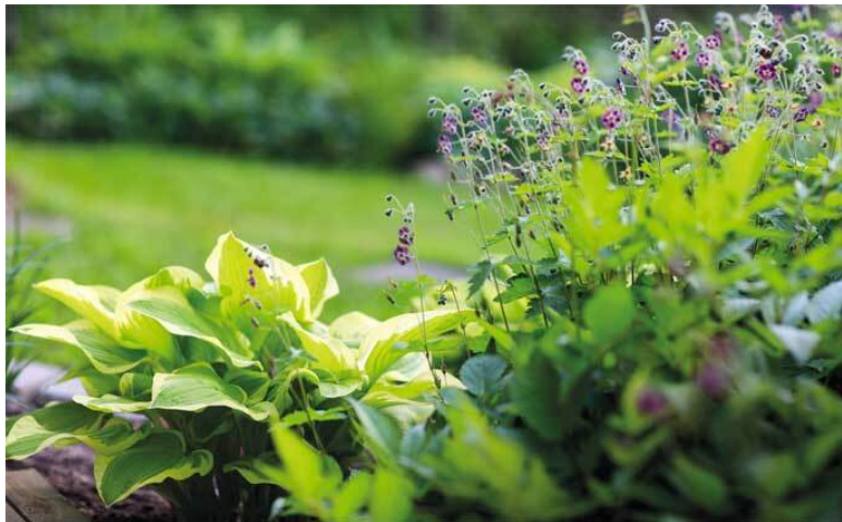
Герань темная и хоста