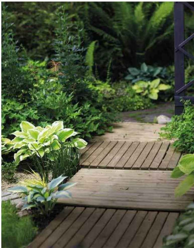
Различные сорта хост вдоль деревянной дорожки из готовых щитов с пропиткой под давлением