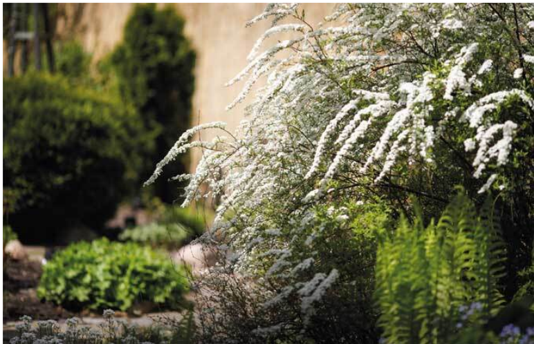
Спирея серая Грефшайм, страусник, вдалеке герань темная