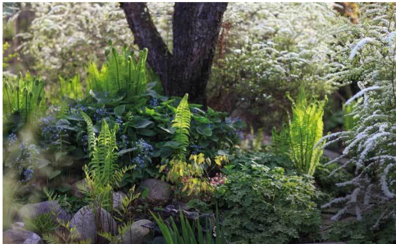
Страусник и бруннера на фоне кустов спиреи Гrefшайм