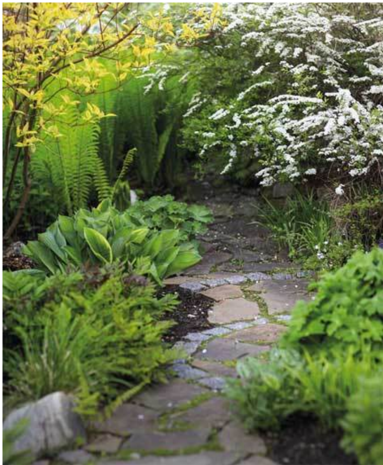
Дорожка из плитняка и брусчатки в весеннем саду