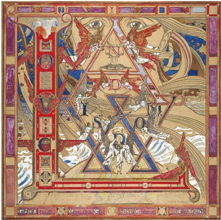
Вайолет Оукли. Этюд для «Закона Божьего». Ок. 1917

Оукли училась у Сесилии Бо в Пенсильванской академии изящных искусств, а затем в Дрексельском университете под руководством иллюстратора Говарда Пайла. Пайл, увидев у нее выраженный талант к графике, поощрял Вайолет заниматься настенной живописью. Этот дизайн, сочетающий кельт-