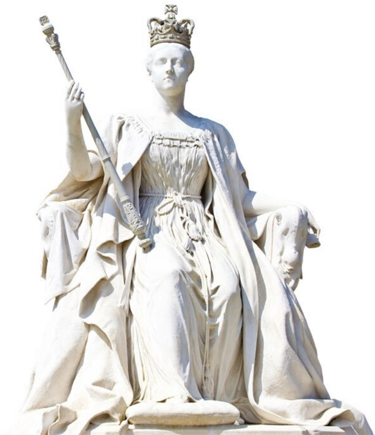
Принцесса Луиза, герцогиня Аргайл. Королева Виктория. Статуя в Кенсингтонском дворце, Лондон. 1890—1893

Принцесса Луиза, герцогиня Аргайл, была шестым ре-