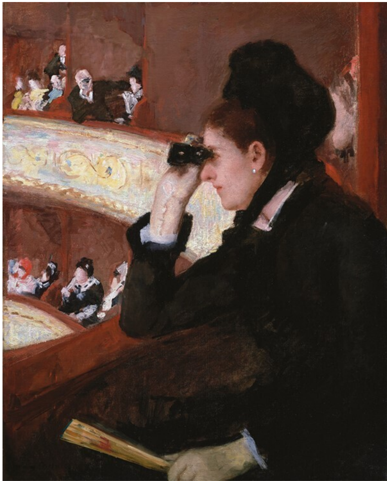
Мэри Кэссетт. В ложе. 1878

Уроженка Филадельфии, Мэри Кэссетт провела три года