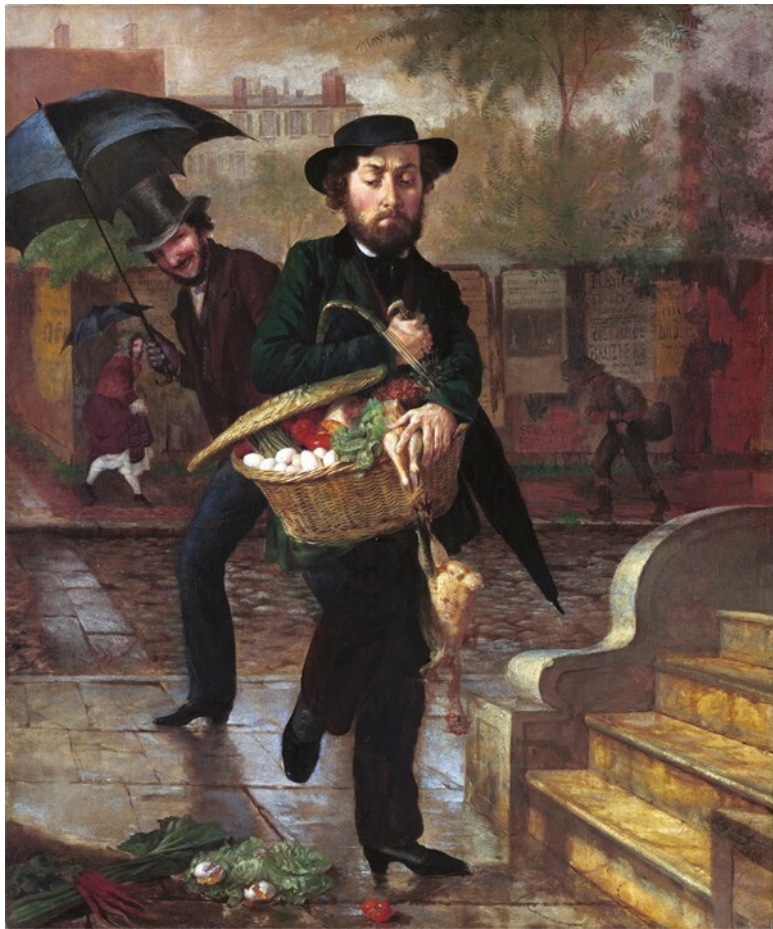
Лилли Мартин Спенсер. Молодой муж: Первые покупки. 1854

Моделью для этой веселой иллюстрации к супружеской