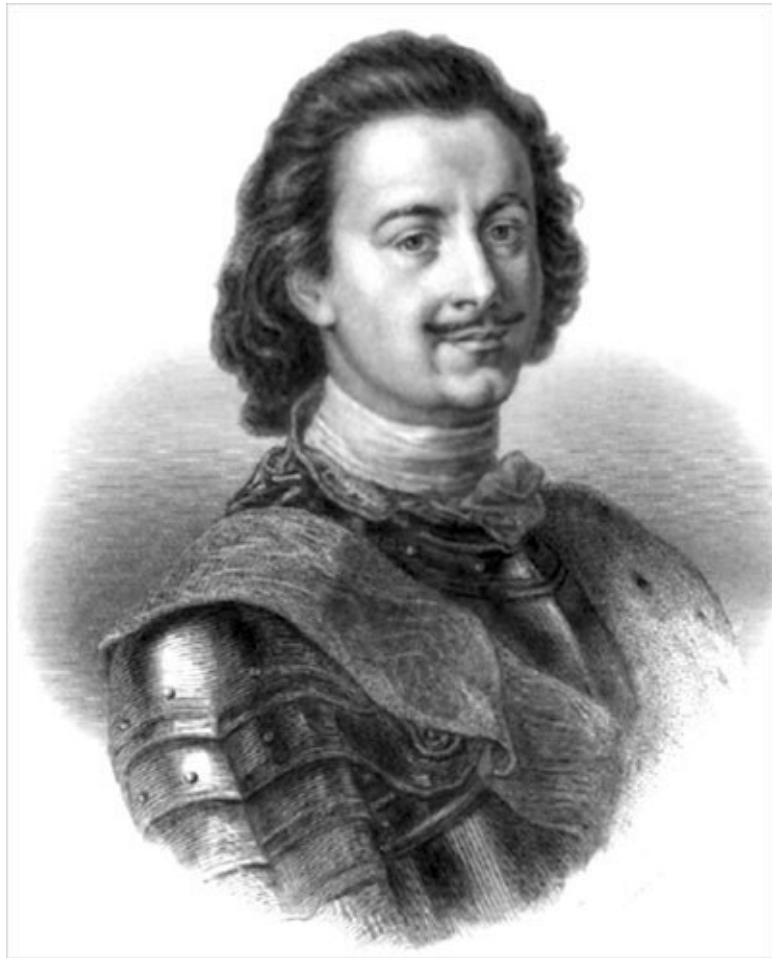
Император Петр Великий