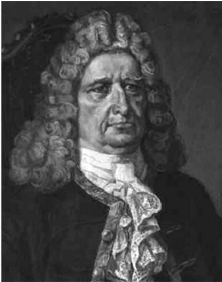
Герхард Фридрих Миллер