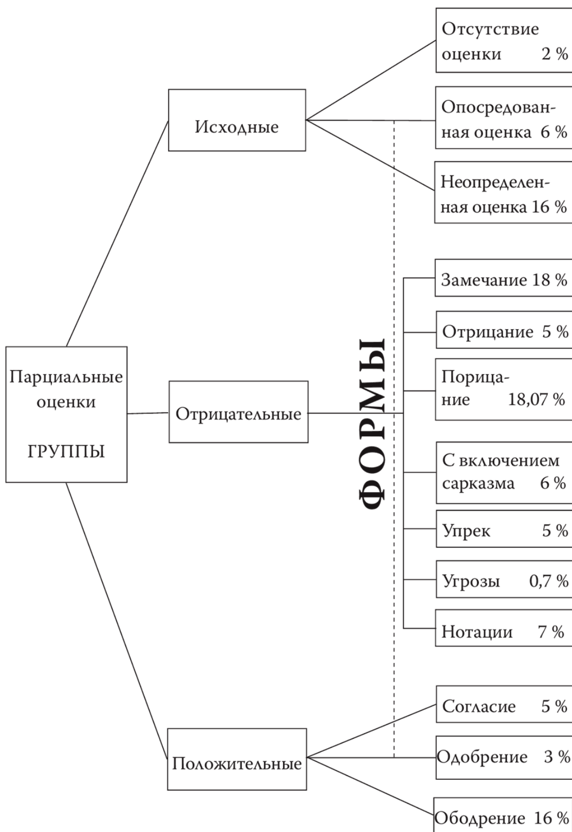
Схема 1. Структура парциальных оценок (по Б. Г. Ананьеву)

Таким образом, процесс порождения отметки одновременно является процессом столкновения разносторонних сил и факторов, субъективных и объективных; отметка не возникает прямолинейно и безболезненно. Анатомия процесса порождения отметки, данная в схематич-