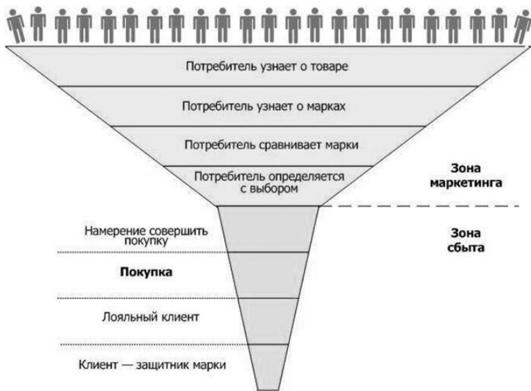
Рис. 1.1.2. Модель «потребительской воронки»

ях реальной практике потребления, отвечала основным требованиям управленцев – она выступала удобным методическим инструментом для определения ключевых точек приложения маркетинговых усилий и формирования комплекса маркетинга, соответствующего каждому этапу принятия решения. Именно на ее базе были созданы многочисленные «воронки продаж» (рис. 1.1.2), «коммуникативные воронки», а с учетом сегодняшнего развития новых информационных технологий еще и «digital-воронки».