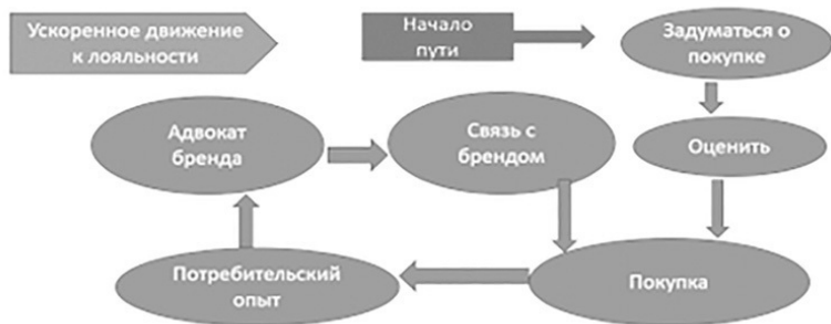
Рис. 1.1.4. Модель потребительского решения «Ускоренный путь к лояльности»

Именно обобщение данных по изучению и управлению потребительским опытом в различных странах позволил международной консалтинговой компании McKinsey в 2015 году предложить обновленную модель управления потребительским решением «Нулевой момент истины» (ZMOT) от компании Google , названную «Ускоренный путь к лояльности» («Accelerated Loyalty Journey») 30 (рис. 1.1.4).