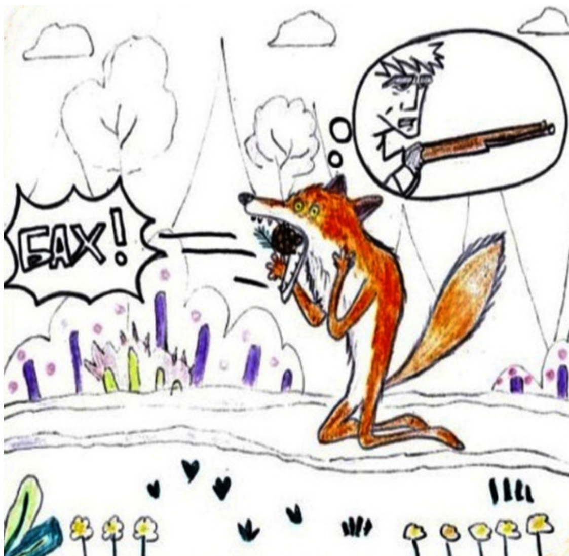
Шишка влетела прямо в рыжую пасть. Охотник?!

Скрип открывающейся двери отвлек Буруна. Из-за нее сначала показались длинные усы, затем не менее длинные уши и, наконец, сам папа-заяц. Он яростно вращал ушами, определяя, далеко ли убежало это страшное «жж». А «жж» было далеко, на 2-ой Осиновой аллее, и уже стучалось в поликлинику Дядюшки Грача. Папа-заяц, поздоровавшись с бурундучком, отправил с ним в школу своего младшего поедателя моркови. Ребята дружили давно, ходили вместе в лесопарковый детсад. А сегодня лесная школа ждала их с открытыми дверями, красивой музыкой, воздушными шарами и праздничными лентами. Искатели знаний не заставили себя долго ждать и со всех восьми ног помчались в школу. На пороге их встретили: встревоженная мама-бурундучиха, сонный папа-бурундук и Серый Волк – учитель младших классов. Втроем они никак не могли прочитать оставленную бурундучком записку. Вернее, прочитать ее могли, у всех было высшее лесное образование, а у некоторых даже золотая медаль. В общем, каждый читал по-своему. Мама: