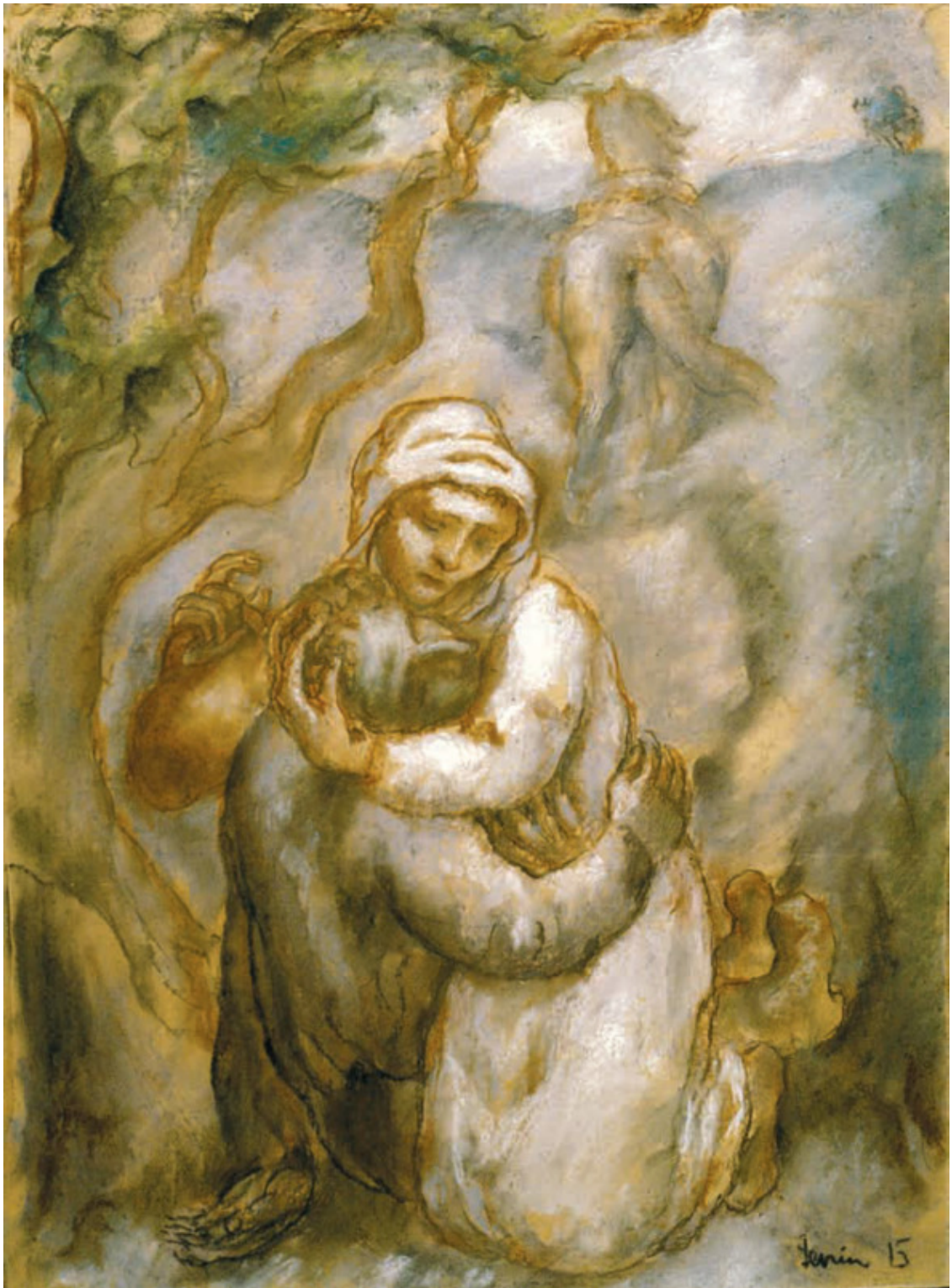
Роберт Генин. Милосердие

Социалистическая революция в Германии провалилась. Поля Фландрии усеяны крестами. По улицам европейских городов бродят человеческие обломки, без рук, без ног, отравленные газом, непрерывно кашляющие. Жизнь изменилась катастрофически и, хотя военные действия еще идут, в 1915 году он публикует серию рисунков «Женщина на войне», «Вдова», а в 1917 году – серию гравюр на военную тему.