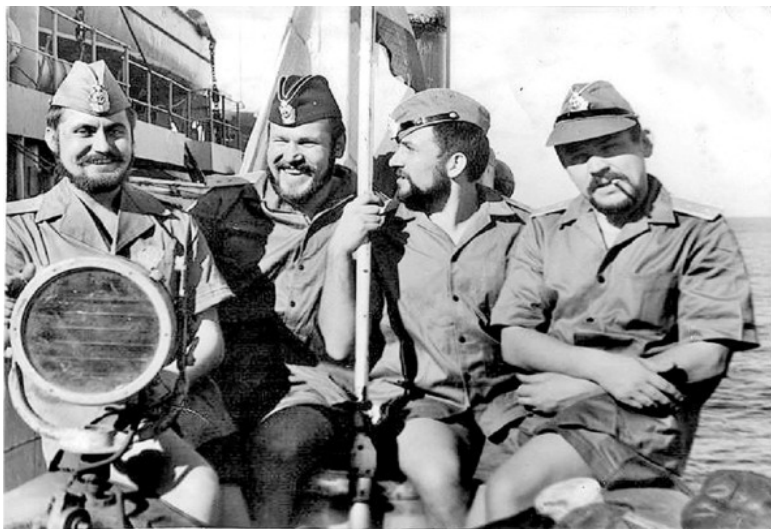
Такие бесстрашные красавцы - бородачи служили в нашем подводном флоте. Ноябрь 1976 год. Средиземное море.

Командир дал «добро». «Старых мичманов», нюхавших море только с берега, надо тоже учить, что жди команду: «Свободным от вахты, разрешён выход наверх». Мичман полез покурить без команды и головой стукнулся о закрытый верхний люк. В данный момент он решил подстраховаться и вышел со мной. Я ему «разжевал» как надо действовать, а он, когда спрыгнул с «турника» и прикурил сигарету, не успел запрыгнуть снова наверх.