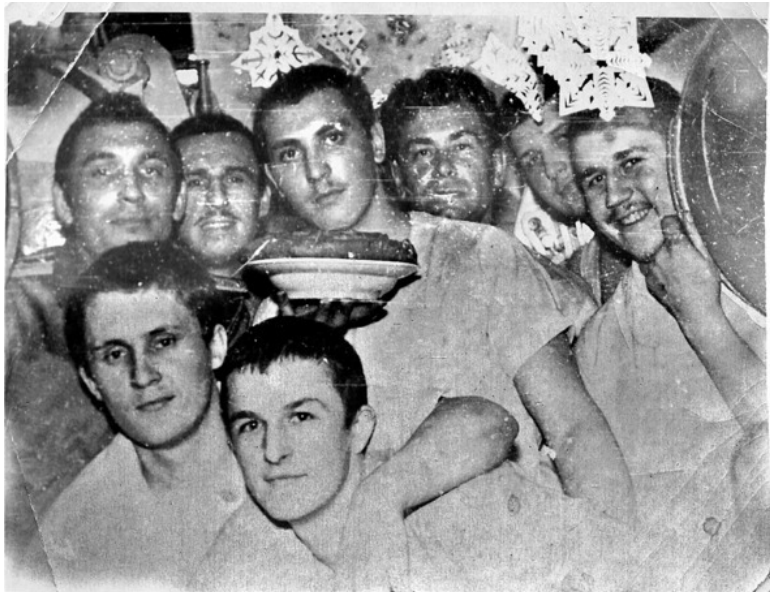
Личный состав первого отсека с призовым пирогом. Декабрь 1976 года. Средиземное море.