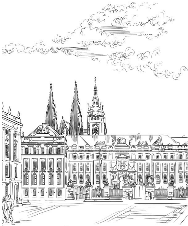
Здание отдела карателей