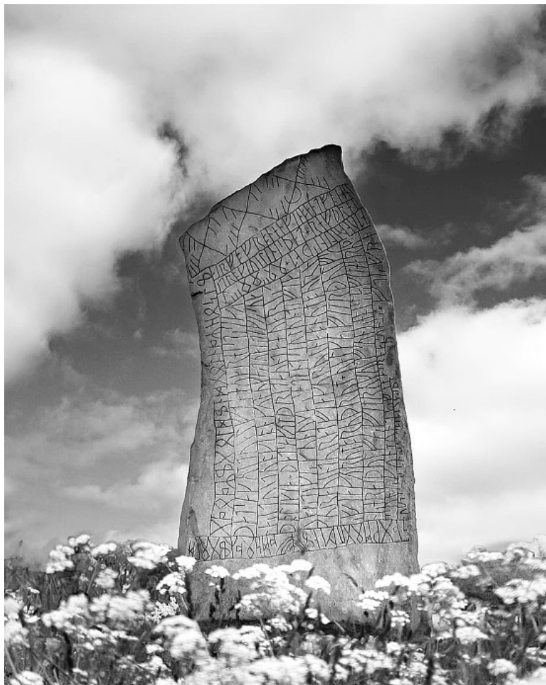
Рунический камень. Швеция, ок. IX в.