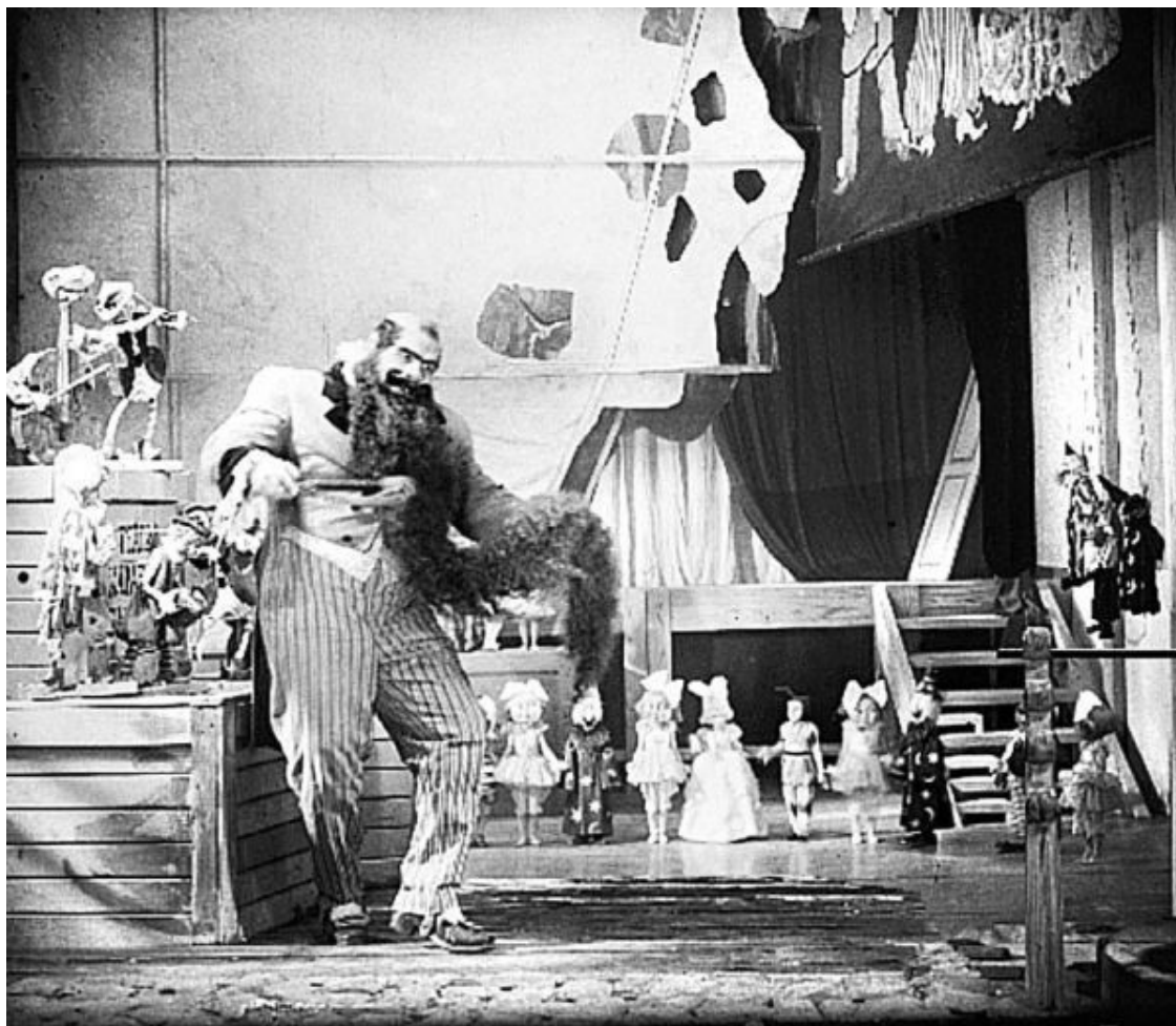
Кадр из фильма «Золотой ключик»

Параллельно с выпуском фильмов студия продолжает строиться.