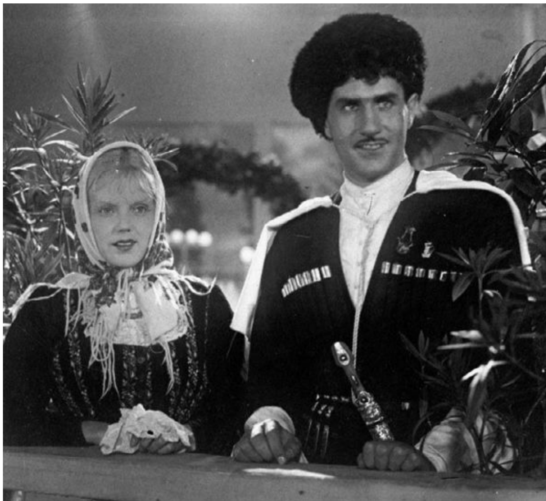
Кадр из фильма «Свинарка и пастух» – Марина Ладынина и Владимир Зельдин

Изначально предполагалось переместить «Мосфильм» в Куйбышев или в Новосибирск. Но эти города уже и так были переполнены беженцами и эвакуированными из западных и центральных областей СССР предприятиями.