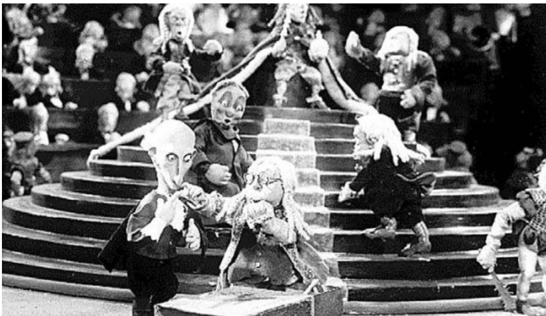
Кадр из фильма «Новый Гулливер»

Уверенно шагнула с экрана в жизнь «Девушка с характером» – Валентина Серова, которую сделал звездой режиссер Константин Юдин.