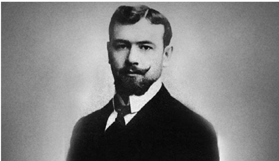
Александр Алексеевич Ханжонков

Во время немецкой оккупации Крыма Ханжонков оставался в Ялте. Немцы очень хотели привлечь этого человека-легенду в кинематографическом мире к сотрудничеству. Тщетно!