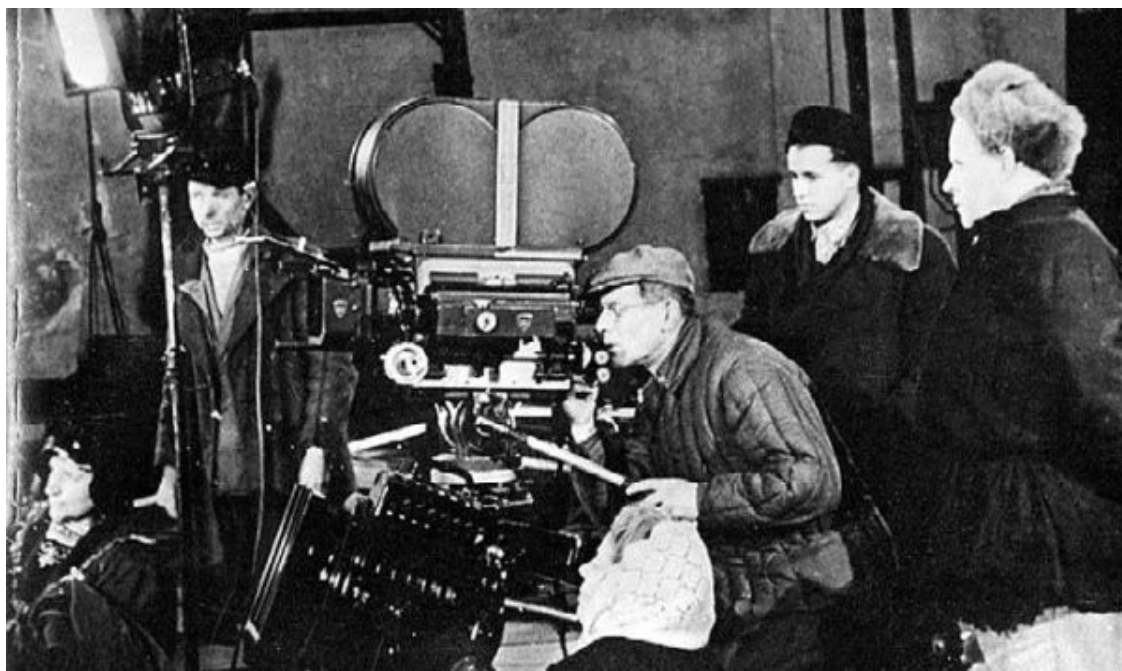
ЦОКС, справа – С. Эйзенштейн

В трудных производственных и бытовых условиях, при острой нехватке квалифицированного технического состава и актеров было быстро налажено производство фильмов, которое шло круглыми сутками.