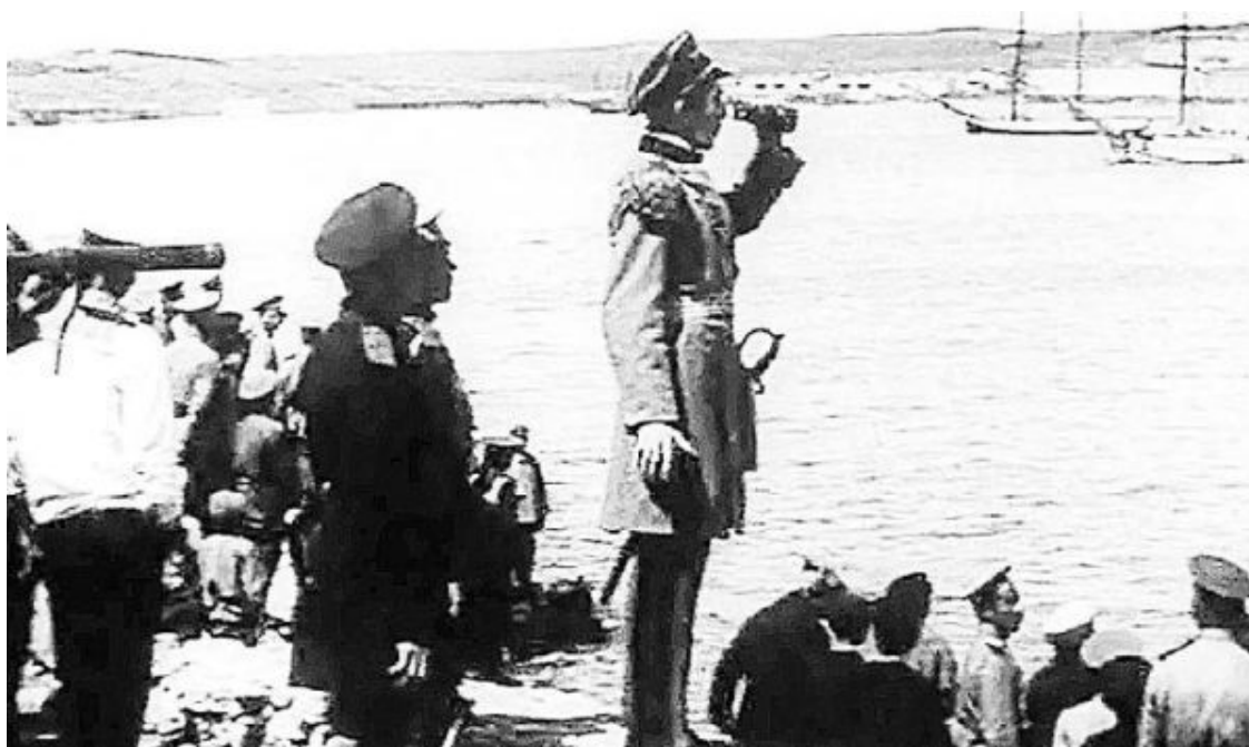
Кадр из фильма «Оборона Севастополя»

Ханжонков стал кинолетописцем нашей истории: благодаря ему люди увидели похороны Льва Толстого, узнали лица актеров МХАТа – Качалова, Станиславского, Кореневой, Книппер и др.