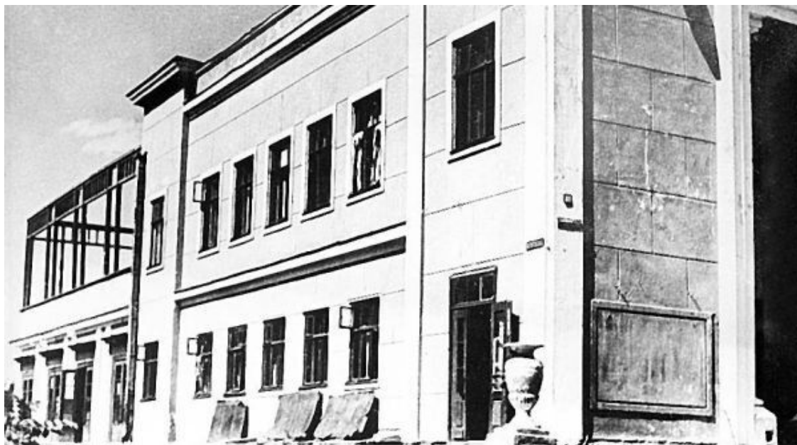
Здание ЦОКС в Алма-Ате

Вот что написал об этом времени Михаил Ромм – в то время начальник Управления по производству художественных фильмов СССР: