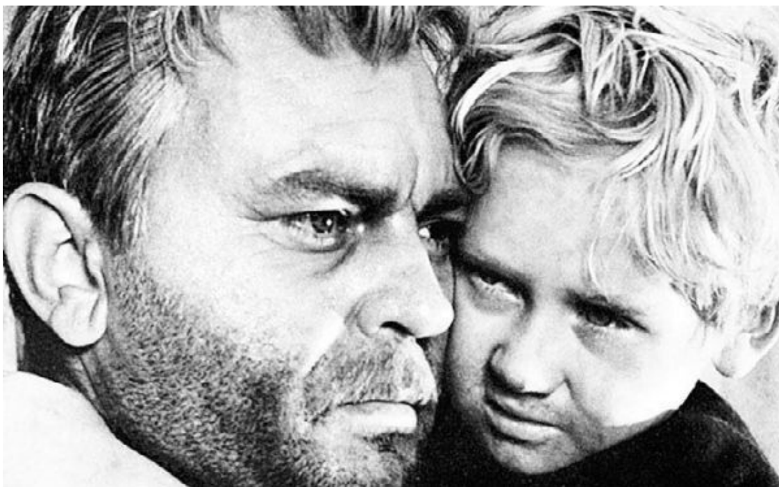
Кадр из фильма «Судьба человека» – Сергей Бондарчук и Паша Борискин

Читатели СЭ назвали лучшим фильмом года «Судьбу человека» Сергея Бондарчука («Мосфильм»).