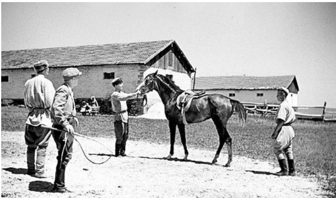
Кадры из фильма «Смелые люди», в главной роли – Сергей Гурзо