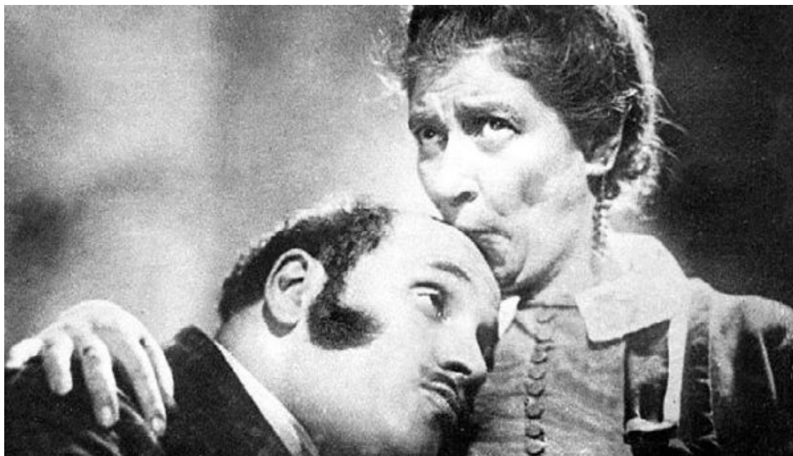
Кадр из фильма «Пышка»: Фаина Раневская и Анатолий Горюнов

По этому поводу даже прошли известные остроумцы Илья Ильф и Евгений Петров в фельетоне «Сквозь коридорный бред»: