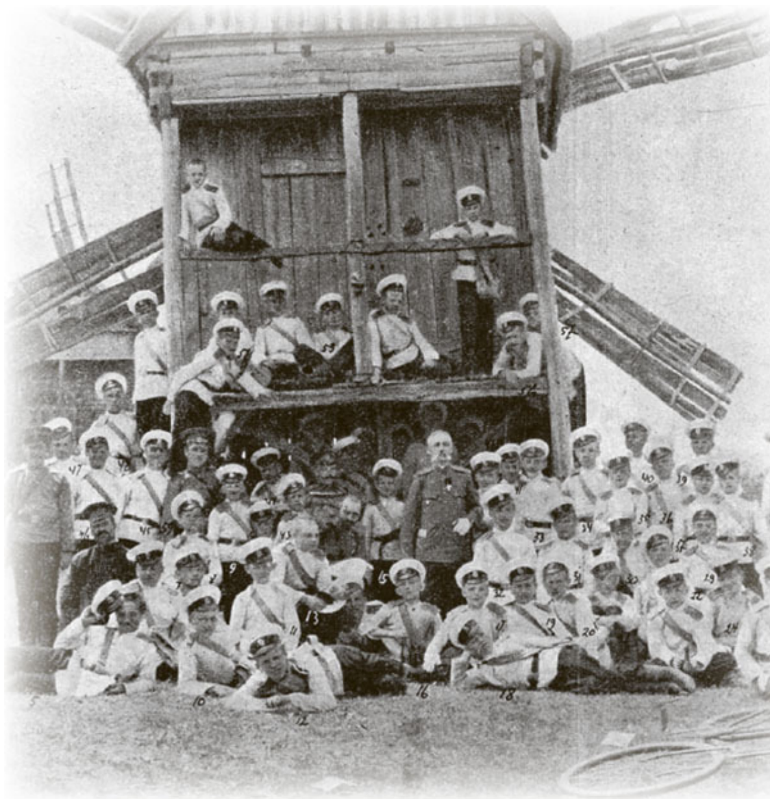
Кадеты Петро-Полтавского кадетского корпуса. 1912 год