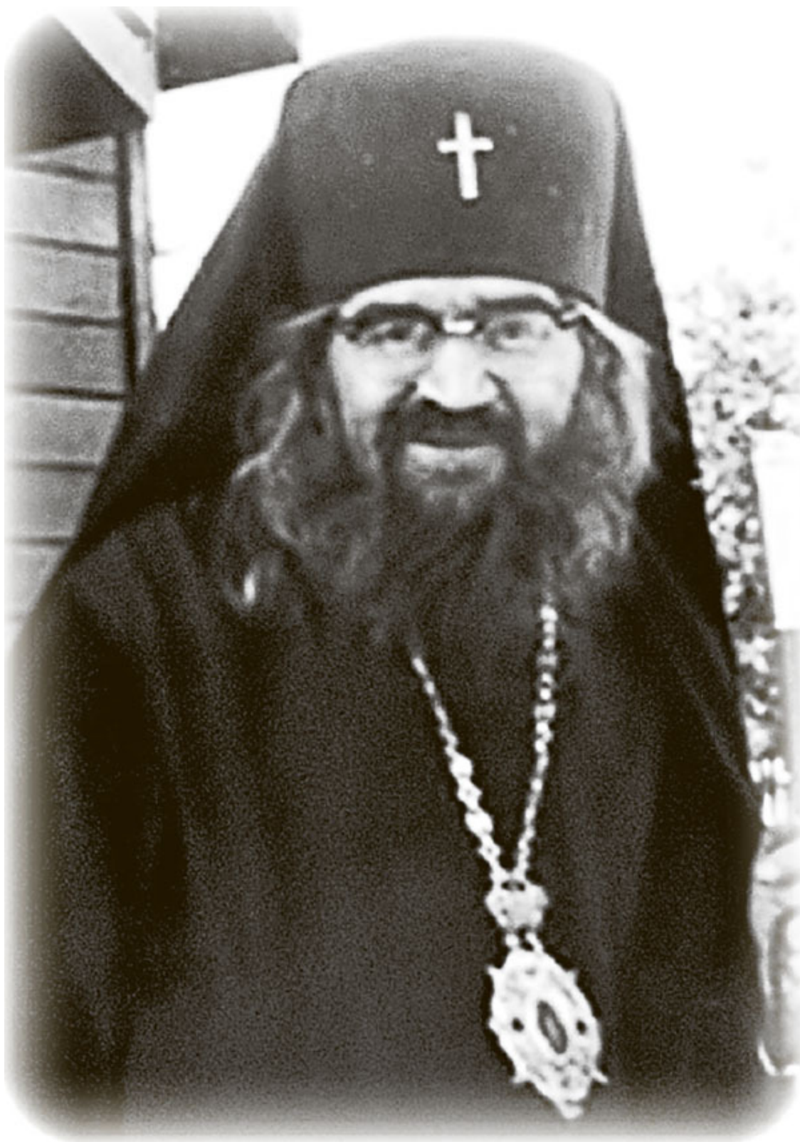
Архиепископ Иоанн (Максимович)