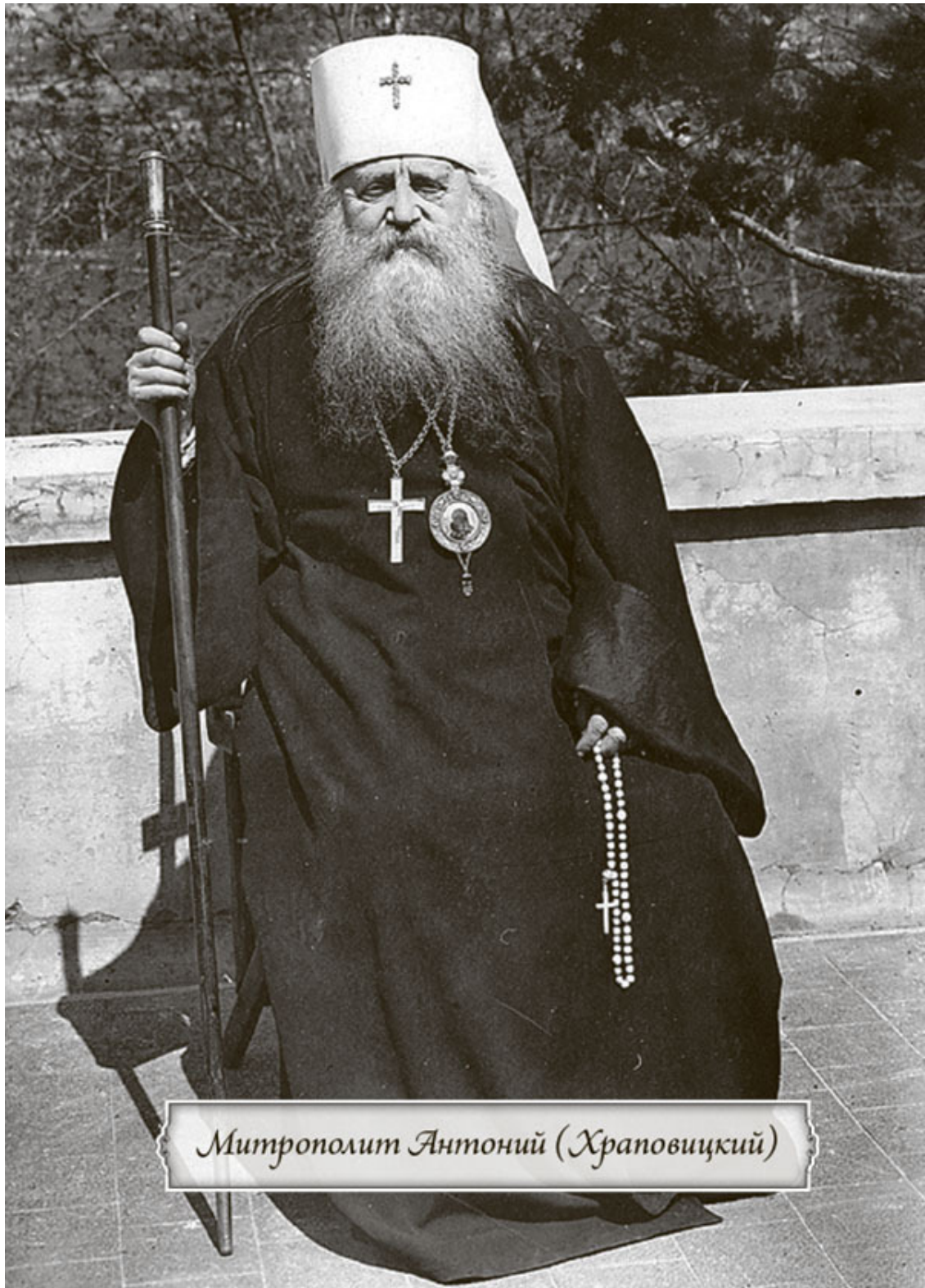
Митрополит Антоний (Храповицкий)