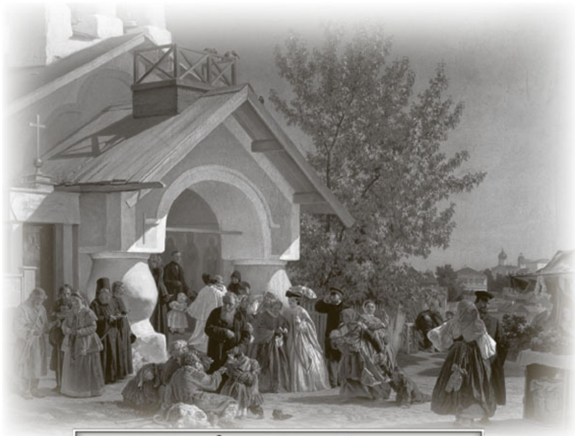
«Выход из церкви в Пскове». Картина худ. А. И. Морозова (1864)

раздражался, не гневался, ни на кого не сердился, не пил и не курил, никогда не болел и умер в 93 года, причем, по особой милости Божией, знал о дне своей кончины.