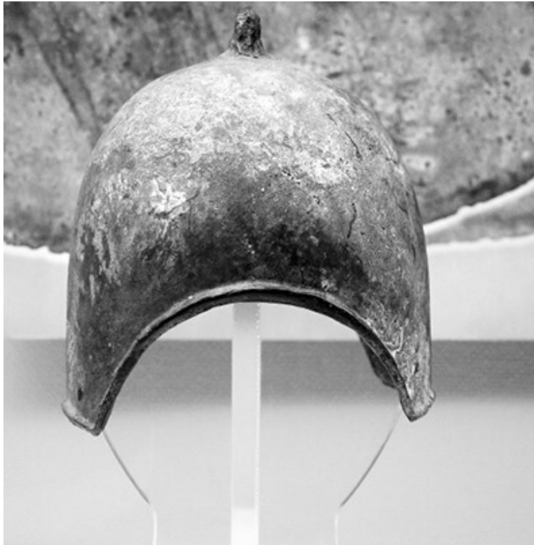
Шанский бронзовый шлем