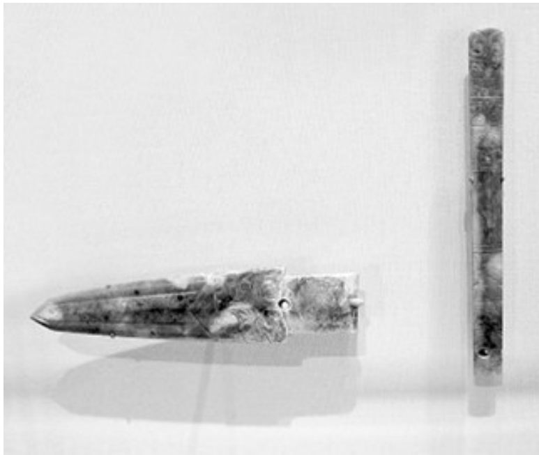
Шанский боевой кинжал и церемониальный скипетр