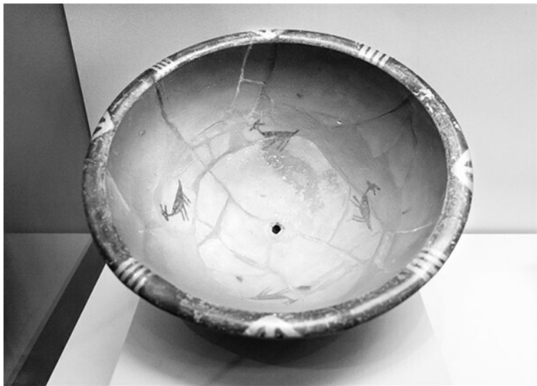
Чаша культуры Яншао, украшенная фигурками оле-

микой Ближнего Востока того же периода. Отличия касаются местных черт, например – изображений черного риса, 14 широко распространенного у наших предков в те времена. Но там, где изображения носили мифологический характер, между ними есть много сходства, указывающего на то, что современные люди пришли на территорию Китая с Ближнего Востока, который можно назвать второй колыбелью человечества (первой и главной считается Восточная Африка).