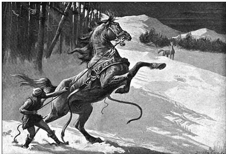
Локи и Свадильфари. С картины Дороти Харди (1909 г.)

дам народные поверья дают лошадиную ногу. Черт нередко показывается в виде собаки и даже называется hellehund, напоминая тем греческого Цербера; как адский пес, он стережет спрятанные в облачных подземельях сокровища, оберегает небесные стада и участвует в дикой охоте – этой поэтической картине весенней грозы, почему его называют также: hellehirte и hellejager.