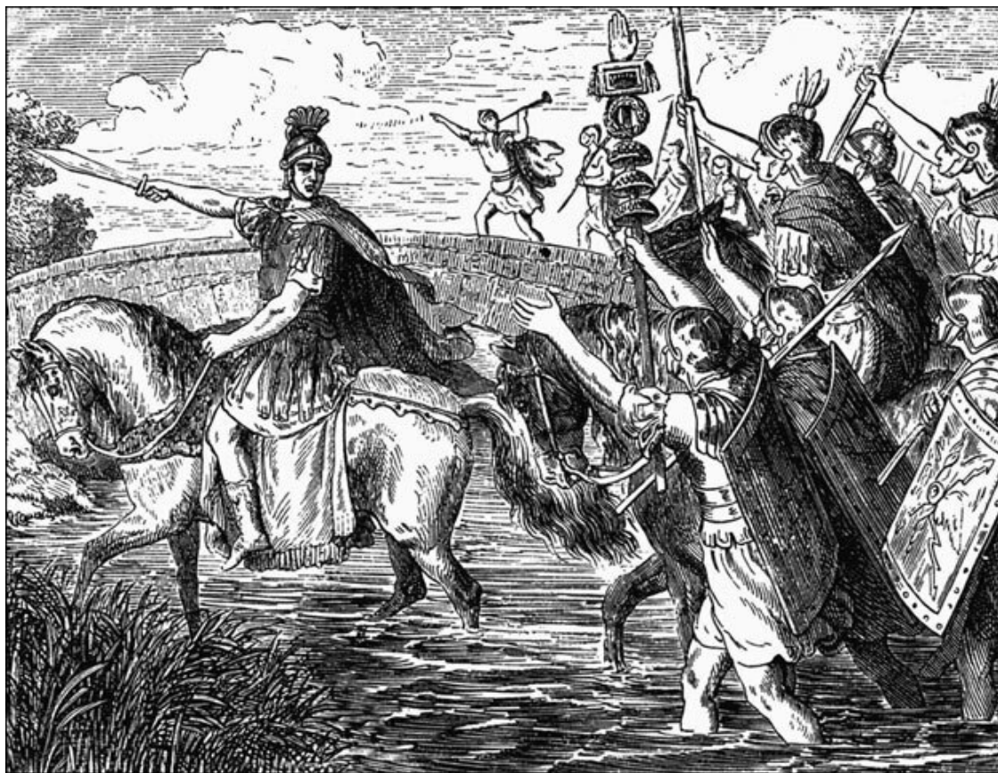
Войска Цезаря пересекают Рубикон. Гравюра XIX в.

Комментаторы давно уточнили, что эта фраза – ἀνερόφθω κύβος — цитата из знаменитого греческого драматурга IV в. до н. э. Менандра. Дословно она переводится как «подбросим игральные кости» . В латинском переводе еще не совершённое действие превратилось в нечто непоправимое, то, что уже совершено: «Жребий брошен!»