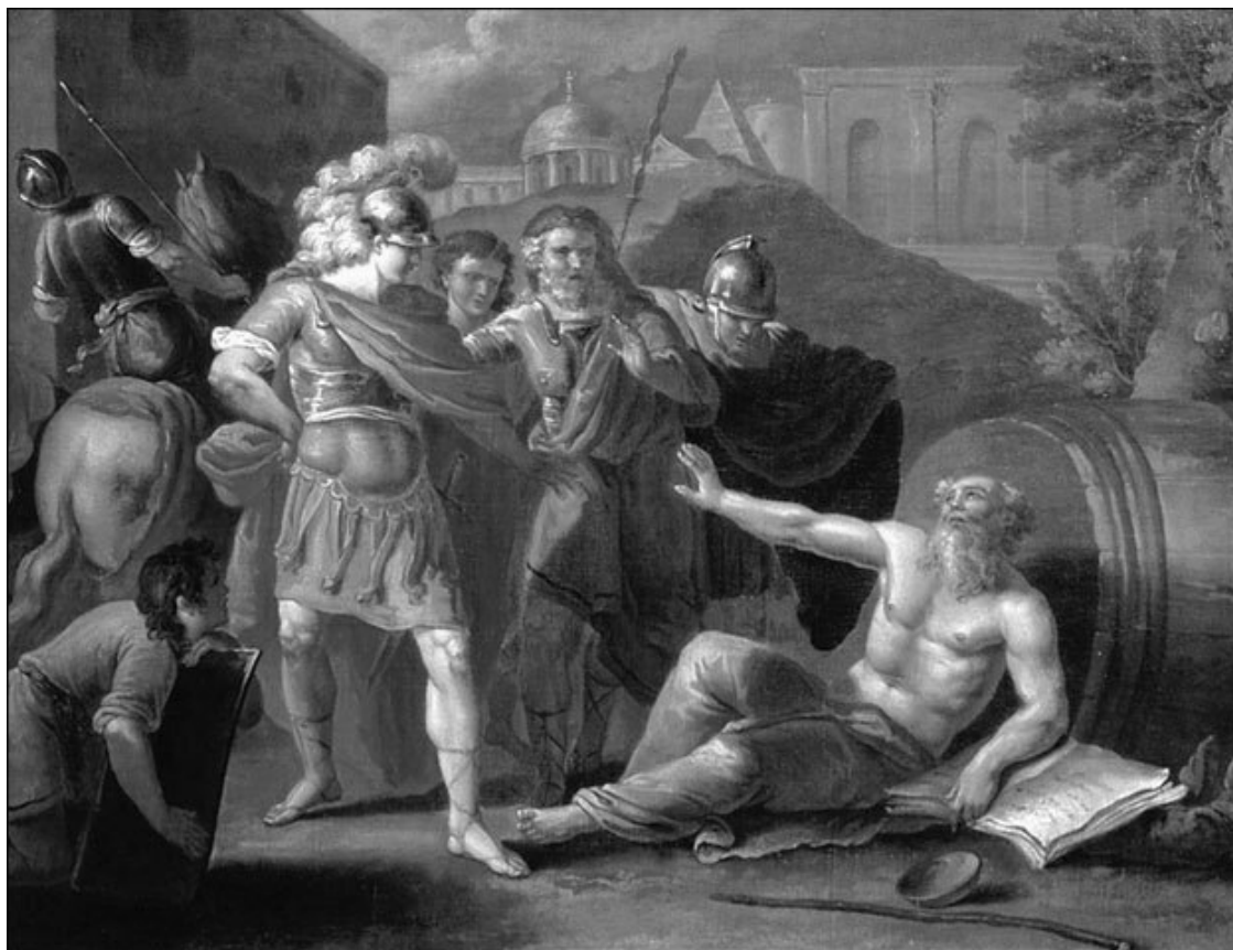
Александр Македонский перед Диогеном. Художник И. Ф. Тупылев. 1787 г.

Жизнеописание Диогена Синопского, оставленное античным биографом Диогеном Лаэртским, изобилует абсурдными сценами. «Желая всячески закалить себя, летом он перекатывался на горячий песок, а зимой обнимал статуи, запорошенные снегом. [...] Однажды он рассуждал о важных предметах, но никто его не слушал; тогда он принялся верещать по-птичьи; собрались люди, и он пристыдил их за то, что ради пустяков они сбегаются, а ради важных вещей не пошевеливаются. Он говорил, что люди соревнуются, кто кого толкнет пинком в канаву, но никто не соревнуется в искусстве быть прекрасным и добрым» («Жизнь, учения и изречения знаменитых философов», VI, 2).