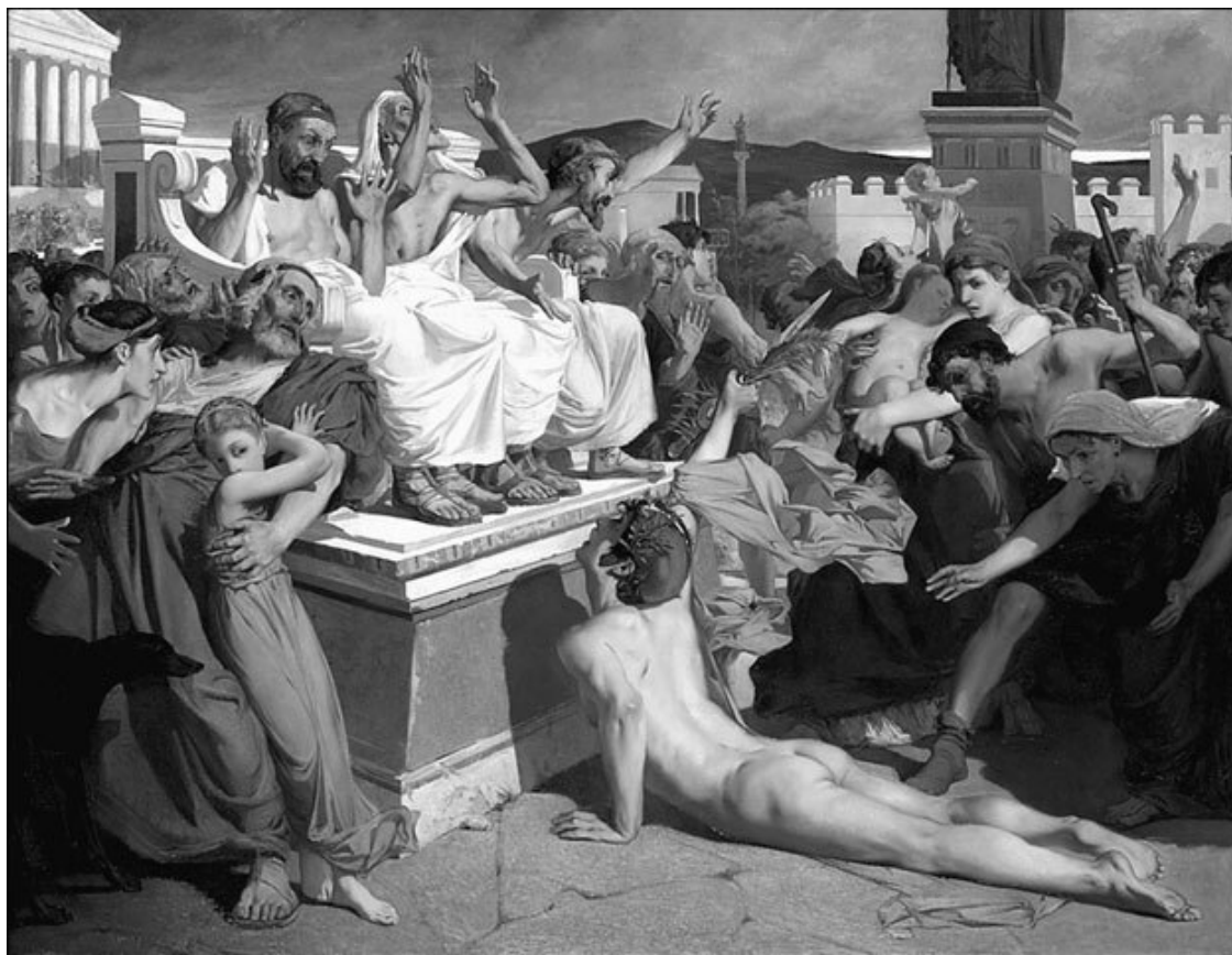
Гонец сообщает народу Афин о победе в битве при Марафоне. Художник Л. О. Меерсон. 1869 г.

В 490 г. до н. э., в год Марафонской битвы, не было этих удобных дорог. Марафон с Афинами связывала тропинка, пересекавшая Пентеликон. По-видимому, по ней и бежал в свой последний раз греческий скороход. А может быть, он огибал гору, не желая напрасно растрачивать силы? Кто знает? От древней тропы не осталось следа.