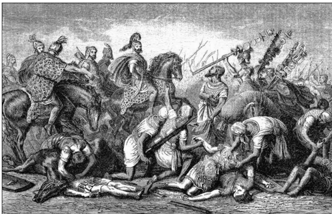
Ганнибал в битве при Каннах. Гравюра XIX в.

Ганнибал начал войну, несмотря на явное неравенство сил. В 220 г. до н. э. Рим при населении в 3,75 миллиона человек был в состоянии мобилизовать около 750 (древнегреческий историк Полибий) или даже 800 тысяч солдат (Тит Ливий). В то время Рим во всех отношениях превосходил Карфаген. Рим располагал огромной, мощной армией, привыкшей к победам, сильным флотом и немалыми денежными средствами. После Первой Пунической войны серьезно изменилось геополитическое положение Италии. Теперь Сицилия и Сардиния защищали итальянское побережье от нападений с моря; в то же время с территории этих островов можно было совершать вторжения в Африку – в Карфаген.