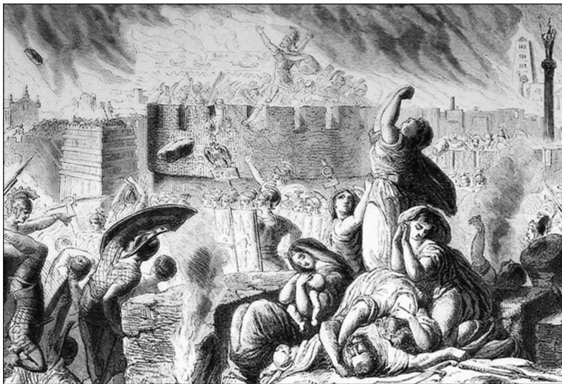
Разрушение Карфагена римлянами. Гравюра XIX в.

«Марк Порций Катон – один из первых римлян, которых мы и впрямь можем воспринимать как личность», – отмечал немецкий историк Ханс-Иоахим Герке, автор очерка «Marcus Porcius Cato Censorius – ein Bild von einem Römer» – «Марк Порций Катон Цензор – портрет одного римлянина» (2000). Рассказывая о нем, мы можем полагаться не только на приукрашенные предания и легенды, но и на его собственные признания, ведь он еще и первый прозаик Рима.