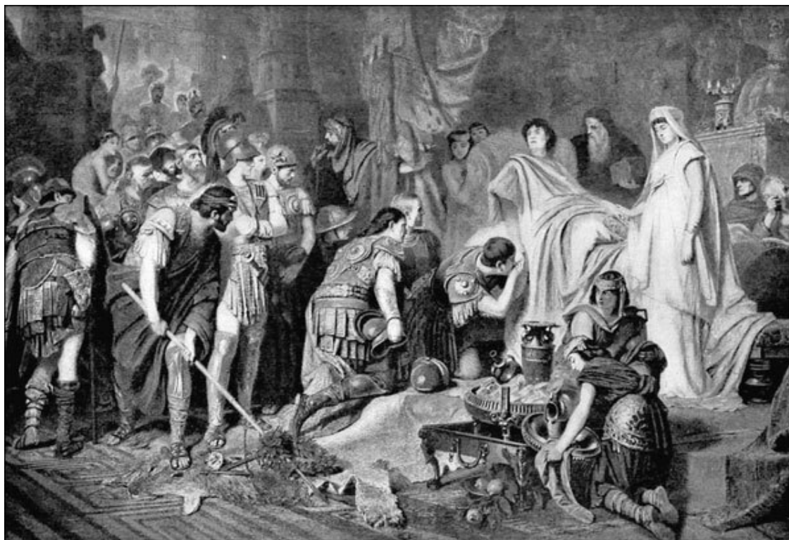
Смерть Александра Македонского. Гравюра 1886 г.

Историк Эфипп (IV в. до н. э.) сообщил о последних минутах жизни царя: «Он взял сосуд, сделал энергичный глоток, но не справился с ним, а тотчас отшатнулся назад на подушки, выпустив сосуд из рук».