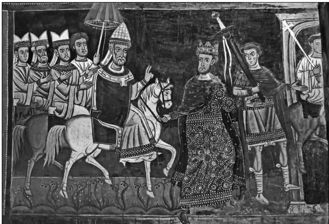
Константин I ведёт под уздцы коня, на котором восседает Папа Сильвестр I. Фреска капеллы Сан-Сильвестро в римском монастыре Санти-Куаттро-Коронати

Документ произвел на короля Пипина сильное впечатление. В 755 году он отправляется на битву с лангобардами, наносит им сокрушительное поражение и заставляет признать власть франков. Папство спасено. Вся земельная собственность возвращена церкви, которая вместе с Римом составила особое государство, в котором Папа являлся не только религиозным, но и светским правителем. Стефан же лично короновал Пипина, обязав франков выбирать королей из числа его потомков. В случае же неповиновения виновные могли быть отлучены от церкви.