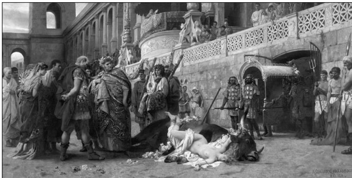
Христианская Дирижа в цирке Нерона. Художник Г. И. Семирадский

«И вот Нерон, – пишет Тацит в 15-й главе, – чтобы побороть слухи, приискал виноватых и предал изощреннейшим казням тех, кто своими мерзостями навлек на себя всеобщую ненависть и кого толпа называла христианами. Христа, от имени которого происходило это название, казнил при Тиберии прокуратор Понтий Пилат; подавленное на время, это зловерное суеверие стало вновь прорываться наружу, и не только в Иудее, откуда пошла эта пагуба, но и в Риме, куда отовсюду стекается все наиболее гнусное и постыдное, и где оно находит приверженцев. Итак, сначала были схвачены те, кто открыто признавал себя принадлежавшим к этой секте, а затем по их указанию и великое множество прочих, избличенных не столько в злодейском поджоге, сколько в ненависти к роду людскому. Их умерщвление сопровождалось издевательствами, ибо их облачали в шкуры диких зверей, дабы они были растерзаны насмерть собаками, распинали на крестах или обреченных на смерть в огне поджигали с наступлением темноты ради ночного освещения. Для этого зрелища Нерон предоставил свои сады; тогда же он дал представление в цирке, во время которого сидел среди толпы в одежде возничего или правил упряжкой, участвуя в состязании колесниц. И хотя на христианах лежала вина и они заслужили самой суровой кары, все же эти жестокости пробуждали сострадание к ним, ибо казалось, что их истребляли не в видах общественной пользы, а вследствие кровожадности одного Нерона».