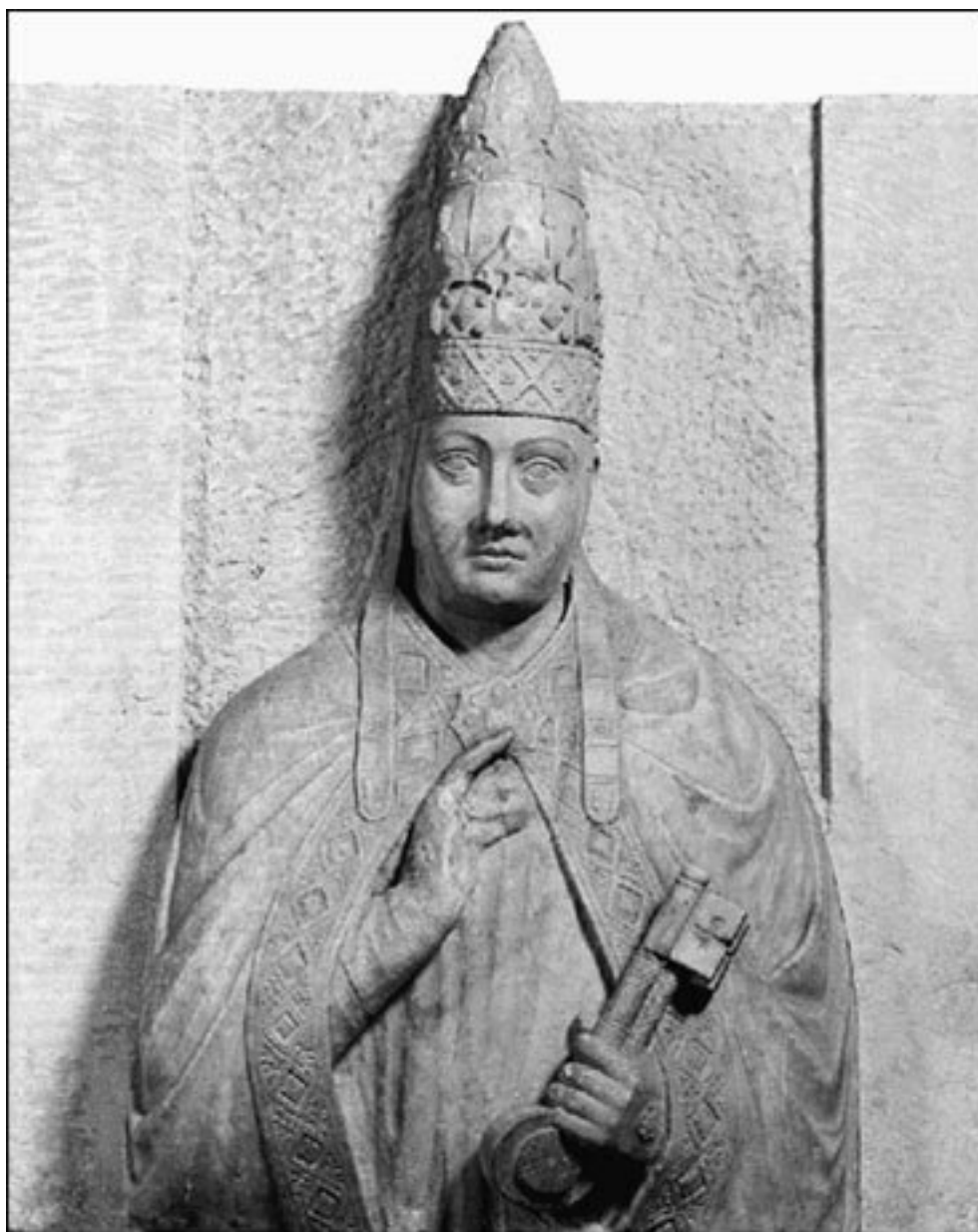
Бонифаций VIII. Изображение на надгробии

Взвесив все обстоятельства, связанные с данной традицией, Бонифаций VIII решил ее узаконить. И 23 февраля 1300 года появилась папская булла «Antiquorum habet», которая и положила начало римским Юбилейным годам. В соответствии с решением понтифика, они должны были праздноваться в начале каждого нового столетия. При этом жителям Рима булла предписывала посещать базилики тридцать дней, а прибывшим из провинций или из других стран – пятнадцать. Причем эти дни могут следовать и непрерывно, и с промежутками, главное, чтобы каждый богомolec посетил хотя бы по одному разу обе базилики. И тот, кто выполнил это условие в течение Юбилейного года, получал индульгенцию.