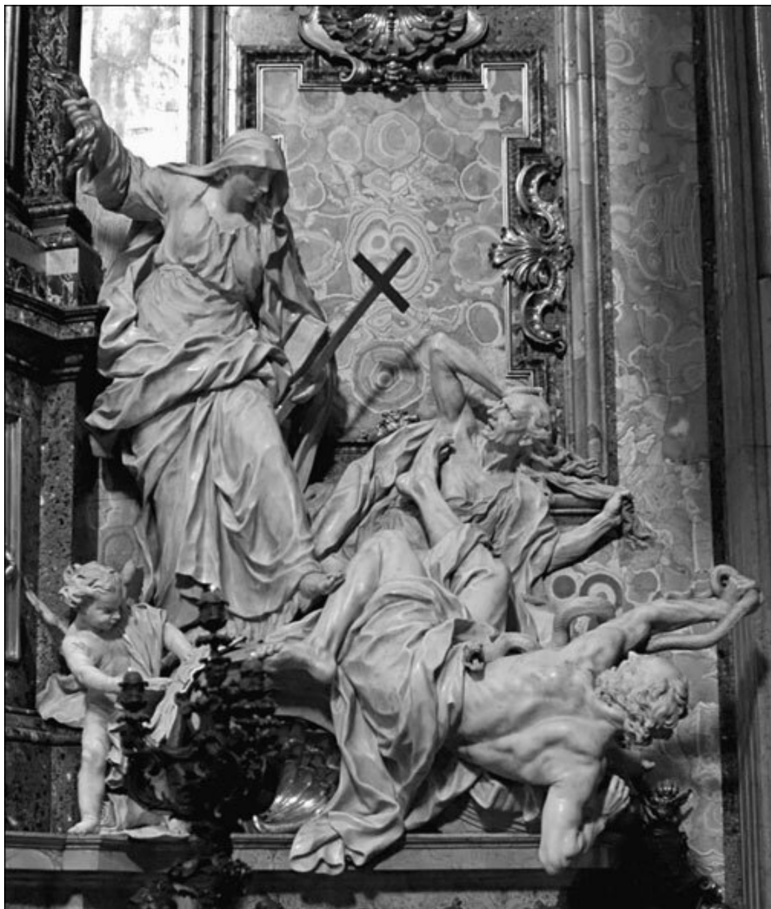
Религия изгоняет Ересь и Ненависть.

Скульптурная группа в алтаре Святого Игнатия церкви Иль-Джезу, Рим