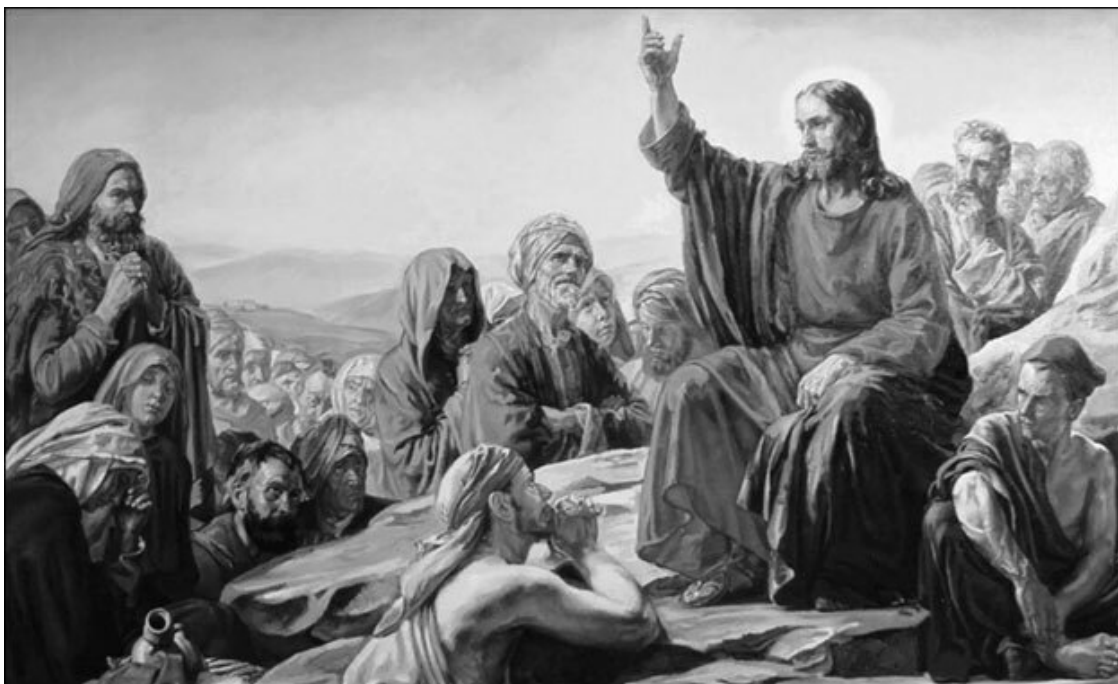
Нагорная проповедь. Художник К.-Г. Блох

Но в последние два столетия ситуация с критикой христианского учения стала кардинально меняться. И связано это было с научным исследованием Нового Завета и других христианских книг, а также в целом христианской истории.