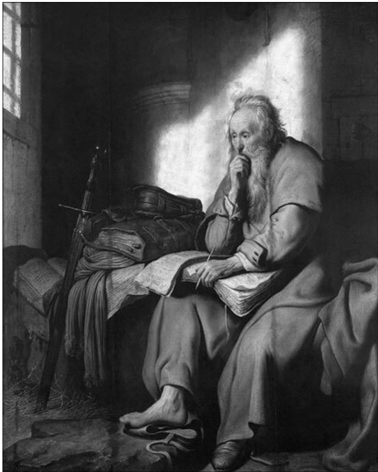
Апостол Павел в темнице. Художник Рембрант