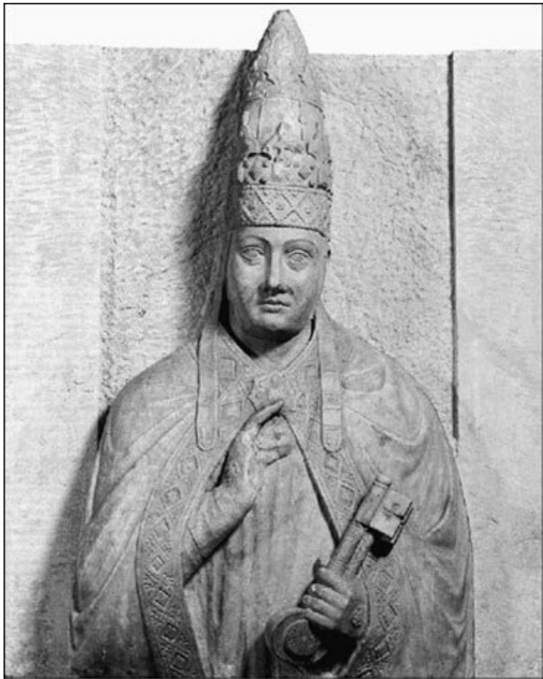
Бонифаций VIII. Изображение на надгробии