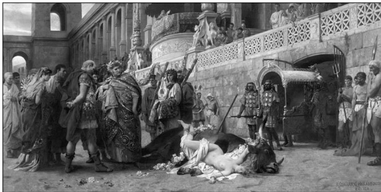
Христианская Дирижа в цирке Нерона. Художник Г. И. Семирадский

«И вот Нерон, – пишет Тацит в 15-й главе, – чтобы побороть слухи, приискал виноватых и предал изощреннейшим казням тех, кто своими мерзостями навлек на себя всеобщую ненависть и кого толпа называла христианами. Христа, от имени которого происходило это название, казнил при Тиберии прокуратор Понтий Пилат; подавленное на время, это зловерное суеверие стало вновь прорываться наружу, и не только в Иудее, откуда пошла эта пагуба, но и в Риме, куда отовсюду стекается все наиболее гнусное и постыдное, и где оно находит приверженцев. Итак, сначала были схвачены те, кто открыто признавал себя принадлежавшим к этой секте, а затем по их указанию и великое множество прочих,