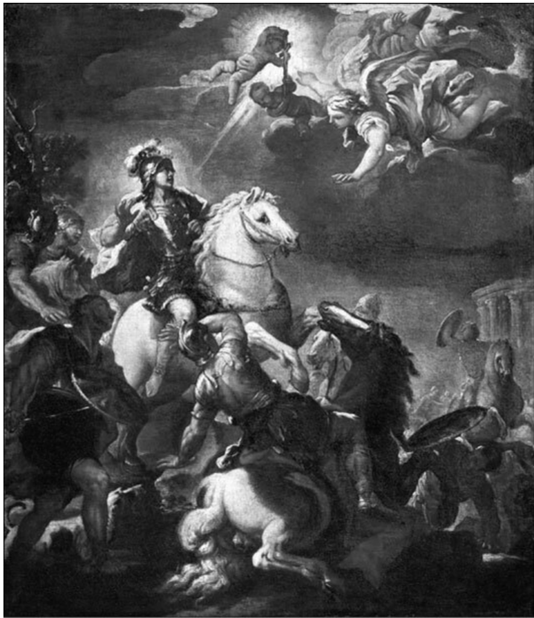
Явление креста Константину. Художник Л. Джордано

Но все резко изменилось, когда императором Римской