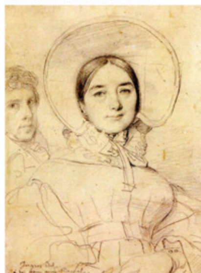
Энгр. Мадам Энгр