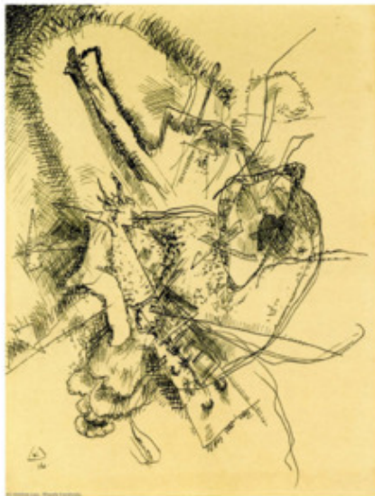
В. Кандинский. Рисунок