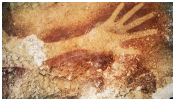
Изображение руки. о. Сулавеси Около 40 тыс. лет до н.э.

Рисунок возник в период первобытного строя как отражение формирующегося культа Зверя, простейший путь передачи информации, способ самоутверждения человека в агрессивной среде.