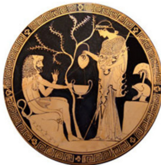
Геракл и Афина. Около 480-470 г. до н.э.

Период Средневековья связан с развитием христианства. В искусстве появляются священные изображения (иконы) как форма проявления Божественной истины, посредник между миром божественным и земным. В это время складываются иконописные каноны, происходит отход от натуралистической чувственности периода античности, изображения становятся более условными, лица сменяются ликами, вобравшими в себя телесное и духовное, чувственное и сверхчувственное.