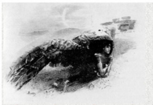
М. Врубель. Демон летящий. Творческий рисунок

По целеполаганию рисунок может быть учебным или творческим .