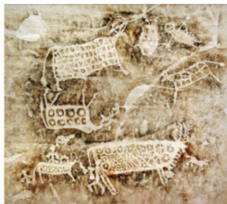
Петроглифы Калбак-Таш. Алтай

С возникновением государств резко меняется характер рисунка. Древнего художника привлекают не социально – бытовые явления, а события государственной значимости. Действующие персонажи отступают на второй план, поэтому они условны и статичны.