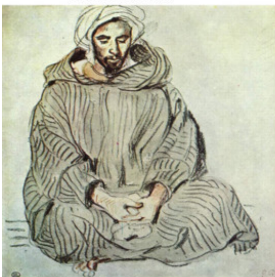
Делакруа. Сидящий араб в Танжере