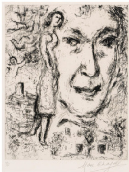
М. Шагал. Автопортрет