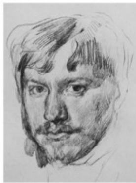
В. Серов. Автопортрет Кратковременные рисунки