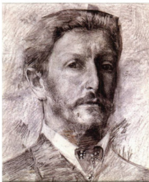
М. Врубель. Автопортрет