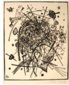
В. Кандинский. Композиция Абстрактный рисунок

Рисунок, выполненный на высоком профессиональном уровне, обладающий художественной ценностью, приобретает статус произведения изобразительного искусства.