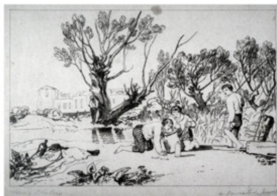
Тёрнер. Маленькие рыбаки