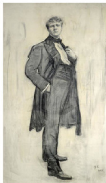
В. Серов. Портрет Ф. Шаляпина

Элементы нового подхода к рисунку, отход от реализма, символичность появляются в конце XIX века.