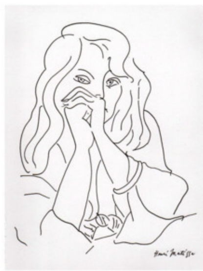
Матисс. Портрет женщины

Современный рисунок отличается не только многообразием направлений и стилей, но и самим подходом к нему. Он постоянно развивается в соответствии с современными запросами общества.