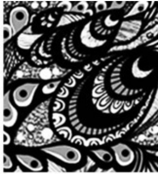
Ракушки Декоративный рисунок