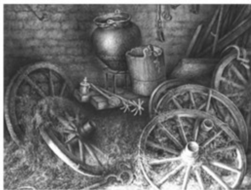
Гурам Доленджашвили. Моя Родина. Длительный рисунок

По характеру исполнения рисунок может быть длительным и кратковременным .