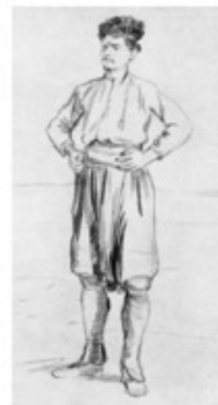
Ф. Малявин. Набросок Кратковременные рисунки

Длительный рисунок выполняется в течение многих часов, что позволяет тщательно прорисовать даже очень мелкие детали.