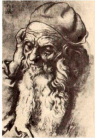
Дюрер. Портрет старика