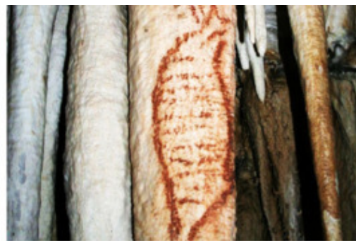
Рисунки неандертальцев. Нерха (Испания). Около 37 тыс. лет до н.э.