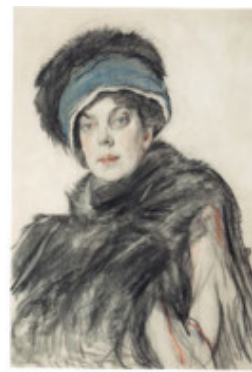
В. Серов. Портрет О. Орловой Тональный рисунок

По назначению можно выделить конструктивный, линейный и тональный рисунок.