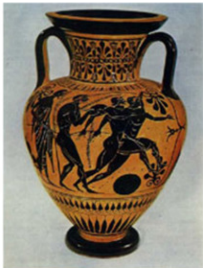
Атлеты и судия. VI в. до н.э.

Художник Древней Греции любит создания Природы, венцом которых является Человек. Поэтому, он внимательно изучает человека, как объект изображения.