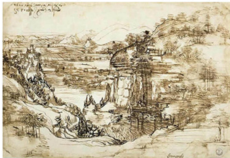
Леонардо да Винчи. Пейзаж долины реки Арно

В последующие столетия рисунок развивается и достигает невероятного расцвета в XIX веке. К этому времени получает широкое распространение графитовый карандаш. Карандашом выполняются бытовые и пейзажные зарисовки, портреты, наброски людей и животных.