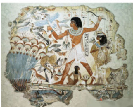
Охота на птиц