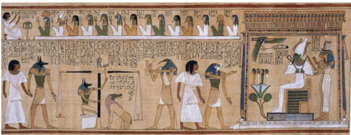
Рисунок из "Книги мёртвых" Хунефера. Около 1300г. до н.э.

Рисунок Древнего Египта был подчинен утверждению вечных и незыблемых ценностей: мощи государства, непостижимости обожествляемой власти, системы религиозных верований и ритуалов. Поэтому египетский художник, отражая многие стороны человеческой жизни, строго придерживается разработанных канонов и символов.