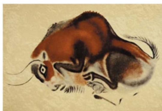
Раненый бизон. Альтамиральская пещера (испания). Около 15-18 тыс. лет до н.э.

Особенностью наскального рисунка этого периода является незримое присутствие человека, то, как стороннего наблюдателя, то, как участника событий, последствия деятельности которого, мы можем наблюдать в рисунках.