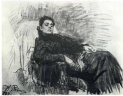
И.Е. Репин. Портрет Элеоноры Реалистический рисунок