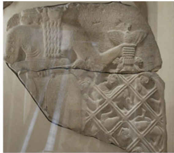
Стела коршунов. 3 тыс. лет до н.э.

Рисунок Древнего Египта был подчинен утверждению вечных и незыблемых ценностей: мощи государства, непостижимости обожествляемой власти, системы религиозных верований и ритуалов. Поэтому египетский художник, отражая многие стороны человеческой жизни, строго придерживается разработанных канонов и символов.