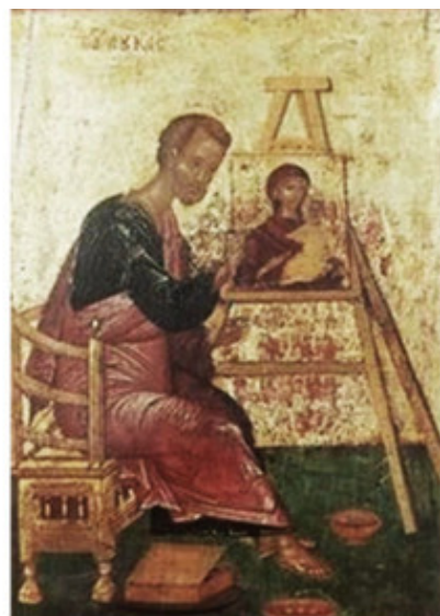
Евангелист Лука пишет икону Богородицы. XVI век

Эпоха Возрождения знаменуется возрастанием роли художника в обществе и, как следствие, качественным изменением рисунка. В эпоху Возрождения рисунок приобретает привычное для нас понимание, разрабатываются законы и приемы реалистического изображения