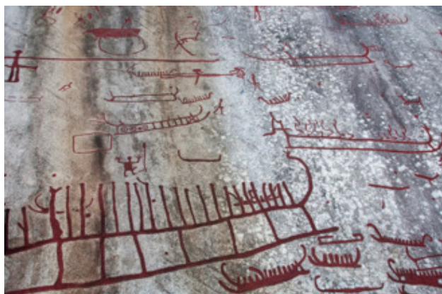
Охотники и олени. Чукотка

Среди петроглифов встречаются орнаментальные, анималистические, скотоводческие, охотничьи, культовые и бытовые изображения. Они датируются от эпохи Палеолита до Средневековья.