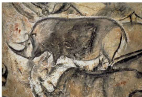
Носорог. Пещера Шове (Франция) Около 32 тыс лет до н.э.