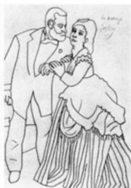
О. Ренуар. Сислей с женой Линейный рисунок

Учебный рисунок выполняется начинающими художниками для освоения изобразительной грамоты и техникой рисования.