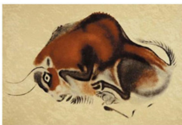
Раненый бизон. Альтамирская пещера (Испания). Около 15-18 тыс. лет до н.э.

Особенностью наскального рисунка этого периода является незримое присутствие человека, то, как стороннего наблюдателя, то, как участника событий, последствия деятельности которого, мы можем наблюдать в рисунках.