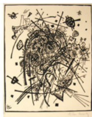
В. Кандинский. Композиция Абстрактный рисунок

Рисунок, выполненный на высоком профессиональном уровне, обладающий художественной ценностью, приобретает статус произведения изобразительного искусства .