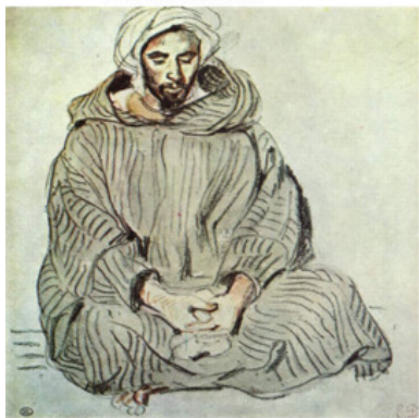
Делакруа. Сидящий араб в Танжере