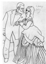
О. Ренуар. Сислеи с женой Линейный рисунок

Учебный рисунок выполняется начинающими художниками для освоения изобразительной грамоты и техники рисования.