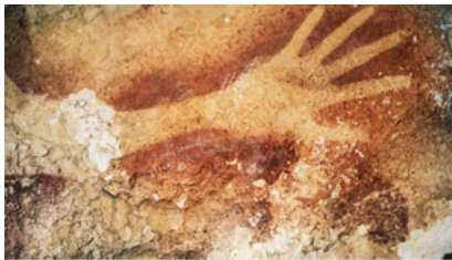
Изображение руки. о. Сулавеси Около 40 тыс. лет до н.э.