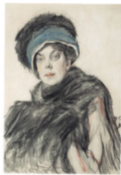
В. Серов. Портрет О. Орловой Тональный рисунок

По назначению можно выделить конструктивный, линейный и тональный рисунок.