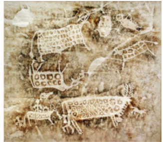
Петроглифы Калбак-Таш. Алтай

С возникновением государств резко меняется характер рисунка. Древнего художника привлекают не социально – бытовые явления, а события государственной значимости. Действующие персонажи отступают на второй план, поэтому они условны и статичны.