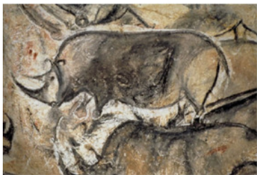
Носорог. Пещера Шове (Франция) Около 32 тыс лет до н.э.