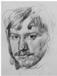
В. Серов. Автопортрет Кратковременные рисунки