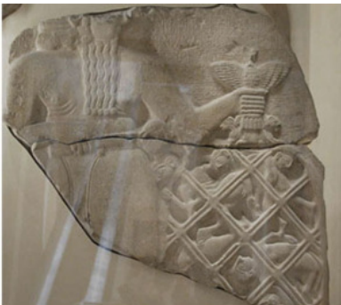
Стела коршунов. 3 тыс. лет до н.э.

Рисунок Древнего Египта был подчинен утверждению вечных и незыблемых ценностей: мощи государства, непостижимости обожествляемой власти, системы религиозных верований и ритуалов. Поэтому египетский художник, отражая многие стороны человеческой жизни, строго придерживается разработанных канонов и символов.