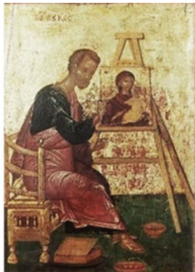
Евангелист Лука пишет икону Богородицы. XVI век

Эпоха Возрождения знаменуется возрастанием роли художника в обществе и, как следствие, качественным изменением рисунка. В эпоху Возрождения рисунок приобретает привычное для нас понимание, разрабатываются законы и приемы реалистического изображения