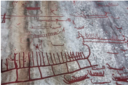
Охотники и олени. Чукотка

листические, скотоводческие, охотничьи, культовые и бытовые изображения. Они датируются от эпохи Палеолита до Средневековья.