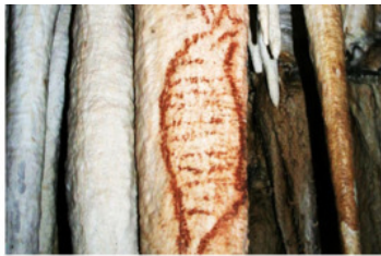
Рисунки неандертальцев. Нерха (Испания). Около 37 тыс. лет до н.э.