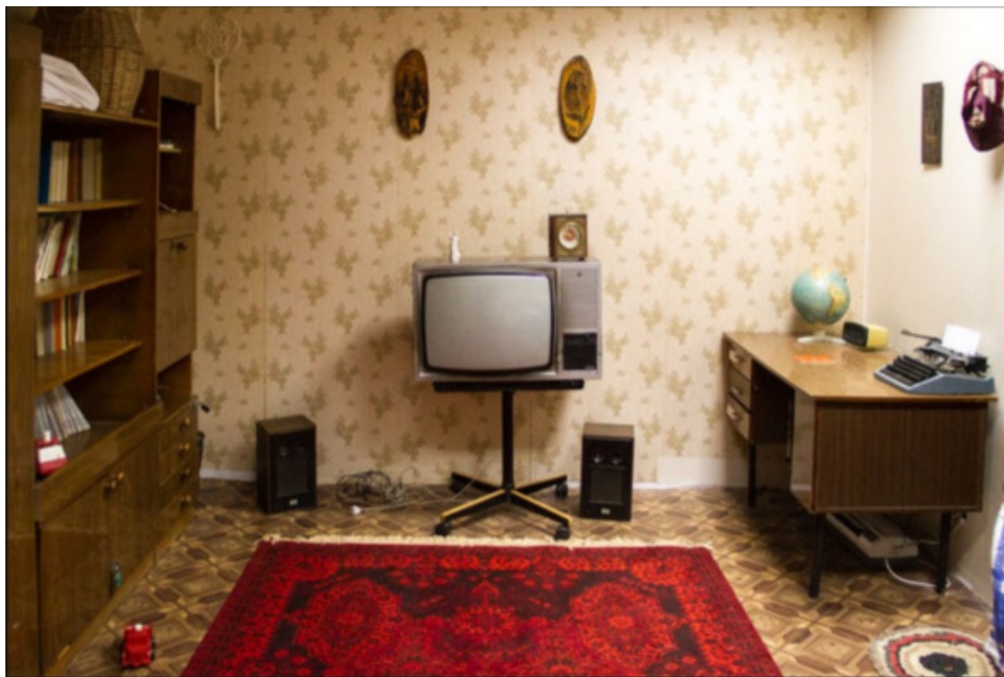
Домашний уют 70-х в СССР

А так уж ли необратим этот «развитой»? Должен сказать, что я выросл и развивался вместе с социализмом. Постепенно уходили в прошлое сталинский террор и суровая рука пролетариата, который я с детства привык почитать как почитали раньше духовенство. Уходили в прошлое и голодные послевоенные годы. Приходил относительный достаток и обустроенность: вода, туалет, душ, газовое отопление, холодильник и телевизор-все, что когда то казалось немислимой роскошью приходило в квартиры (на жилплощадь) рядовых тружеников.