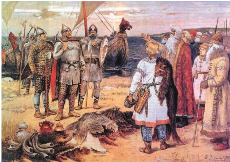
«Прибытие Рюрика в Ладогу». Картина В. М. Васнецова

Пришла уже пора признать: повезло нам с отцом-основателем. Рюрик с дружиной не стали истреблять чуждые им племена, многие из которых жили, согласно летописям, в лесах «аки звери», а с готовностью восприняли местный язык, дали название своей новой родине и стали правящей элитой.