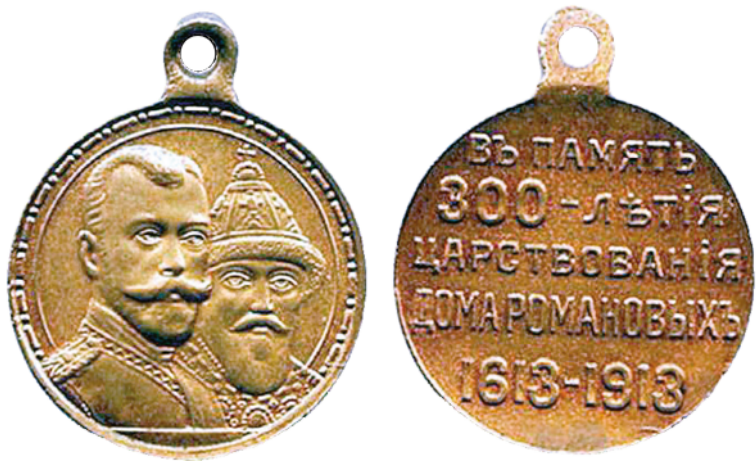
Медаль «В память 300-летия царствования дома Романовых»

Открытие памятника к 300-летию дома Романовых сначала хотели приурочить к юбилейной дате – 21 февраля 1913 года, затем к приезду императорской четы в Москву – в конце мая 1913 года, но в итоге царь только в мае ознакомился с проектом, будучи в Городской думе, и одобрил его. 18 апреля 1914 года состоялась торжественная закладка, а 10 июля памятник под названием «Обелиск в память 300-летия царствования дома Романовых» был торжественно открыт.