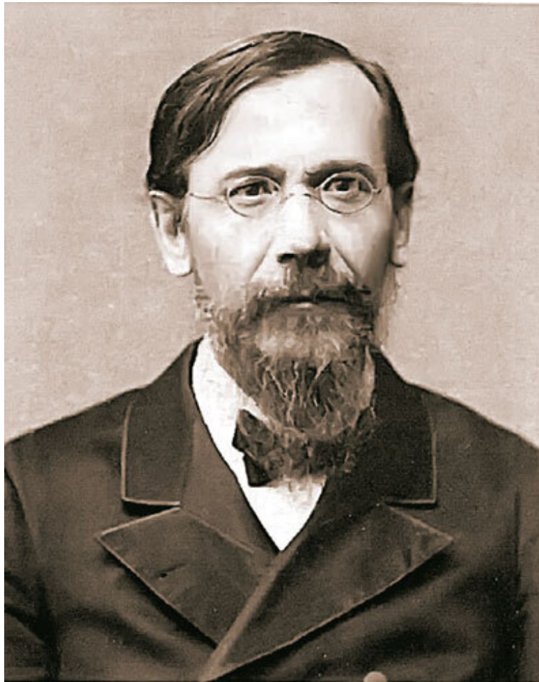
Василий Осипович Ключевский