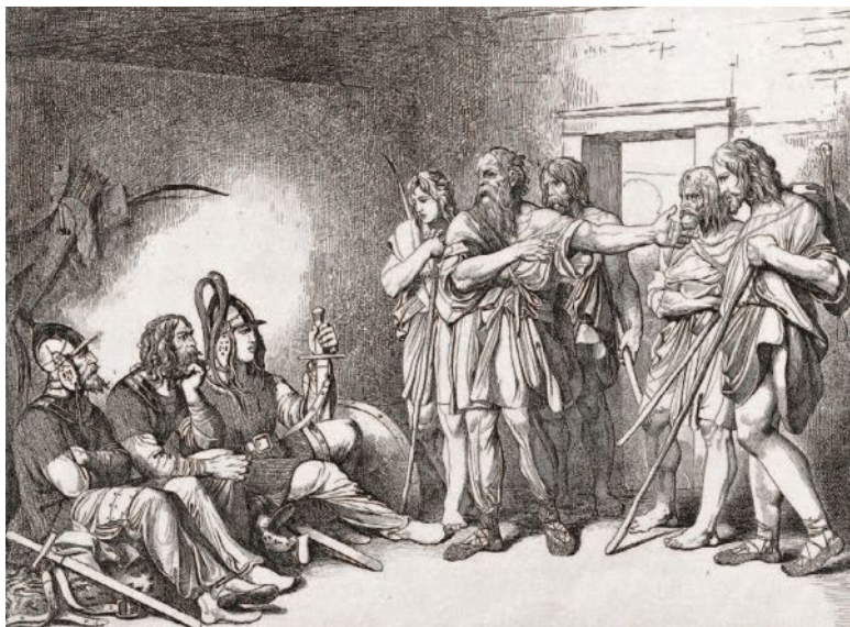
«Призвание варягов». Гравюра Ф. А. Бруни, 1839

Ведь согласно официальной историографии, более тысячи лет тому назад наши пращуры призвали «из-за моря» варяга Рюрика со товарищи, от которых, как известно из летописей, «есть пошла русская земля».