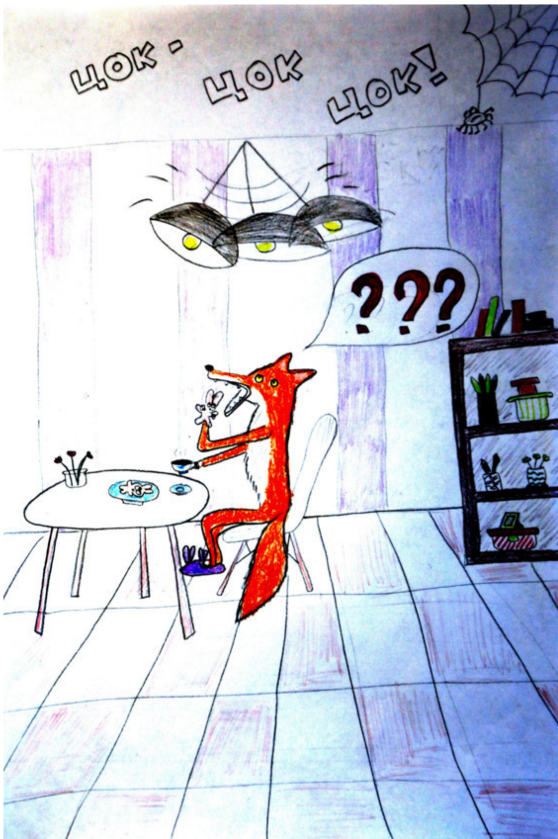
Лиса завтракала печеными зайцами и услышала цокот (как ей показалось) копыт по железной крыше. «Неужели лоси забрались?»