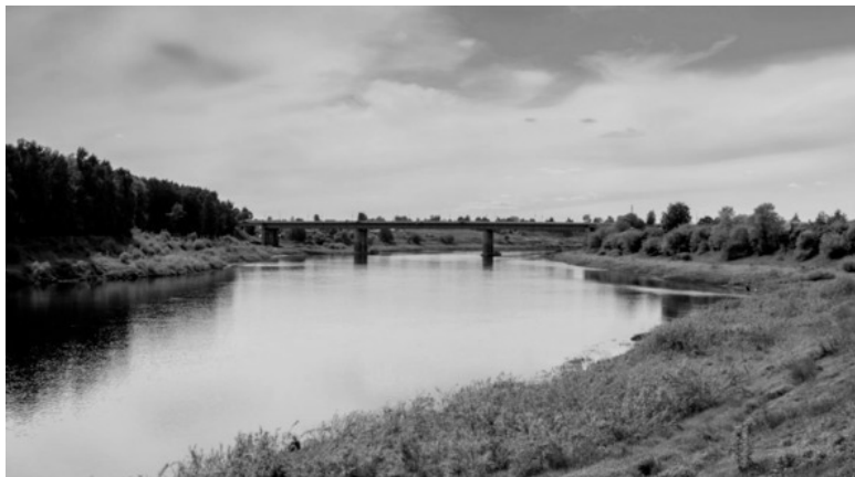
Река Западная Двина

Западная Двина (бел. Заходняя Дзвіна) – река, проходящая по территории трёх стран (Россия, Латвия, Беларусь). На территории Латвии река именуется Даугава. Длина реки – 1020 км, в том числе, в Беларуси – 328 км.