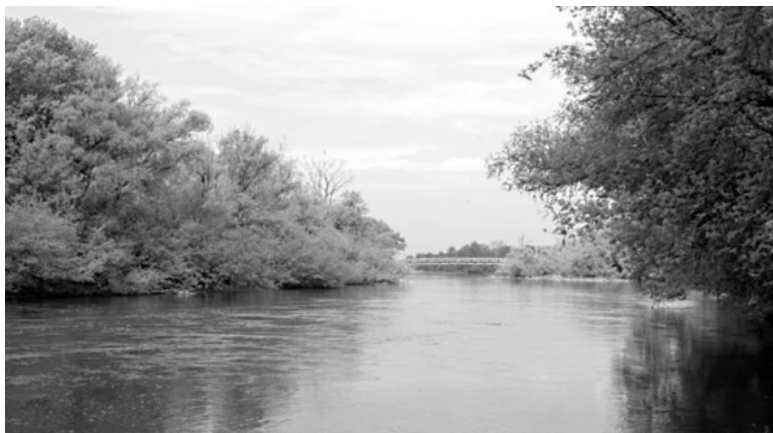
Река Западный Буг

Западный Буг (бел. Заходні Буг) – это река в восточной Европе. Протекает по землям Украины, Польши и Беларуси. Общая протяжённость Западного Буга – 772 км, из них по территории Беларуси – 154 километра.