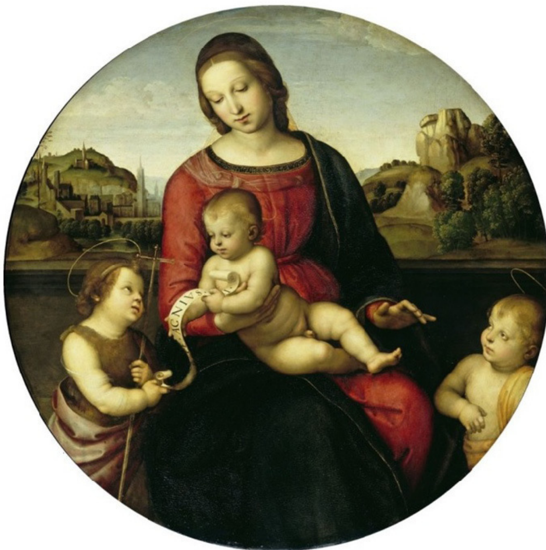
Рафаэль Санти. Мадонна Террануова

На фресках в центральной части картины изображен Иисус – мальчик сидящий на троне в величии мудрого проповедника. Второй Иисус – ученые богословы утверждают, старший – изображен слева. Он как бы уходит со сцены евангельского повествования.