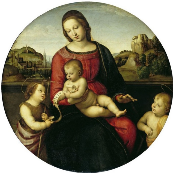
Рафаэль Санти. Мадонна Террануова