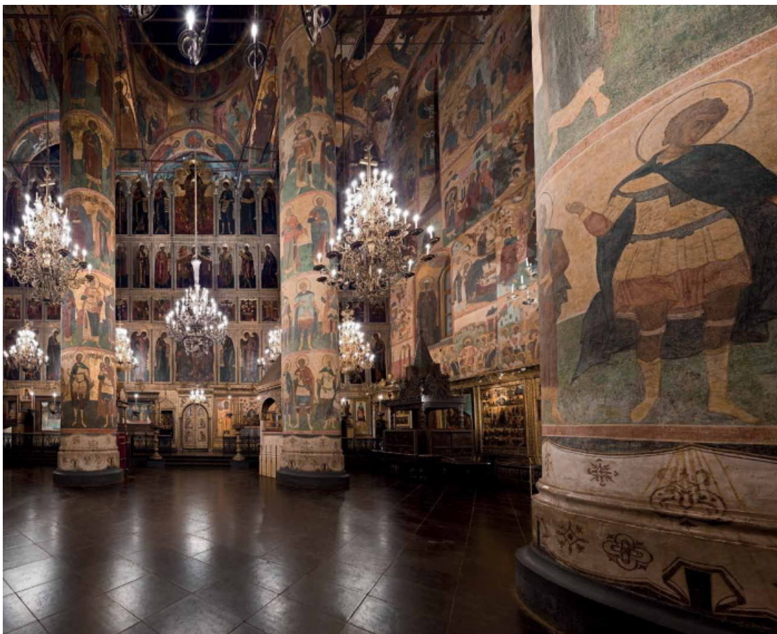
2. Успенский собор Московского Кремля. Центральное пространство. Вид на Мономахов трон. ММК