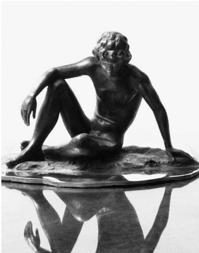
Михаил Лушников, Нарцисс, 2004 (фрагмент)