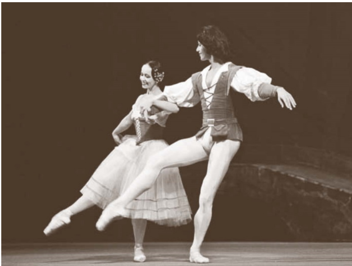
«Жизель». Альберт – Николай Цискаридзе. Большой театр, 1998 год

Обычно балеринам удается либо первый акт, а второй похуже, либо наоборот. А у нее равнозначны и убедительны оба акта.