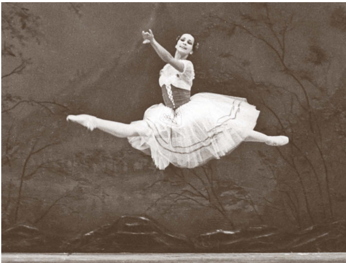
«Жизель». Большой театр, 1975 год

Сравнение с этой фотографией убедило маму, что меня надо отвести учиться в Тбилисское хореографическое училище, и вскоре меня туда приняли.