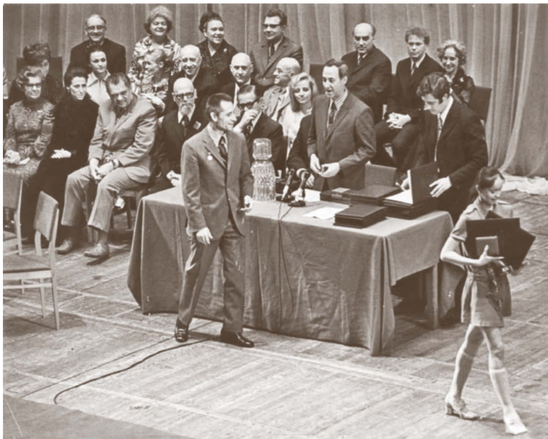
Вручение Гран при II Международного конкурса артистов балета в Москве. Большой театр, 1973 год