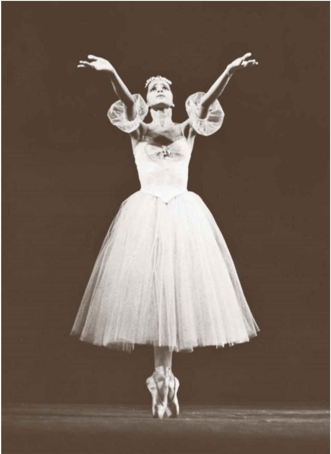
«Жизель». Ленинградский театр оперы и балета, 1974 год