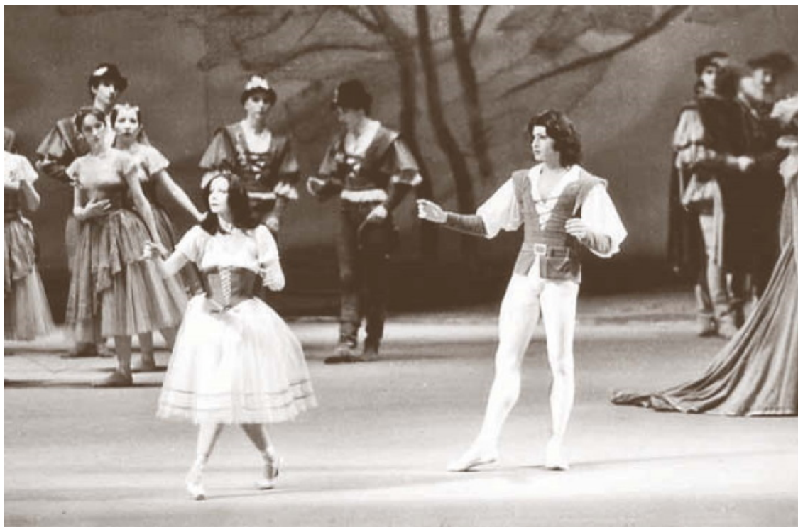
«Жизель». Альберт – Николай Цискаридзе. Большой театр, 1998 год