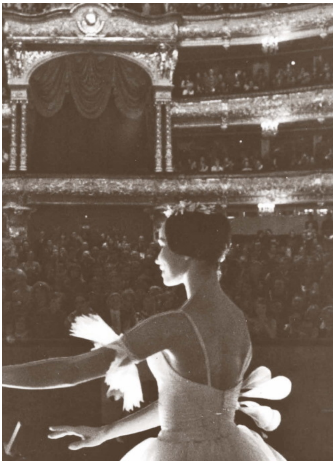
«Щелкунчик». Принц – Владимир Васильев. Большой театр, 1977 год