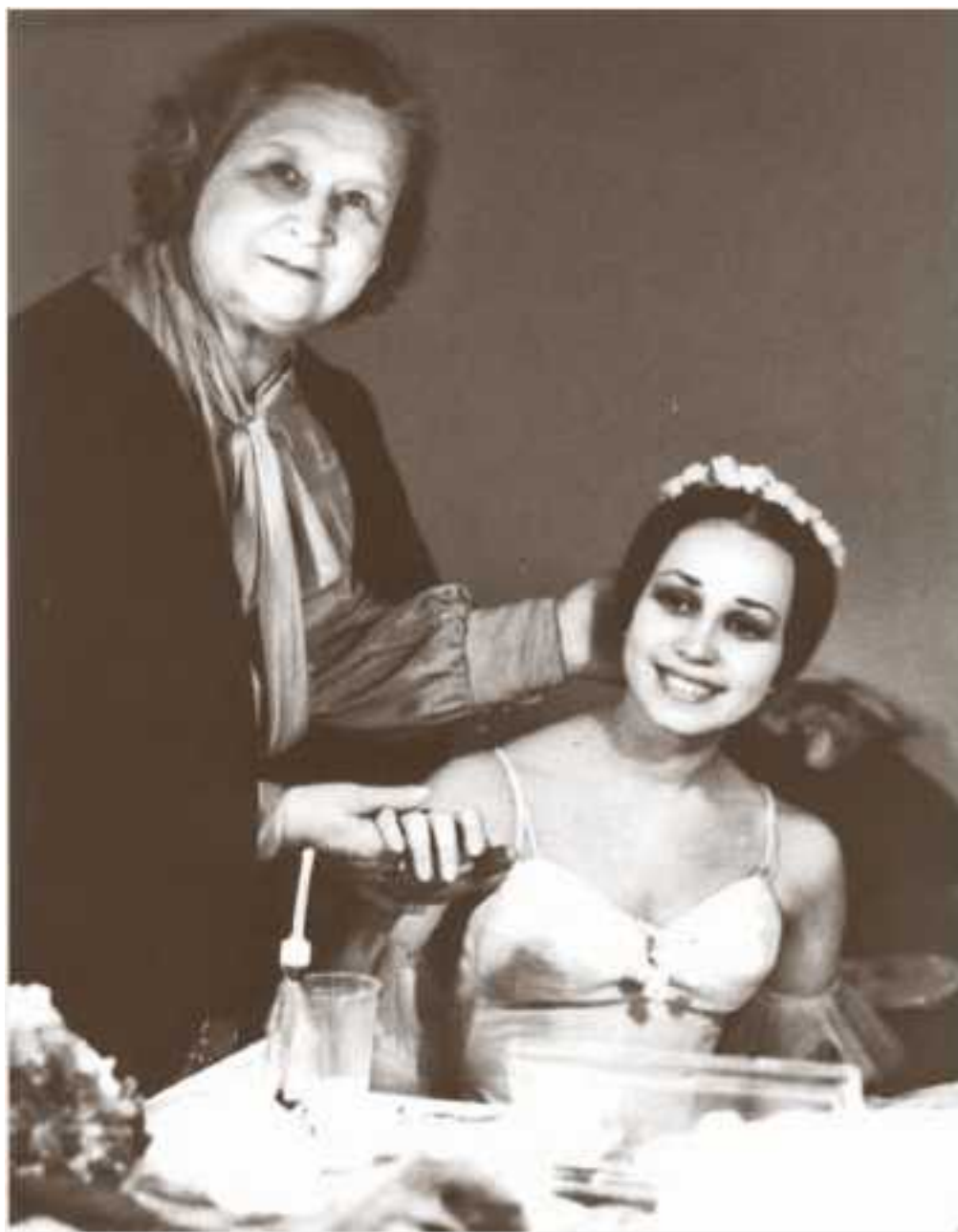
С Мариной Семеновой в гримерной Большого театра. 1978 год

тому моменту не работали (хотя много лет она была педагогом Павловой в Большом театре), ответила просто: «Возьми репетицию». И они готовили роль вместе. В это время я учился в институте на педагога, и Марина Тимофеевна погружала меня в профессию, поэтому я постоянно сидел на их репетициях. Было безумно интересно наблюдать за этим процессом, и я видел, что и та и другая очень счастливы. Когда пересматриваю записи «Сильфиды» с Надеждой Павловой, каждый раз убеждаюсь, что она бесподобна в этой роли. Надежда Васильевна понимала Семенову с полуслова. Здесь, конечно, было удивительное сочетание двух величайших мастеров – балерины и педагога.