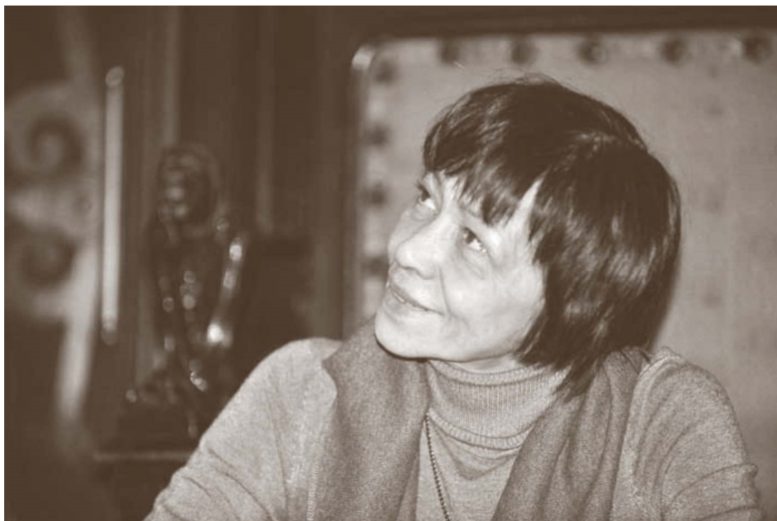
В Государственном центральном Театральном музее им. А.А. Бахрушина, 2016 год

После ее ухода со сцены прошло 30 лет, теперь она педагог-балетмейстер Большого театра и ее отношение к слову, конечно же, изменилось. С тех пор изменилось многое.