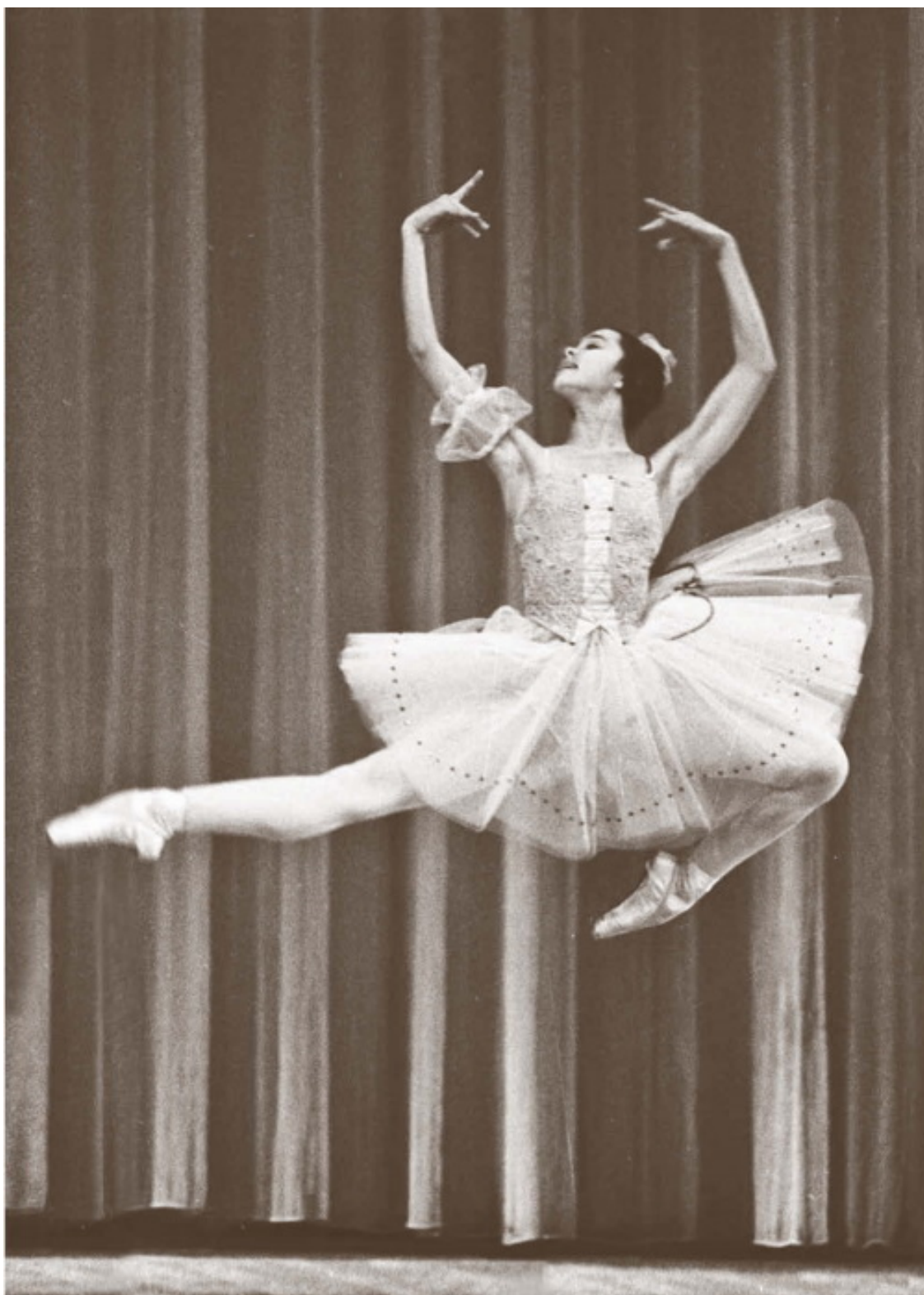
«Тщетная предосторожность», в партии Лизы, 1973 год

Ни коробки конфет с изображением ее батмана, ни гигантские пачки газет с рецензиями, ни очереди зимними ночами у театральных касс, зафиксированные фотообъективом, не передают ошеломляющей притягательности ее сценического образа даже для людей, весьма далеких от балета. Многочисленные рецензии тех лет, толком не объясняя феномена, все это подтверждают. Дело было не только в открытых ею новых профессиональных возможностях –