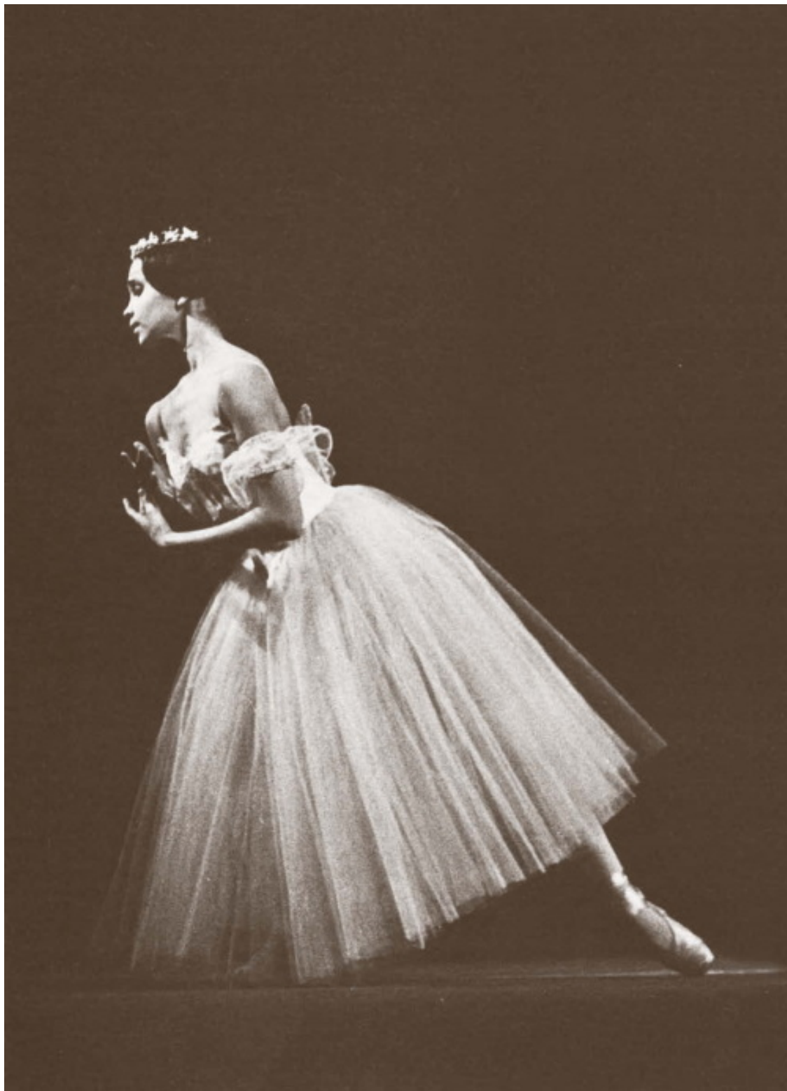
«Жизель». Пермский театр оперы и балета, 1974 год.

Это добавило мистики происходящему и впоследствии каждый раз в этом месте я вспоминал свой первый спектакль. В тот вечер у меня было ощущение, что происходит что-то невероятное еще и потому, что мы танцевали 22 мая, в день святого Николая, что стало для меня двойным праздником.