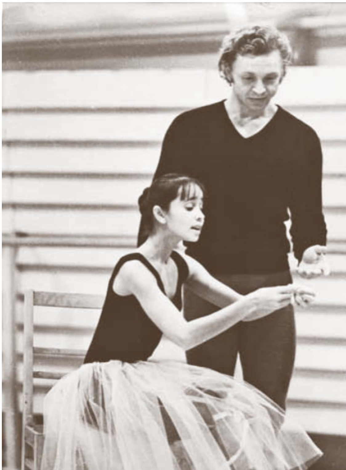
В репетиционном зале Ленинградского театра оперы и балета Надежда Павлова и артист театра Юрий Соловьев на репетиции балета «Жизель», 1974 год