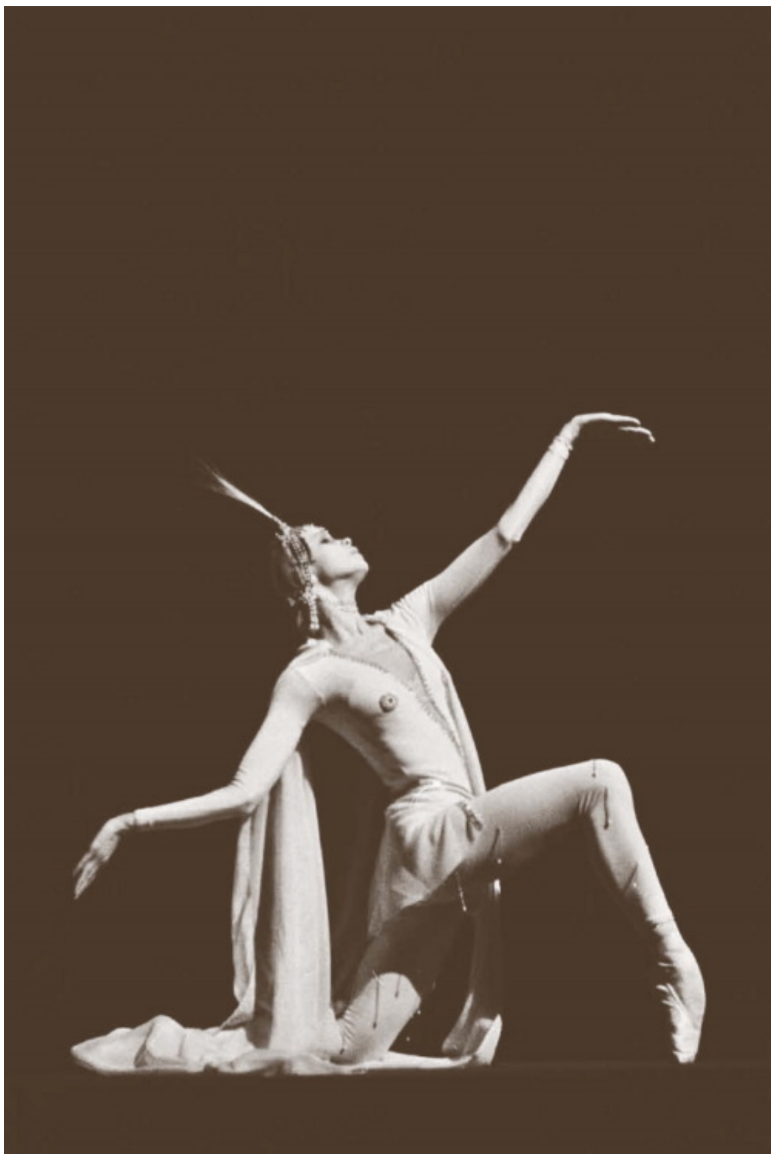
«Легенда о любви», в партии Ширин. Большой театр, 1978 год