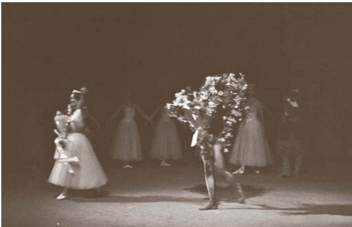
На верхнем фото «Жизель». Пермский театр оперы и балета, 1974 год