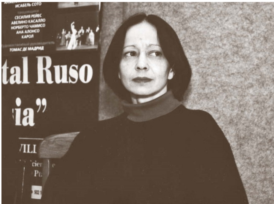
В Чувашском театре оперы и балета, 2001 год

Около 11 утра ее можно было встретить в метро. Минуя эскалатор, извилистые метрополитеновские коридоры, она длинными и легкими шагами в два счета пересекала пространство нынешней Театральной. Ей было 32 года. В мои 12 казалось, что красивее этих шагов нет ничего, и следующие десять лет я мечтала научиться так ходить.