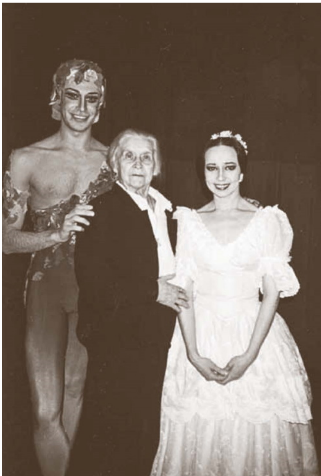
Слева: после премьеры балета «Видение розы». Николай Цискаридзе, Марина Семенова, Надежда Павлова. Большой театр, 1996 год

Потом прошло некоторое время, она сама неожиданно подошла к Марине Тимофеевне и сказала: «Мы с вами недоделали Сильфиду...» На это Марина Тимофеевна, с которой они к