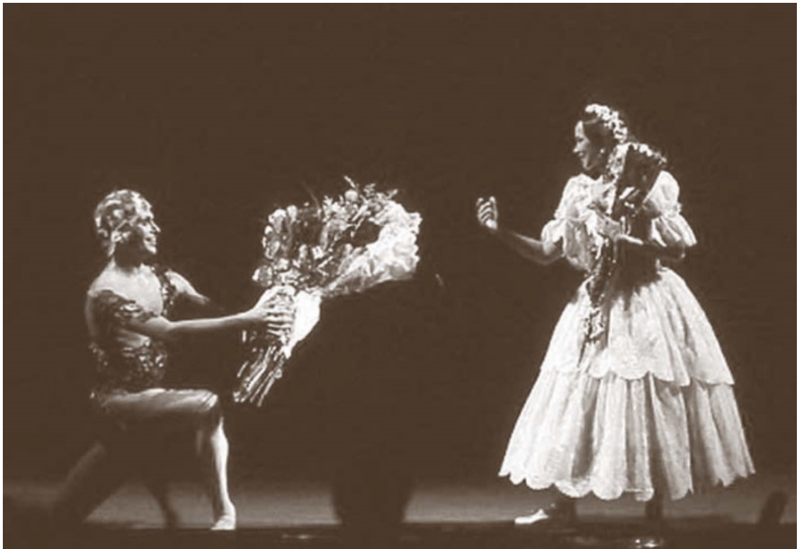
С Николаем Цискаридзе после спектакля «Видение розы». Большой театр, 1996 год

Артистов, которые олицетворяют Большой театр и составляют его славу, очень немного – много тех, кто там числится, десятилетиями борется за известность и разными ухищрениями и интригами добивается ставки. Но история стирает их имена, превращая в знаки препинания и междометия.