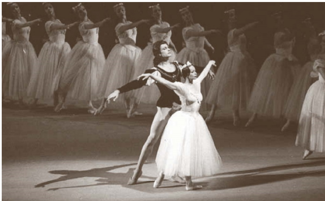
«Жизель», в партии Альберта Николай Цискаридзе. Большой театр, 1998 год