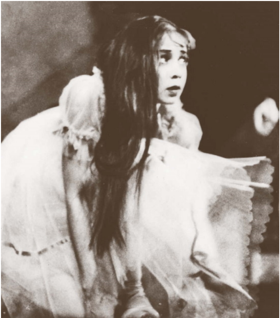
«Жизель». Большой театр, 1975 год

Меня никогда не интересовал этот человек, и я не обращал внимание на то, что происходит рядом.