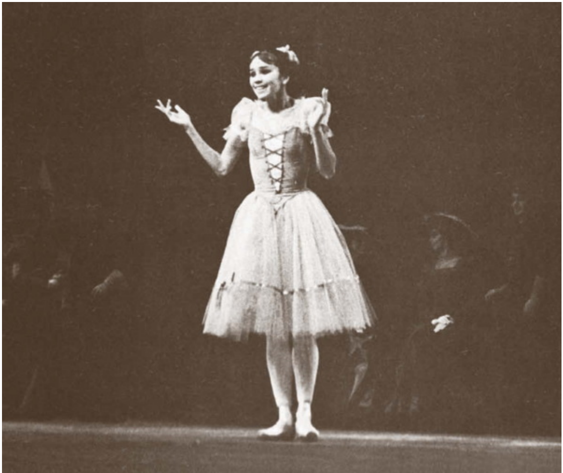
«Жизель». Ленинградский театр оперы и балета, 1974 год

И для нее, и для меня это была премьера, к которой мы долго готовились.