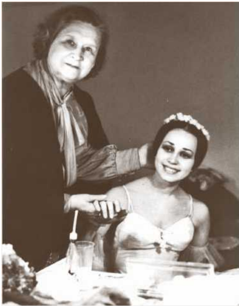
С Мариной Семеновой в гримерной Большого театра. 1978