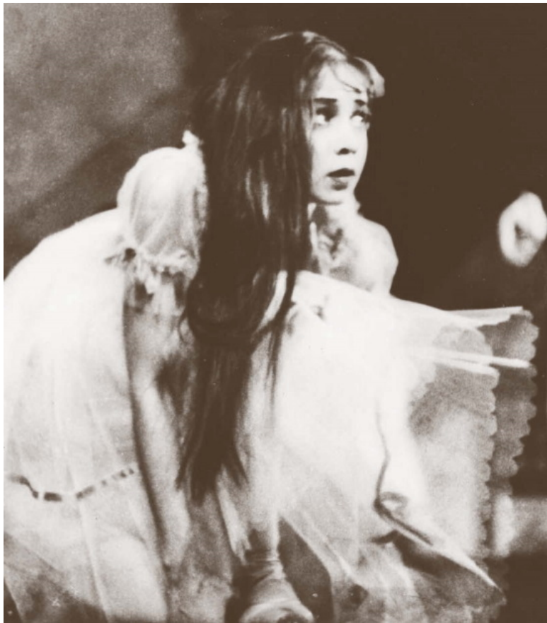
«Жизель». Большой театр, 1975 год

Меня никогда не интересовал этот человек, и я не обращал внимание на то, что происходит рядом.