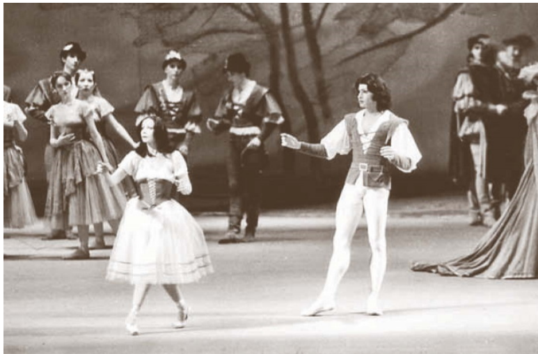
«Жизель». Альберт – Николай Цискаридзе. Большой театр, 1998 год