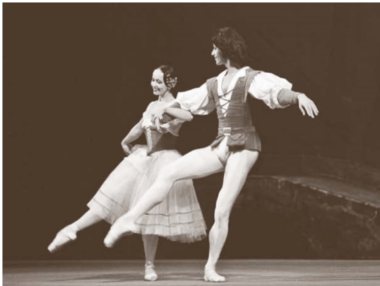
«Жизель». Альберт – Николай Цискаридзе. Большой театр, 1998 год

Обычно балеринам удастся либо первый акт, а второй похуже, либо наоборот. А у нее равнозначны и убедительны оба акта.