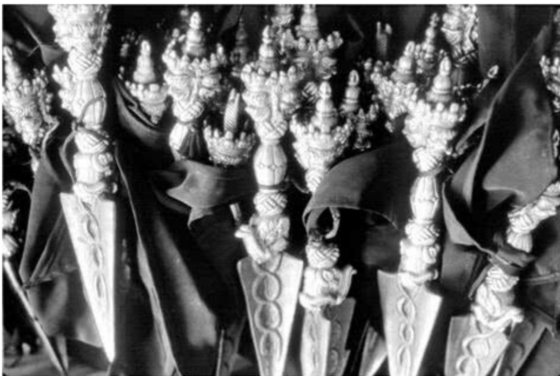
Пурбы — тибетские ритуальные кинжалы. Ралонг Гомпа, Сикким

Послушники начали громко радоваться удаче своего товарища, который смог проникнуть в видение и вынуть из него предмет. Дордже Дечен Лингпа просто улыбнулся.