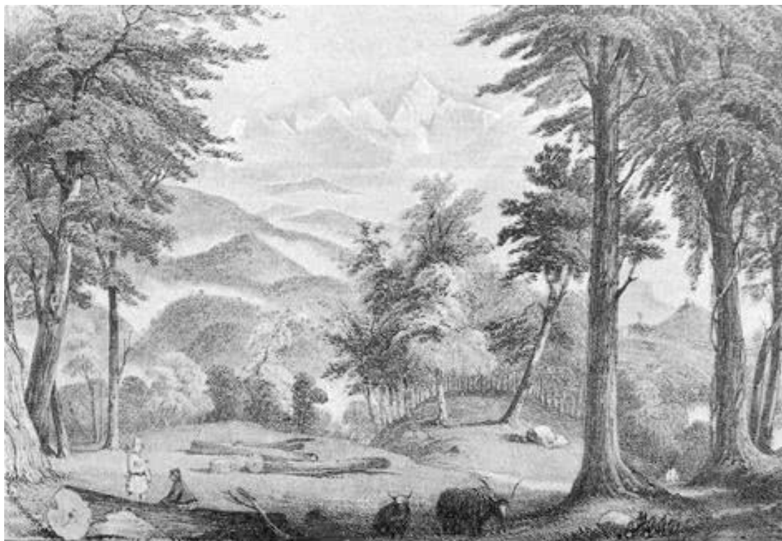
Вид на гору Канченджанга из Дарджилинга