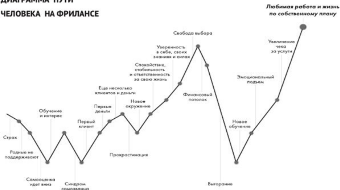
ДИАГРАММА ПУТИ ЧЕЛОВЕКА НА ФРИЛАНСЕ