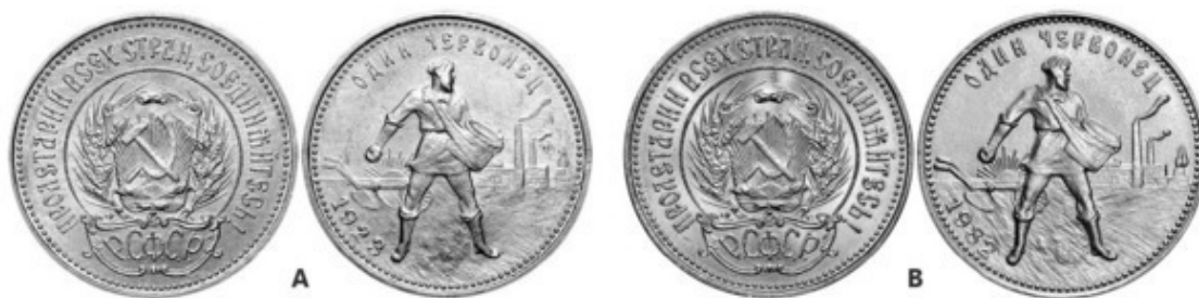
Рис. 15 – Золотой червонец «Сеятель». А – ориг. монета (1923); В – «новодел» (1982)

Не следует путать новоделы с совр. копиями или подделками. Новоделы можно разделить на два типа: