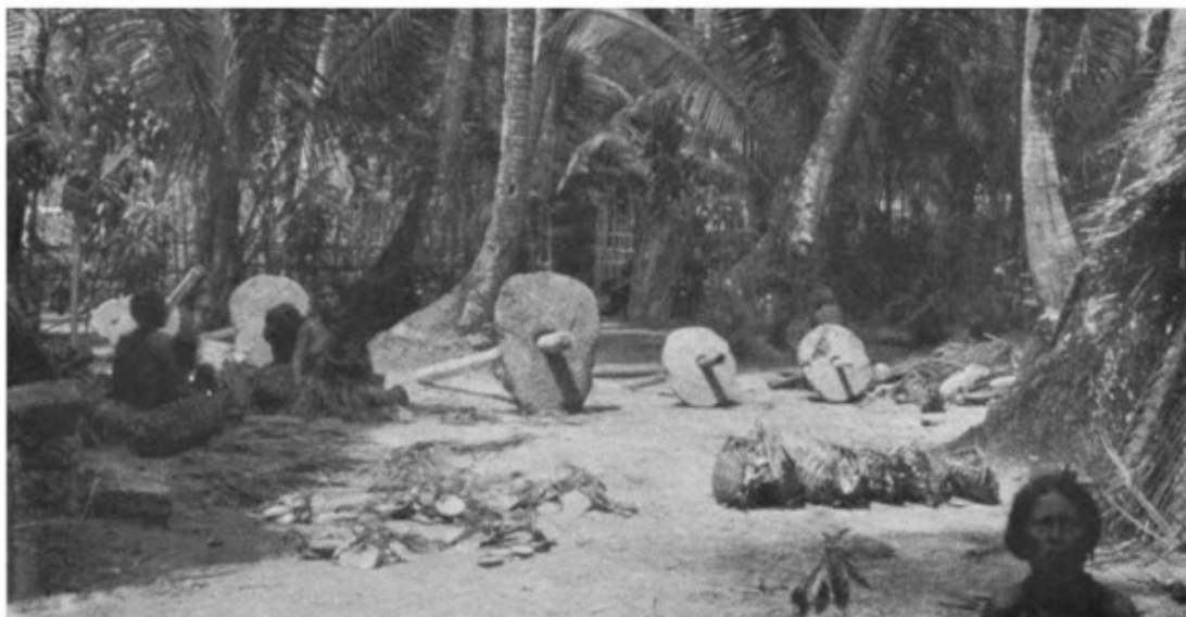
Рис. 19 – Камни Раи на фото 1906 г.

Размер камней сильно отличается ( d – от 7 см до 3,6 м; s – до 0,33 м; m – до 4 т). Камень Раи двухметрового диаметра установлен в холле Банка Канады в Оттаве, перед входом в Музей валюты.