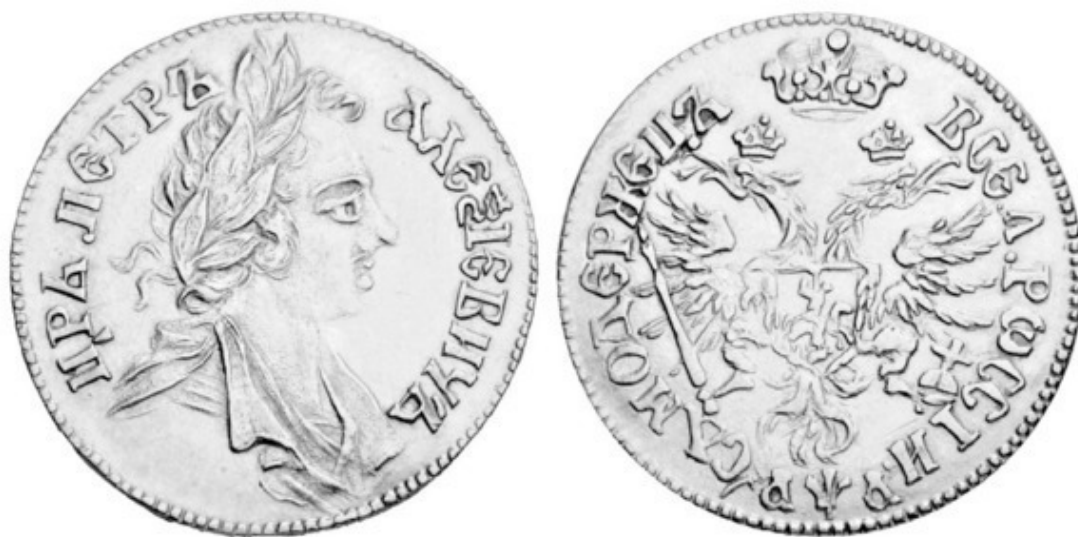
Рис. 6 – 2 дуката (двойной червонец) Петра I (1701)

с гербом СССР. В 1975—1982 гг. отчеканен большой тираж новодельных червонцев с гербом РСФСР и нов. датами, для реализации банками в качестве инвестиционных монет. См. инвестиционная монета (III) .