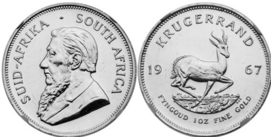
Рис. 11 – Кюггерранд (ЮАР, 1967), первая инвестиционная монета

Выпускаются сер., зол., плат. и палладиевые инвестиционные монеты. Первой инвестиционной монетой принято считать кюггерранд 1967 г. Рис. 11 , выпущенный в ЮАР (Южно-Африканская Республика). К инвестиционным монетам относятся многие памятные, коллекционные и юбилейные монеты из драг. мет., эмитируемые в различных странах в последние годы. См. эмиссия (XII) .