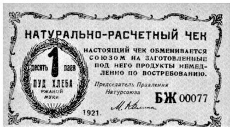
Рис. 18 – Бона 1 пуд хлеба, Киев (1921)

В период с 1919 по 1921 г. в Якутии в качестве бум. денег использовались спец. образом оформленные винные этикетки. Во время голода 1921 г. и безудержной гиперинфляции сов. руб. – совзнаков, Киевским Натурсоюзом были выпущены расчётные чеки в необесценивающейся каждый день валюте – достоинством 1 пуд хлеба Рис. 18 . См. инфляция (XII) .