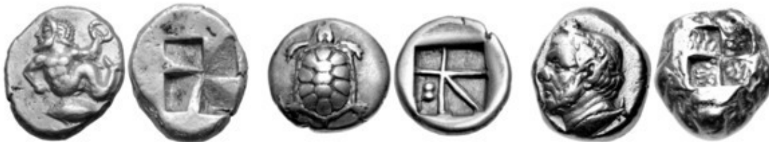
Рис. 17 – Лидийские монеты из электрума

Из электрума были сделаны первые в истории монеты Рис. 17 (в Лидии (территория соврем. Турции) в VII веке до н. э.). Электрум был удобен для изготовления монет, поскольку он твёрже золота и потому более износостоек. Кроме того, технология очистки золота в те времена была неразвита.