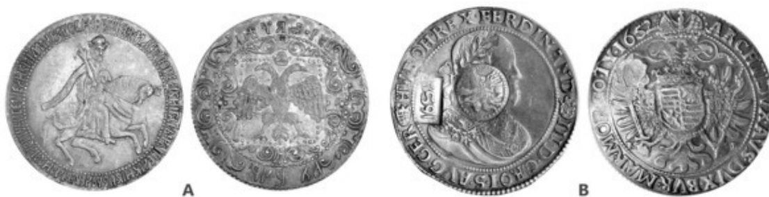
Рис. 9. А – «Первый» руб. Алексея Михайловича (1654); В – «Ефимок с признаком» (1655)

В 1654 г. на кружок ефимка нанесли изображение царя и гос. герба. Эта монета стала первой в России с номинальной стоимостью – 1 руб. ( m – 28 г) Рис. 9. А.