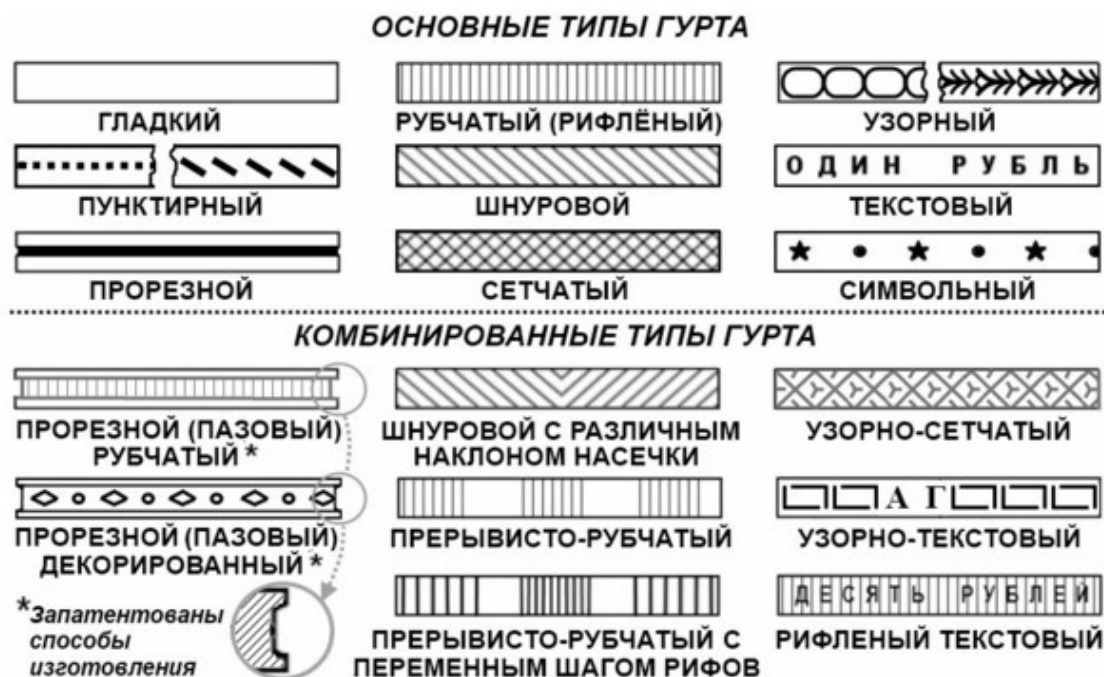
Рис. 2 – Типы гурта

ЗНАК ГРАВЁРА – инициалы или спец. знак мастера, изготовившего штампель, или первичный маточник. См. гравёр, штампель (VI) .