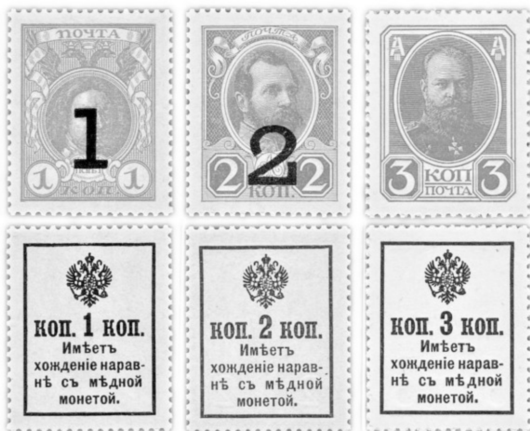
Рис. 3 – Марки-деньги. Надпечатка на л/с большой цифры номинала 1 и 2 коп. (1917)

НАДЧЕКАНКА (НАДЧЕКАН), КОНТРАМАРКА (фр. contre «добавочный» + marque «значок») – клеймо, пометка или штамп, нанесённые после изготовления монеты с целью подтверждения её подлинности, продления хождения или обозначения иной смысловой нагрузки.