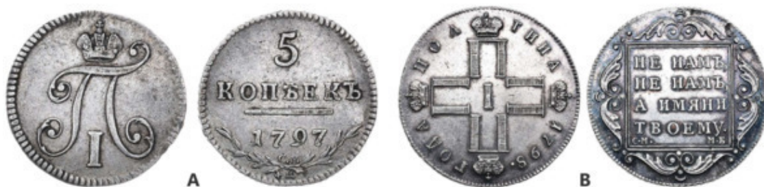
Рис. 1 – Пример вензелей на монетах Павла I. А – вензель, состоящий из буквы «П» и цифры «I»; В – монограмма, составленная из четырёх букв «П» и цифры «I» в центре

ВЕНЗЕЛЬ (польск. węzeł «узел») – худож. переплетённые (обычно) и образующие красивый узор, первые буквы имени и отчества правящего монарха. Могут применяться и рим. цифры Рис. 1. А . Вензель – монограмма с более замысловатым переплетением инициалов и добавлением к ним различных украшений, узоров и витиеватостей. Если буквы принадлежат одному лицу, то вензель считается простым, если нескольким – то сложным.