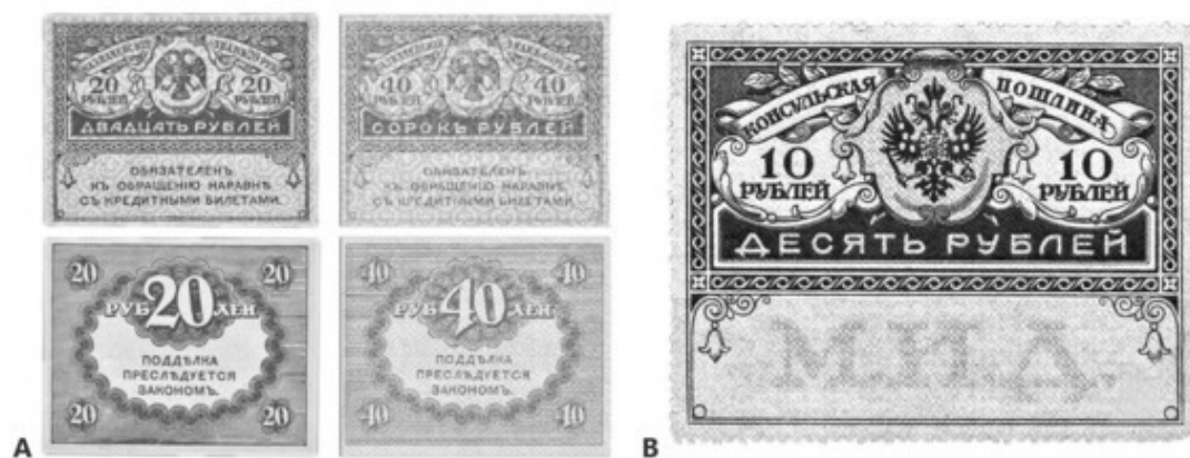
Рис. 12. А – «керенки»; В – марка консульской почты

КОЛЛЕКЦИОННЫЕ МОНЕТЫ – монеты, выпускаемые небольшим тиражом, предназначенные для коллекционирования, а не обращения. Выпуск производится банками или гос-вом и приурочен к различным памятным событиям, знаменитым людям, городам-героям и т. п. Обычно исполняются из драг. мет. (серебро, золото, палладий и др.). К ним могут относиться инвестиционные, памятные и юбилейные монеты.