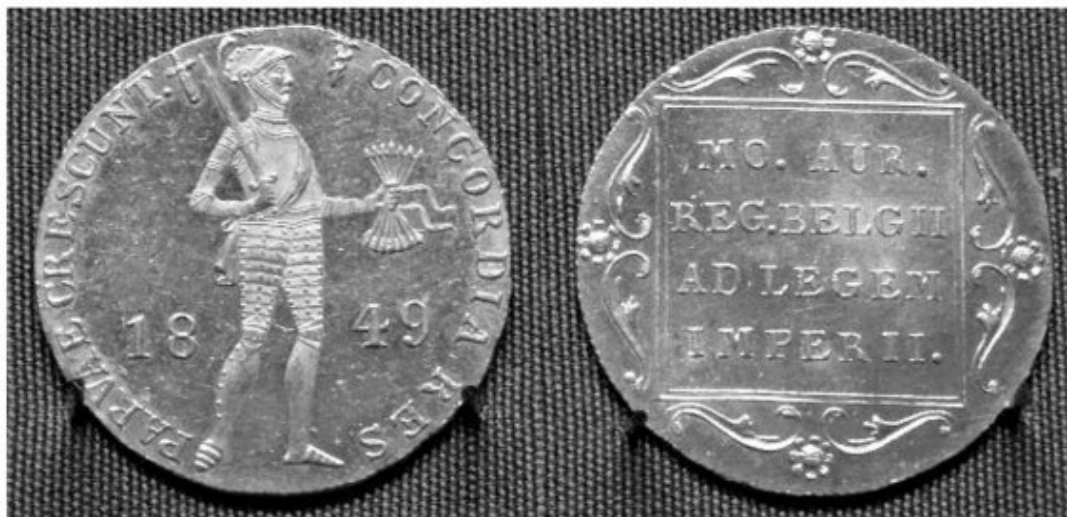
Рис. 10 – Голл. дукат рус. чеканки (1849) в собрании Гос. Эрмитажа

«ЛОБАНЧИК», «АРАПЧИК», «ПУЧКОВЫЙ» – нар. название голл. дуката или червонца (3,3—3,5 г чистого золота) и их копий, чеканившихся в СПб. в XVIII – XIX вв. См. штемпель (VI) ; фальшивая монета (IX) .