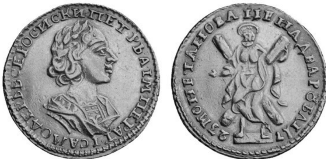
Рис. 7 – Андреевский двухрублёвик 1723 г.

АНЭПИГРАФНАЯ МОНЕТА (ан «без-» + греч. ἐπιγραφή «надпись»), НЕМАЯ МОНЕТА – монета без надписей, содержит только изображения. К анэпиграфным монетам относятся многие антич. монеты.