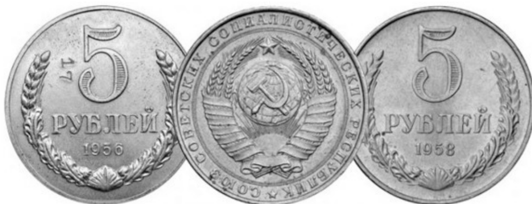
Рис. 16 – Пробная монета 5 руб. 1956 г. (слева) и экземпляр 5 руб. 1958 г. (справа)

Пробные монеты встречаются среди монет практически всех стран, начиная с Рим. империи. К рус. пробным монетам относятся сер. двухрублёвики Петра I 1722 г., «константиновский» рубль 1825 г. и др. Часть сов. пробных монет Рис. 16 1958 г., изготовленных в рамках подготовки к ден. реформе 1961 г., случайно попала в оборот, благодаря чему в настоящее время известно несколько сотен экземпляров. См. 1961, денежная реформа в СССР (XIII).