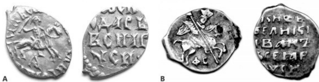
Рис. 5. А – денга (московка) правления Ивана III; В – новгородская денга (копейка) правления Ивана IV.

Отсюда же происходит современный термин «деньги». См. деньги (XII) ; 1535, денежная реформа Елены Глинской, 1698—1718, денежная реформа Петра I (XIII) .