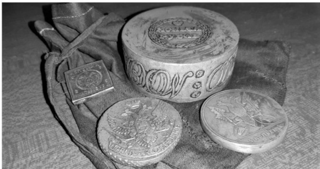
Рис. 14 – Медные монеты (Амурский обл. краеведческий музей)

МЕДНЫЙ РУБЛЬ – монета номиналом в 1 руб., отчеканенная из меди. В связи с относительной дешевизной меди, такие монеты получались довольно громоздкими, а их обращение – невозможно по причине их размера Рис. 14 .