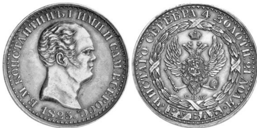
Рис. 13 – «Константиновский» руб. (1825)

КОНСТАНТИНОВСКИЙ РУБЛЬ – особый тип сер. руб. 1825 г., на котором изображён портрет Константина Павловича Рис. 13 – наследника престола, официально считавшегося императором, но на престол не вступившего и не царствовавшего (отказался от правления в пользу своего брата Николая). Одна из редчайших росс. монет. Известно 5 экз. с надписью на гурте и 3 с гладким гуртом.