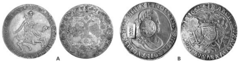
Рис. 9. А – «Первый» руб. Алексея Михайловича (1654); В – «Ефимок с признаком» (1655)

В 1654 г. на кружок ефимка нанесли изображение царя и гос. герба. Эта монета стала первой в России с номинальной стоимостью – 1 руб. (m – 28 г) Рис. 9. А.