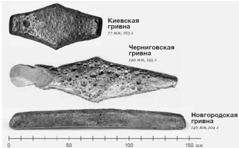
Рис. 4 – Др.-рус. гривны

УКРАИНСКАЯ ГРИВНА (укр. гривня ) – ден. ед. совр. Украины. Нац. валюта Украины (с 1996 г.), названная в честь др.-рус. грн. Делится на 100 коп.