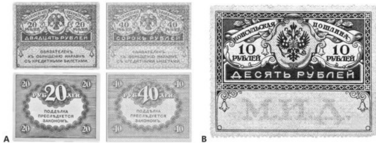
Рис. 12. А – «керенки»; В – марка консульской почты

КОЛЛЕКЦИОННЫЕ МОНЕТЫ – монеты, выпускаемые небольшим тиражом, предназначенные для коллекционирования, а не обращения. Выпуск производится банками или гос-вом и приурочен к различным памятным событиям, знаменитым людям, городам-героям и т. п. Обычно исполняются из драг. мет. (серебро, золото, палладий и др.). К ним могут относиться инвестиционные, памятные и юбилейные монеты.