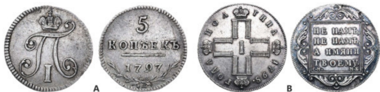
Рис. 1 – Пример вензелей на монетах Павла I. А – вензель, состоящий из буквы «П» и цифры «I»; В – монограмма, составленная из четырёх букв «П» и цифры «I» в центре

различных украшений, узоров и витиеватостей. Если буквы принадлежат одному лицу, то вензель считается простым, если несколькими – то сложным.