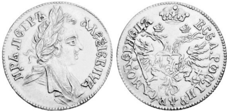
Рис. 6 – 2 дуката (двойной червонец) Петра I (1701)

ЧЕРВОНЕЦ (БУМАЖНЫЙ ЧЕРВОНЕЦ) (банкнота) – выпускался с 1922 г. до ден. реформы 1947 г. (все поздние выпуски имели дату «1937»). Поначалу бум. червонец имел зол. обеспечение, такое же, как у 10 дореволюционных руб., но обмен на золото фактически не проводился. С 1925 г. червонец был приравнен к 10 руб. и начал выполнять роль крупных купюр в дополнение к купюрам руб. номиналов (1, 3 и 5 руб.). См. 1922—1924, денежная реформа в РСФСР и СССР, 1947, денежная реформа в СССР (XIII).