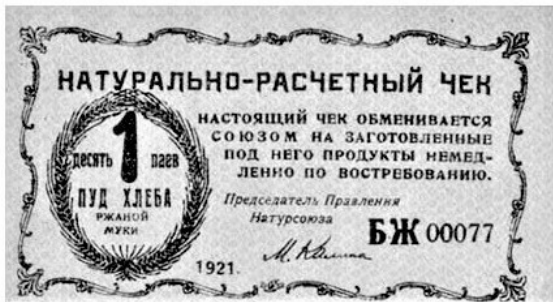
Рис. 18 – Бона 1 пуд хлеба, Киев (1921)