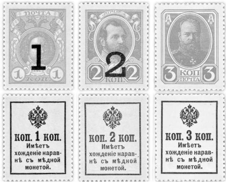
Рис. 3 – Марки-деньги. Надпечатка на л/с большой цифры номинала 1 и 2 коп. (1917)

НАДЧЕКАНКА (НАДЧЕКАН), КОНТРАМАРКА (фр. contre «добавочный» + marque «значок») – клеймо, пометка или штамп, нанесённые после изготовления монеты с целью подтверждения её подлинности, продления хождения или обозначения иной смысловой нагрузки.