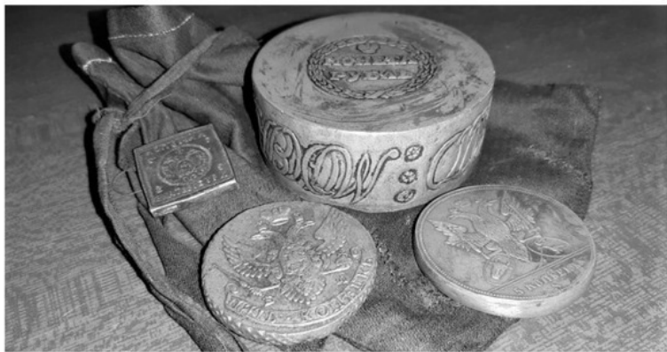
Рис. 14 – Медные монеты (Амурский обл. краеведческий музей)

МЕДНЫЙ РУБЛЬ – монета номиналом в 1 руб., отчеканенная из меди. В связи с относительной дешевизной меди, такие монеты получались довольно громоздкими, а их обращение – невозможно по причине их размера Рис. 14 .