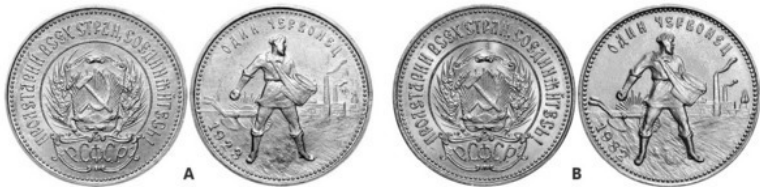
Рис. 15 – Золотой червонец «Сеятель». А – ориг. монета (1923); В – «новодел» (1982)

Не следует путать новоделы с совр. копиями или подделками. Новоделы можно разделить на два типа: