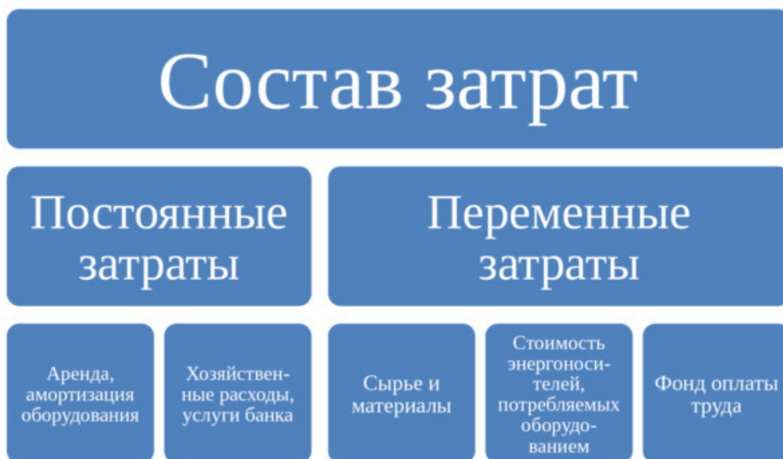
«Состав затрат калькуляции себестоимости»

Примерный состав затрат по видам представлю в таблице: