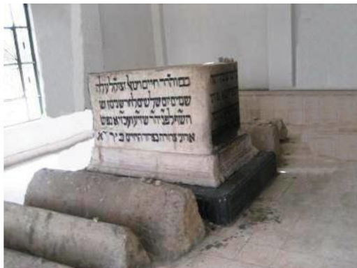
Могила р. Хаима Виталья в Дамаске