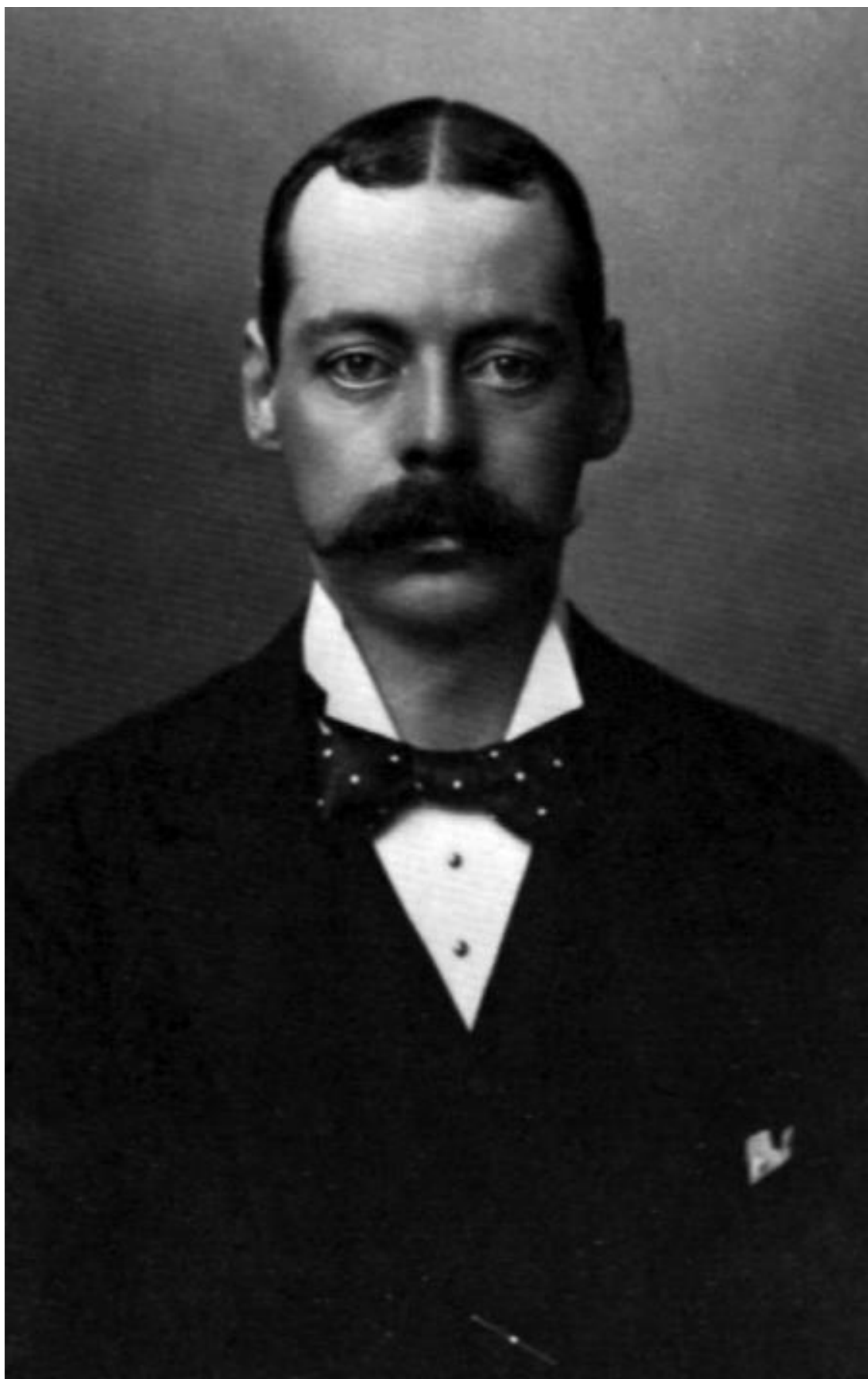
Сэр Рэндольф Черчилль, отец Уинстона Черчилля