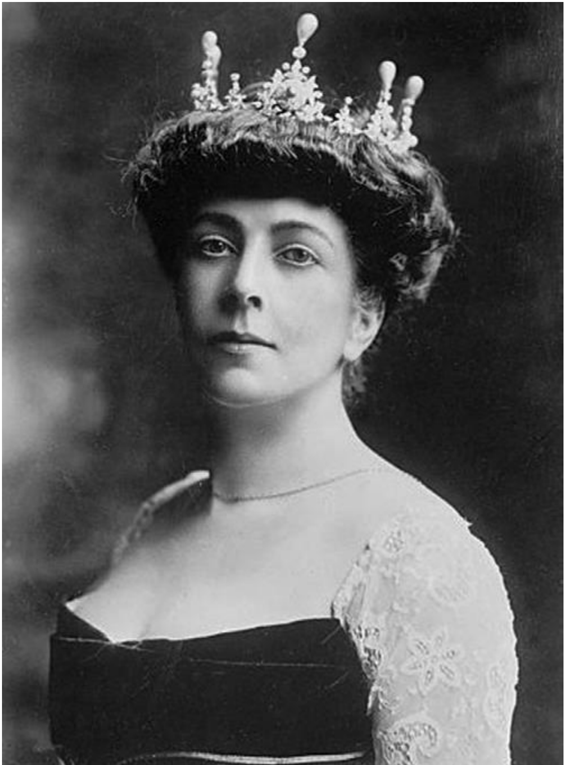
Дженни, мать Уинстона Черчилля, 1913

«Леди Рэндольф обладала ослепительной красотой, ее скорее можно было принять за итальянку или испанку. Глаза ее были большими и темными, изгиб губ был изысканным и почти озорным, волосы – иссиня-черными и блестящими, в ней было что-то креольское. Она была очень оживленной и