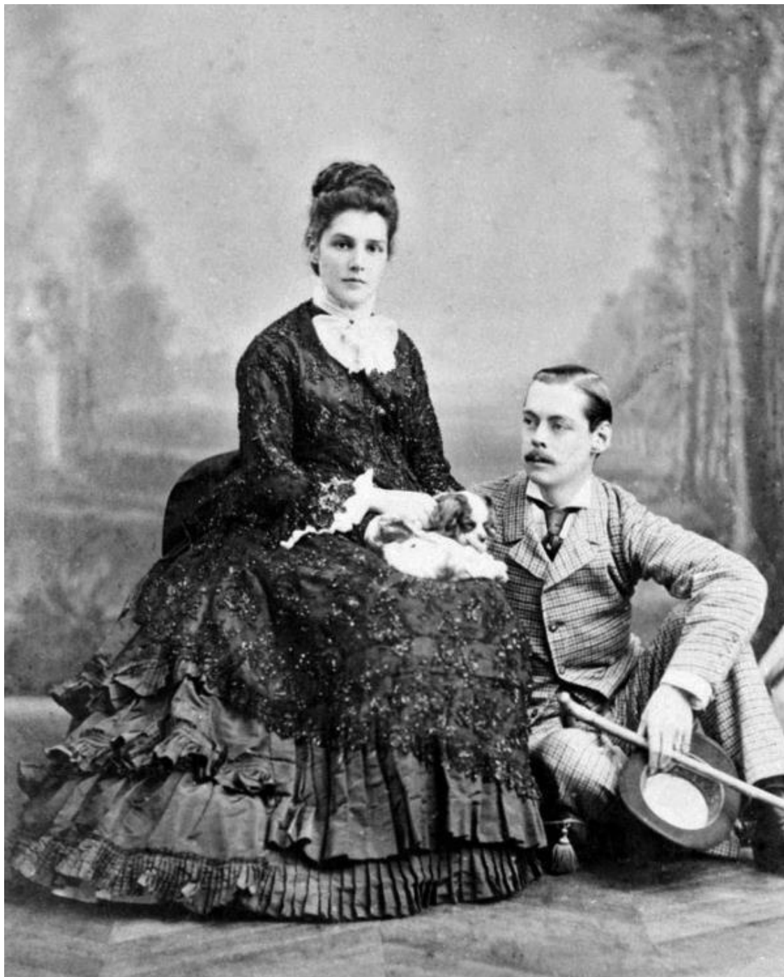
Лорд Рэндольф Черчилль и леди Джейн Джером

Выйдя замуж, Дженни с головой окунулась в светскую жизнь, для которой она была буквально создана. Красота, сильный характер, острый ум и умение себя подать надолго сделали ее королевой светских салонов. Правда, для реализации всех своих амбиций ей вечно не хватало денег. Как верно пошутил один из ее знакомых: «Дженни смело можно отнести к такому типу женщин, для которых иметь меньше сорока пар туфель означает прозябать в нищете».