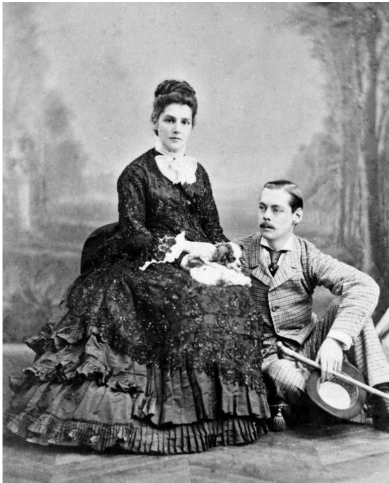
Лорд Рэндольф Черчилль и леди Джейн Джером