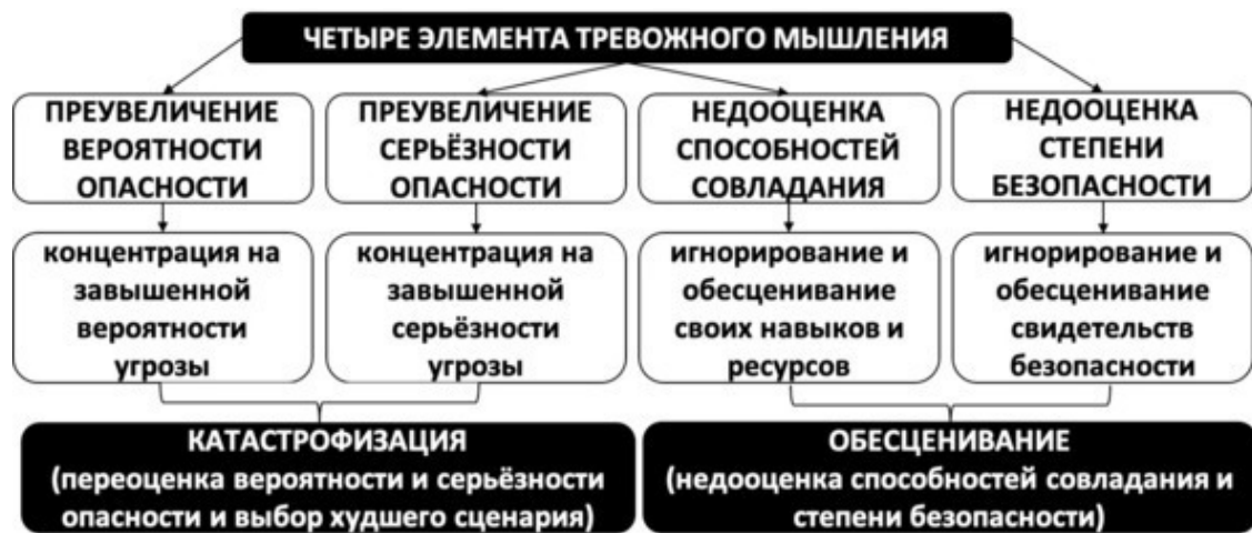
Рис. 11. Элементы тревожного мышления

В схематичном формате рассмотренные элементы тревожного мышления наглядно представлены ниже (см. рис. 11).