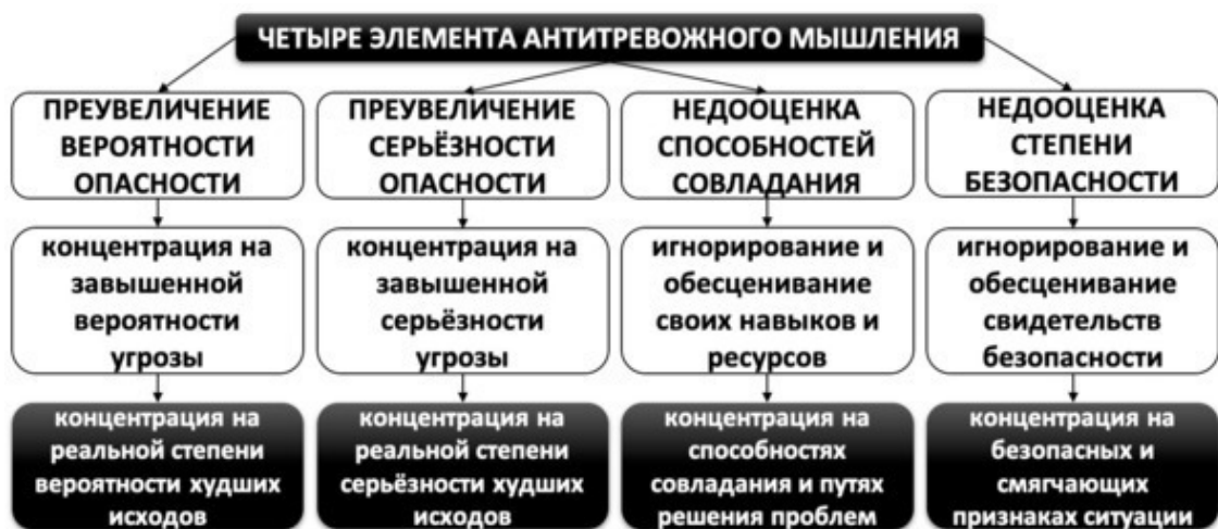
Рис. 14. Элементы антитревожного мышления

Тревога отступает при более реалистичной оценке степени вероятности и серьёзности угрозы или за счёт повышения уверенности в способностях совладания с угрозой и нахождения признаков безопасности (см. рис. 14).