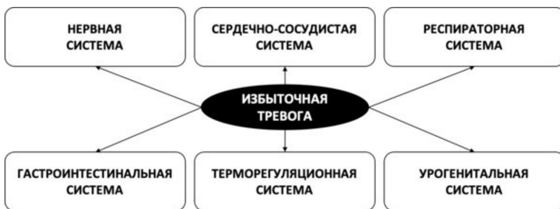
Рис. 15. Многогранность телесных проявлений тревоги

Необходимо понимать, что симптомы, вызванные избыточной тревогой, какими бы неприятными они не были, являются не признаком реального органического заболевания, а следствием искажённого мышления, которое создаёт тревогу, не могущую проявляться иначе как в виде телесных симптомов. А симптоматики, порождаемой избыточным уровнем тревоги и стресса, может быть превеликое множество, ведь тревога заставляет активно работать разные органы и системы человеческого организма (см. рис. 15).