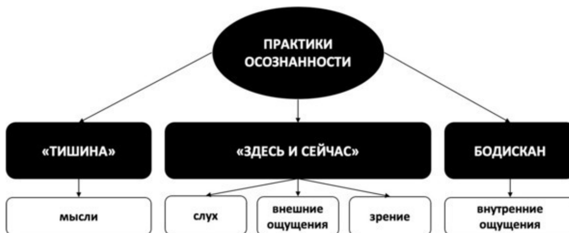
Рис. 8. Практики осознанности