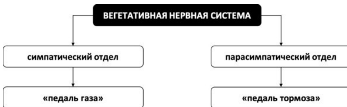
Рис. 2. Отделы вегетативной нервной системы

В любом случае начнёт усиленно работать симпатический отдел, который мобилизует ваш организм для бегства, сражения или замирания с целью выживания, чтобы вы были готовы действовать по тысячелетиями выработывавшемуся эволюцией механизму. Поэтому заслуженную порцию адреналина и кортизола вы точно получите. Конечно, вы будете испытывать и телесные симптомы. Извольте тревожиться сами – извольте и тело побеспокоить. Но когда реальная или представляемая опасность сойдут на нет, в дело вступит парасимпатический отдел, и вы начнёте отдыхать. Итак, вегетативная нервная система без вашего участия подстраивает работу организма под различные стрессовые события. И это существенно экономит время, ведь вряд ли вы говорите: «Сердце, бейся быстрее!» или «Кишечник, давай-ка поработаем в усиленном режиме! Хорош уже халтурить!» Для наглядности отделы вегетативной нервной системы можно условно обозначить как педали газа и тормоза, отвечающие, соответственно, за реакции стресса и релаксации (см. рис. 2).