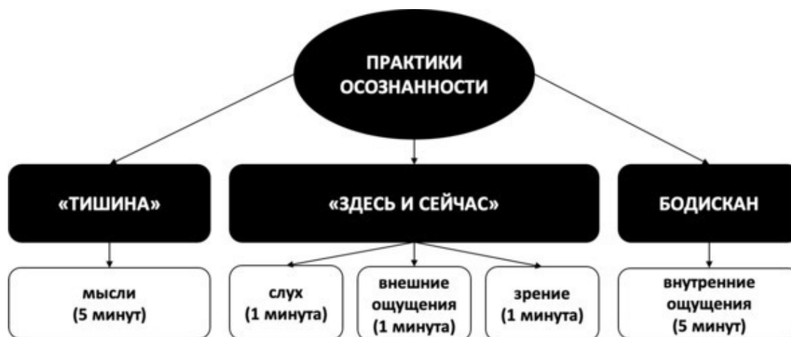
Рис. 9. Изначальная длительность выполнения практик осознанности