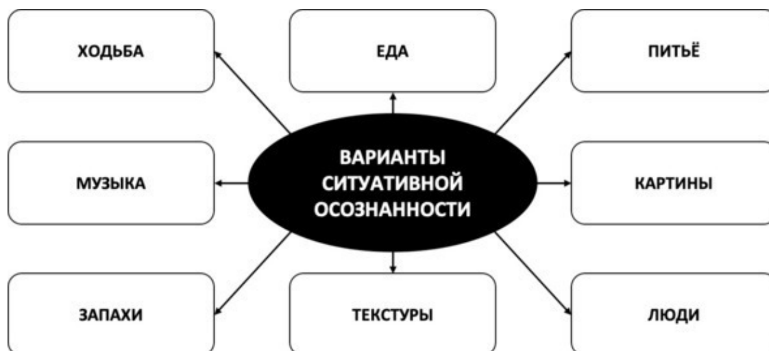
Рис. 10. Варианты ситуативной осознанности

вольствие. При возникновении посторонних мыслей просто отметьте их появление и вернитесь к осознанному выполнению текущего занятия. Вы также можете попробовать выполнять какие-то дела так, словно вы совершаете их в первый раз, или, гуляя по городу, воспринимать всё окружающее так, будто вы видите, слышите и чувствуете всё это впервые в жизни. Это удивительное и странное ощущение. Вы начнёте замечать то, на что раньше не обращали абсолютно никакого внимания, хотя сотни раз с этим сталкивались. Используйте любой свободный момент, чтобы попрактиковать осознанность. Как и дыхание, вы можете сделать осознанность «тайной игрой» во время поездок на автобусе, ожидания в очереди, прогулки – словом, в любом удобном и даже неудобном месте (см. рис. 10).