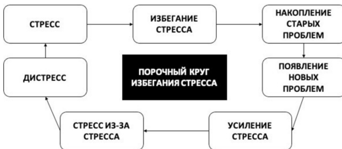
Рис. 3. Порочный круг избегания стресса

Таким образом, залог счастливой жизни состоит не в отсутствии стрессов и не в умении избегать любых переживаний, а в развитии навыков стрессоустойчивости. Действительно, попытки избегания стресса зачастую только усугубляют стресс, и бегство от решения проблем лишь добавляет напряжения к уже имеющемуся стрессу, ведь накопившиеся проблемы не решаются и множатся, и к тому же появляются новые проблемы. По причине накопления старых и образования новых проблем вы испытываете более сильный стресс, мешающий эффективно справляться как с проблемами, так и с самим стрессом, и, в конечном итоге, можете начать испытывать стресс из-за стресса, что как раз и ведёт к вышеописанному дистрессу (см. рис. 3). Однако формирование нового, более рационального и реалистичного мышления способствует не только эффективному решению проблем, развитию стрессоустойчивости и саморазвитию, но и профилактике различных тревожных и депрессивных состояний и дистресса.