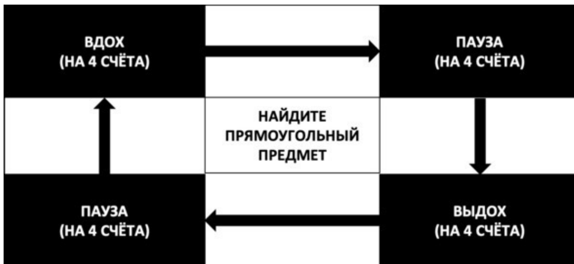
Рис. 6. Квадрат дыхания

взгляд в правый нижний угол. Наконец, вновь задержите дыхание (на четыре счёта) и при этом посмотрите на оставшийся левый нижний угол. Продолжайте дышать и смотреть таким образом в течение трёх минут. Более наглядно принцип квадрата дыхания проиллюстрирован на приведённой ниже схеме (см. рис. 6).