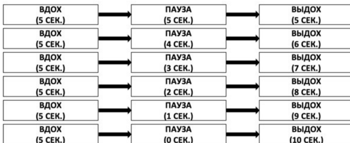
Рис. 7. Дыхание с паузой