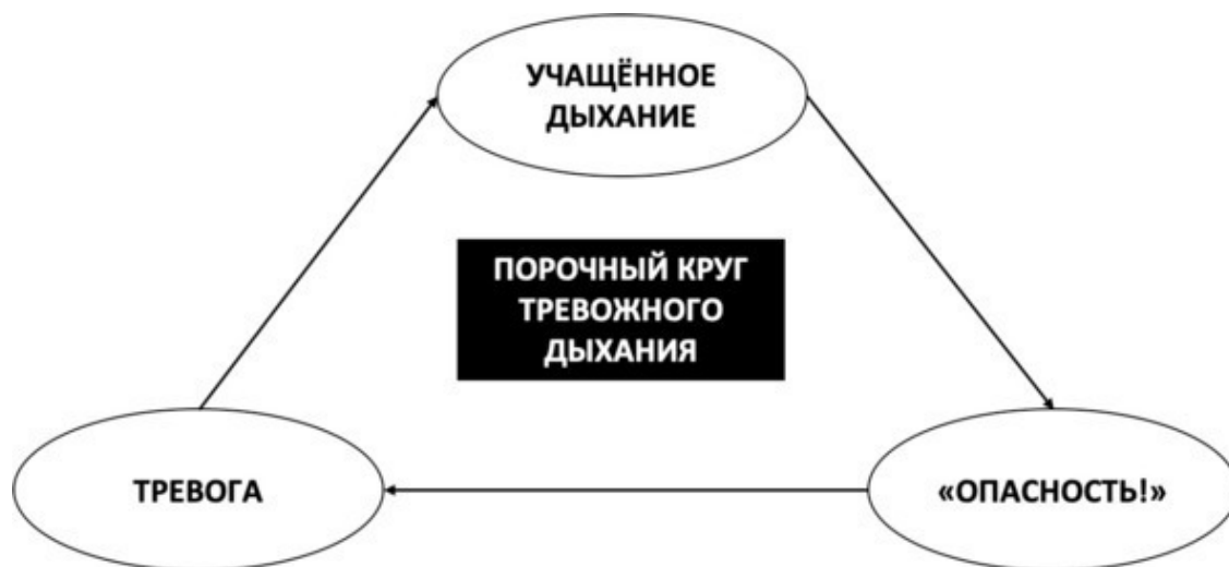
Рис. 5. Порочный круг тревожного дыхания

Важно понимать, что естественное дыхание человека – это спокойное, размеренное и глубокое дыхание животом. Однако под давлением современного скоростного ритма жизни человек ускоряется так, что становится в буквальном смысле «не продохнуть». Иными словами, человек начинает дышать часто и поверхностно, словно задыхаясь, и при этом задействовать грудную клетку. Такое грудное дыхание является признаком тревоги и часто приводит к синдрому гипервентиляции, когда кровь перенасыщается кислородом, что выражается в противоположном ощущении: вам кажется, что не хватает кислорода, от чего вы начинаете дышать ещё более часто, попадая в порочный круг тревожного дыхания. Стоит помнить о взаимном влиянии тревоги и дыхания: если вы тревожитесь, ваше дыхание становится частым, поверхностным, неровным и грудным, что, в свою очередь, даёт мозгу сигнал об опасности, из-за чего тревога увеличивается (см. рис. 5). К тому же такое грудное дыхание приводит к нарушению в организме баланса кислорода и углекислого газа, что также может вызвать физические симптомы тревоги и стресса.