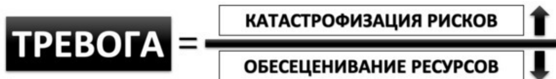
Рис. 12. Краткая формула тревоги

Таким образом, во время эпизодов тревоги человек избыточно концентрируется на мыслях об опасности и своей неспособности справиться с тревожащей ситуацией, что приводит к невозможности более трезвого рассмотрения менее угрожающих вариантов развития событий, поскольку в моменты выраженной тревоги довольно сложно мыслить рационально. Иными словами, человек начинает тревожиться, когда риски трактуются как высокие, а он не осознаёт, за счёт чего и как можно с ними совладать (см. рис. 12).