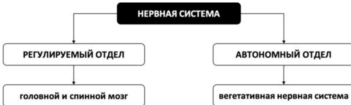
Рис. 1. Отделы нервной системы

Чтобы вступить на путь постепенного преодоления разных проявлений стресса, важно понимать физиологические законы их функционирования. Любые техники и упражнения представляют собой лишь следствие этого понимания и, укрепляя теоретический фундамент, позволяют кирпичик за кирпичиком выстраивать здание счастливой жизни без избыточных стрессовых переживаний. Для начала нам нужно вспомнить о том, что у каждого из нас есть такая прекрасная вещь, как нервная система. «Ну ничего себе прекрасная!» – сразу же воскликнут некоторые читатели. – «У кого-то, может быть, и прекрасная, но моя нервная система давно порвалась на тряпки!» Не торопитесь вешать свою нервную систему на гвоздь или задвигать на антресоли. Она вам ещё пригодится. Но чтобы всякий раз, образно говоря, не рвать её на британский флаг, необходимо понимать, как она всё-таки устроена. Итак, наша всё ещё прекрасная нервная система состоит из двух отделов – регулируемого (он включает в себя головной и спинной мозг и позволяет человеку свободно совершать контролируемые действия) и автономного (этот отдел самостоятельно регулирует работу внутренних органов и секретций и не зависит от желаний человека) (см. рис. 1).