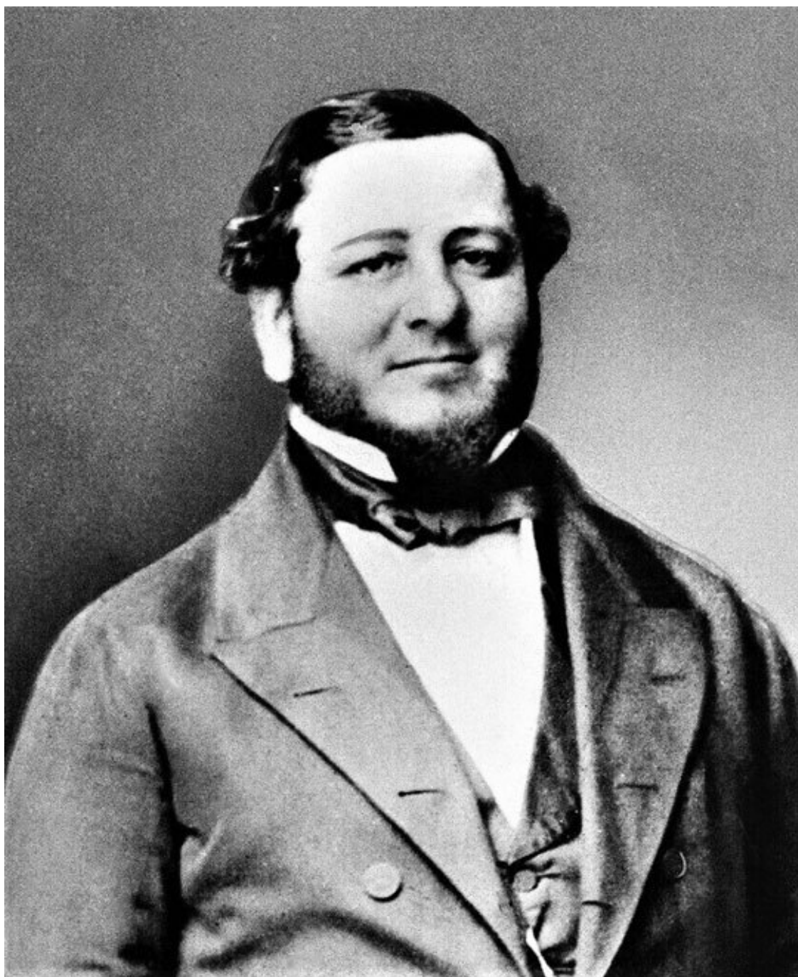
Иуда Филипп Бенджамин

На юге небо всегда кажется выше. Когда опускаются сумерки и верхушки кипарисов застывают на фоне глубокой синевы, кажется, что воздух напоен бархатистым ароматом вечно-зеленой тропической растительности. «Добрый старый американский Юг», край резких контрастов под ярким солнцем, давно уже стал легендой. Ушла в небытие размеренная и утонченная жизнь старых усадеб. Унесены ветром балы и дуэли, южные традиции и предрассудки. Стали героями исторических романов плантаторы и генералы, салонные красавицы и светские львы, а в каждом американском городе, большом или малом, есть памятник погибшим в годы жестокой войны, расколовшей страну на Север и Юг.