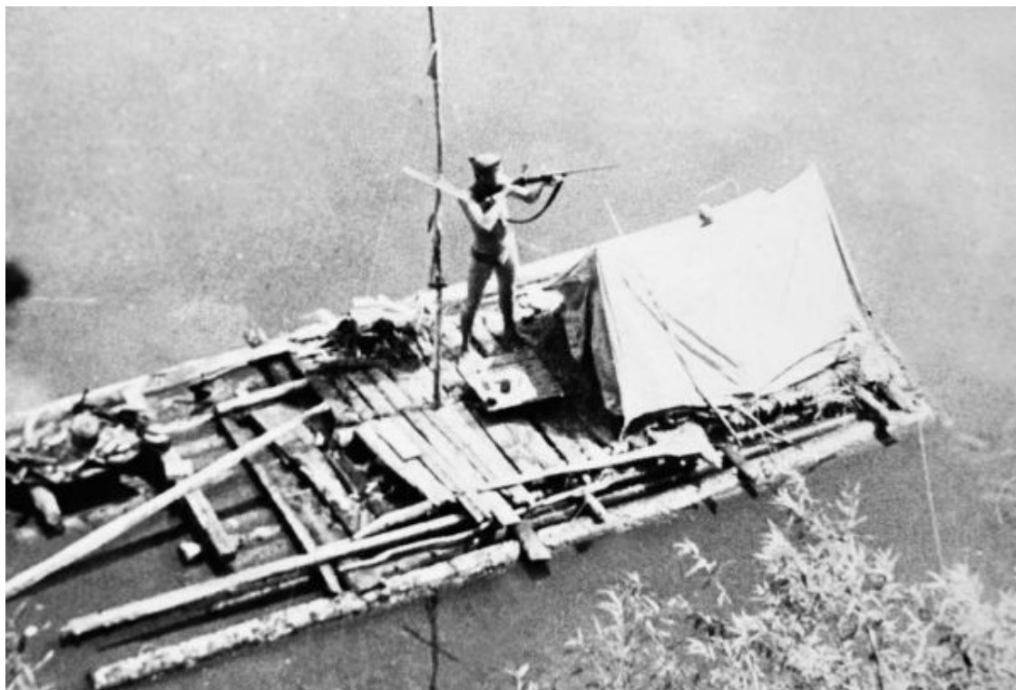
Наш плот «Сфема». Река Томь, 1964 г.

Шел проливной холодный дождь. Мы вылавливали в реке редкие бревна, оставшиеся от весеннего сплава, крепили их привезенными с собой металлическими скобами и к вечеру, дрожа от холода, соорудили вполне приличное плавсредство. На нем был настил из досок, палатка, рулевое весло, мачта, а на корме – место для разведения костра и приготовления пищи.