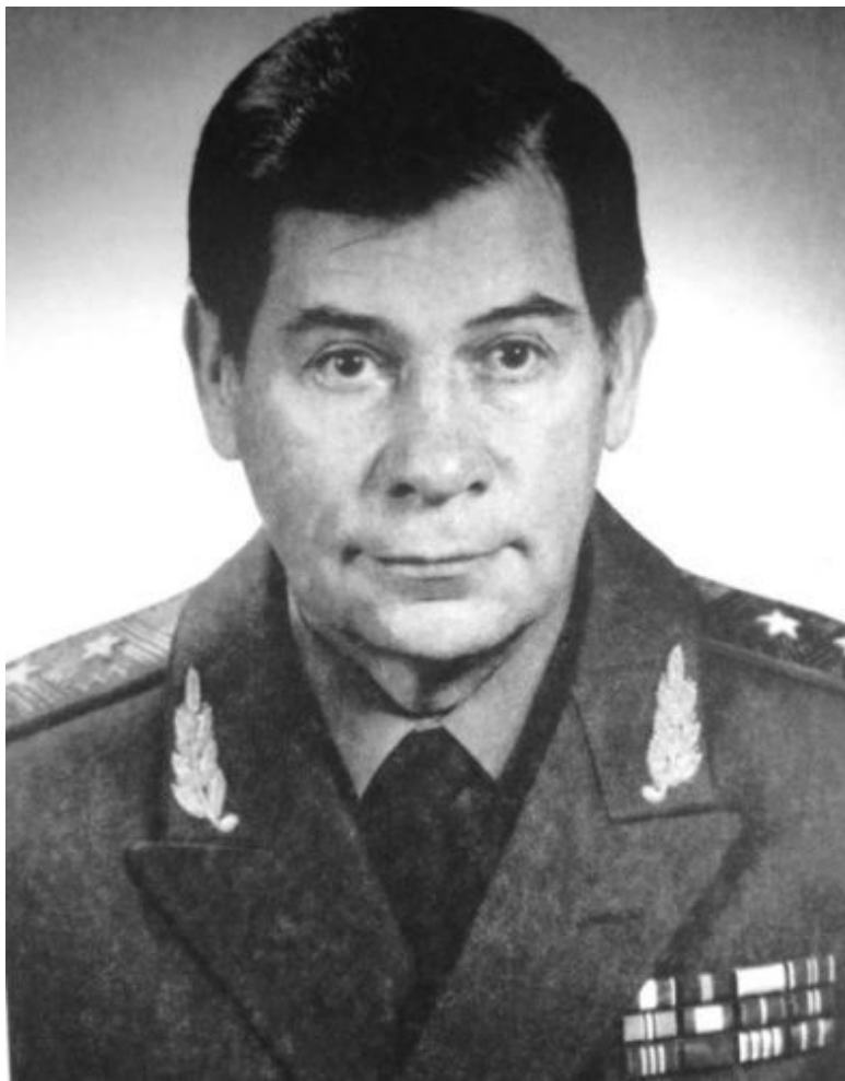
Леонид Шебаршин был не только начальником разведки,