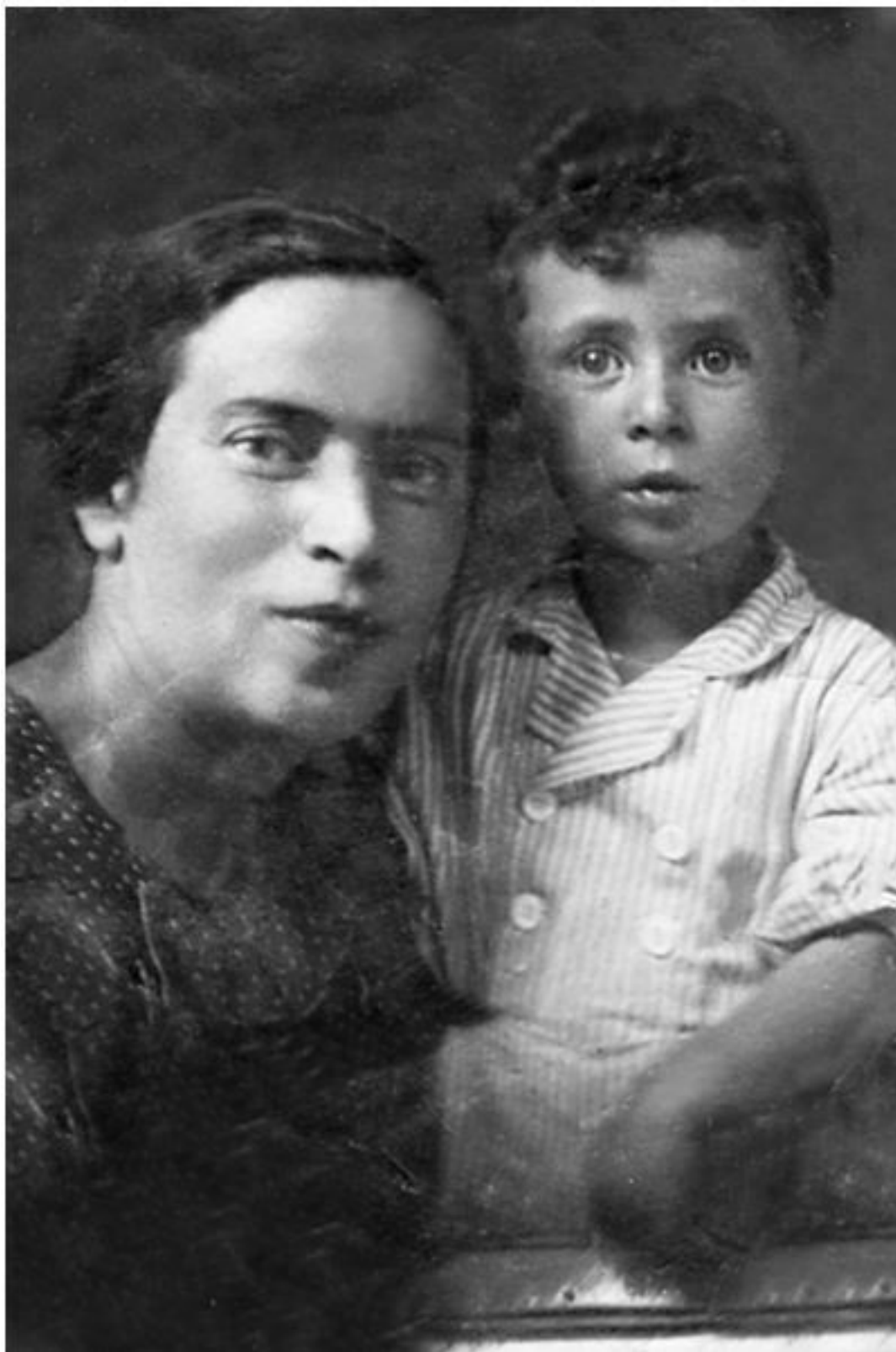
Я с мамой. Москва, 1940

Была робкая надежда, что семья вместе с другими бежала из города. Может быть, имея целью Горький. И он тоже пошёл на восток и осенью добрался до Горького. О судьбе жены и детей он до конца своей жизни так и не узнал. Годы войны проработал в лесном хозяйстве в Горьковской области, потом вернулся в Минск, потом перевёлся в Брест, где женился на