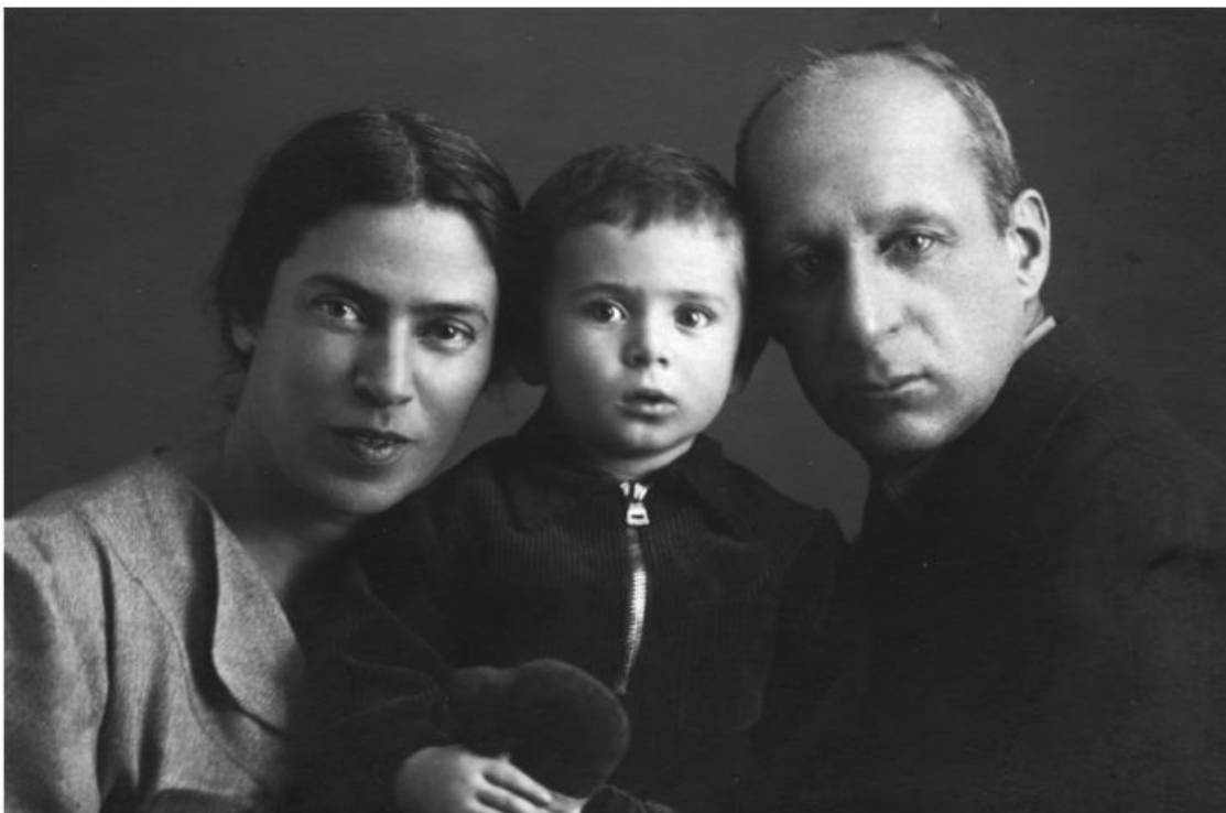
Родители со мной. Москва, 15 января 1939 (На обороте: «Лёвущке 1 г. 6,5 мес.»)

То ли из-за условий проживания, то ли по чисто медицинским причинам я оказался в туберкулёзном санатории в Сокольниках (летом в Царицыно), где провёл 11 месяцев и 10 дней (до 18.05.41). Как ни странно, помню некоторые детали. В частности – как мама с внешней стороны забиралась на забор и разглядывала меня в театральные бинокль. Контакттировать запрещалось, а зрение у неё было плохое, но очков почему-то не было.