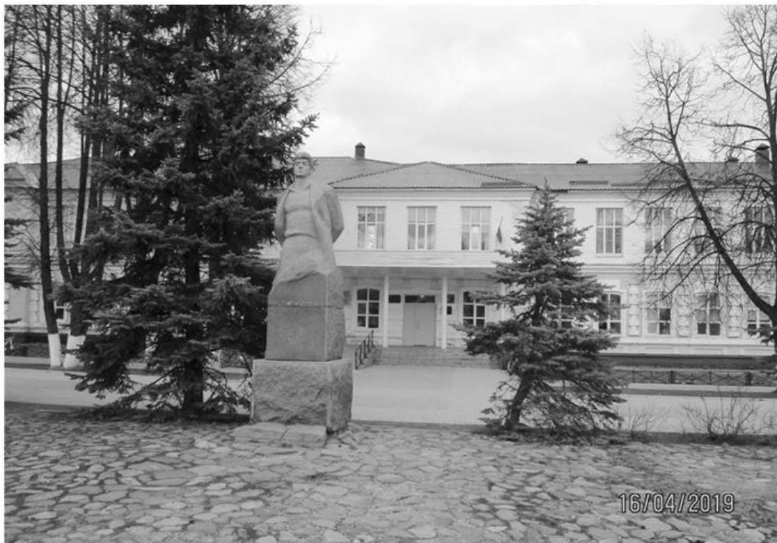
Школа № 1 на пл. Корнилова, 2019

Мама сделала безуспешную попытку восстановить свои московские права. Официально нам отказали потому, что дом наш в Москве был разрушен бомбардировкой.