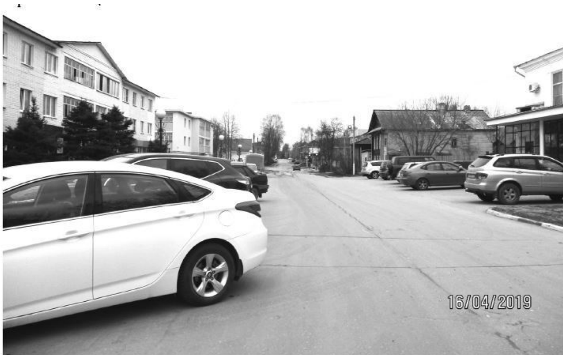
Улица «1 мая». Семёнов, 2019

Мы разместились в «казарме», в которой отец провёл войну и где ещё оставалось несколько десятков коек. Но, поскольку это была мужская казарма, нам за ширмой выделили уголок. Возможно, территориально это было в районе Бульварного кольца.