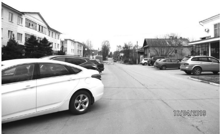
Улица «1 мая». Семёнов, 2019