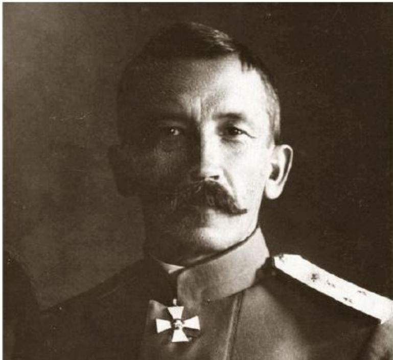
Лавр Георгиевич Корнилов

Если вернуться в далекий уже 1917 год, то тогда матросская масса в своем подавляющем большинстве всегда выступала единым фронтом. Это был настоящий феномен единства и братства. С первых дней Февральской революции матросы дружно взялись за демократизацию флота, так как они ее понимали с убийствами адмиралов и офице-