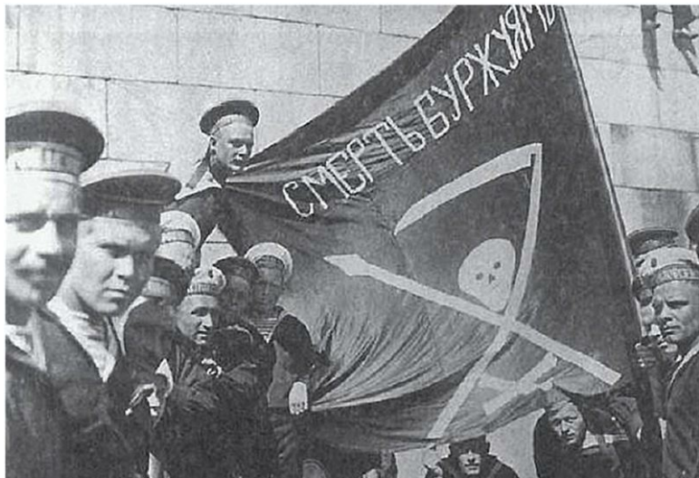
Моряки с линкора «Петропавловск» в 1917 году

Анархисты Кронштадта, выпускали собственный журнал «Вольный Кронштадт». Из передовицы журнала: «Просыпайтесь! Просыпайся, человечество! Рассей тот кошмар, что окружает тебя... Положи конец дурацкому поклонению земным и небесным богам! Скажи: «Хватит! Я встаю! И вы обретете свободу! Да здравствует анархия! Пусть трепещут паразиты, владельцы и попы – все сплошь обманщики!» С осени 1920 года в Кронштадте, на почве роста антибольшевизма, начали активизироваться не только анархисты-коммунисты и анархисты-синдикалисты, во главе с Х.З. Ярчуком, но и анархисты-экстремисты. Так в прокламации, обнаружен-