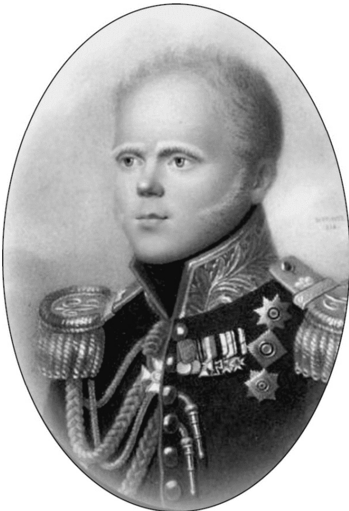
Великий князь Константин Павлович. Неизвестный художник

Но как откажешь другу детства, да тем более, вполне возможно, будущему императору. О планах передать престол не ему, а Николаю Павловичу тогда ещё никто не подозревал.