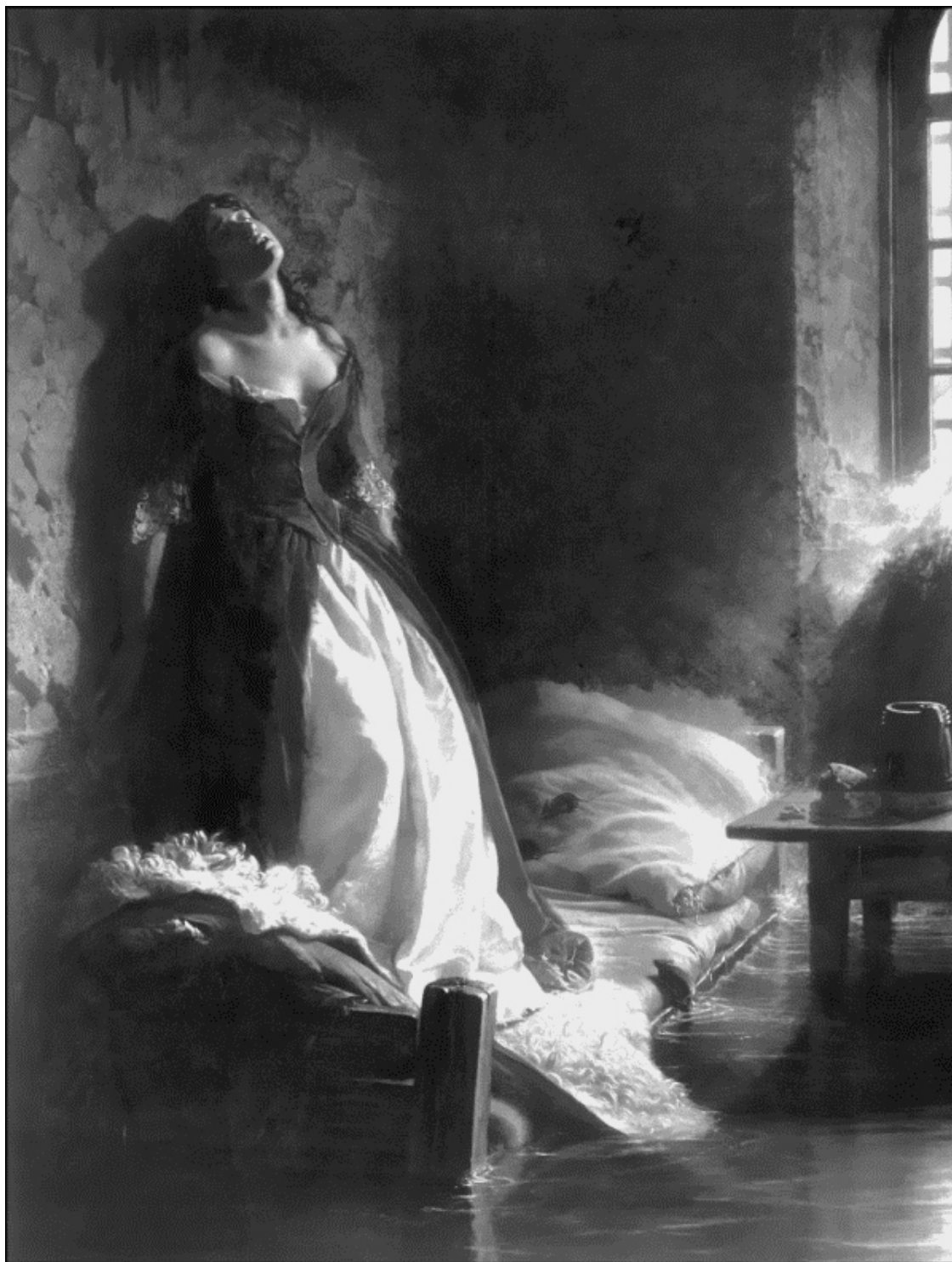
Княжна Тараканова. Художник К. Д. Флавицкий

Да и знала ли она, кто её родная мать? На этот вопрос ответ она могла дать лишь сама. Впрочем, мы попытаемся поразмыслить над возможным ответом в данном очерке.