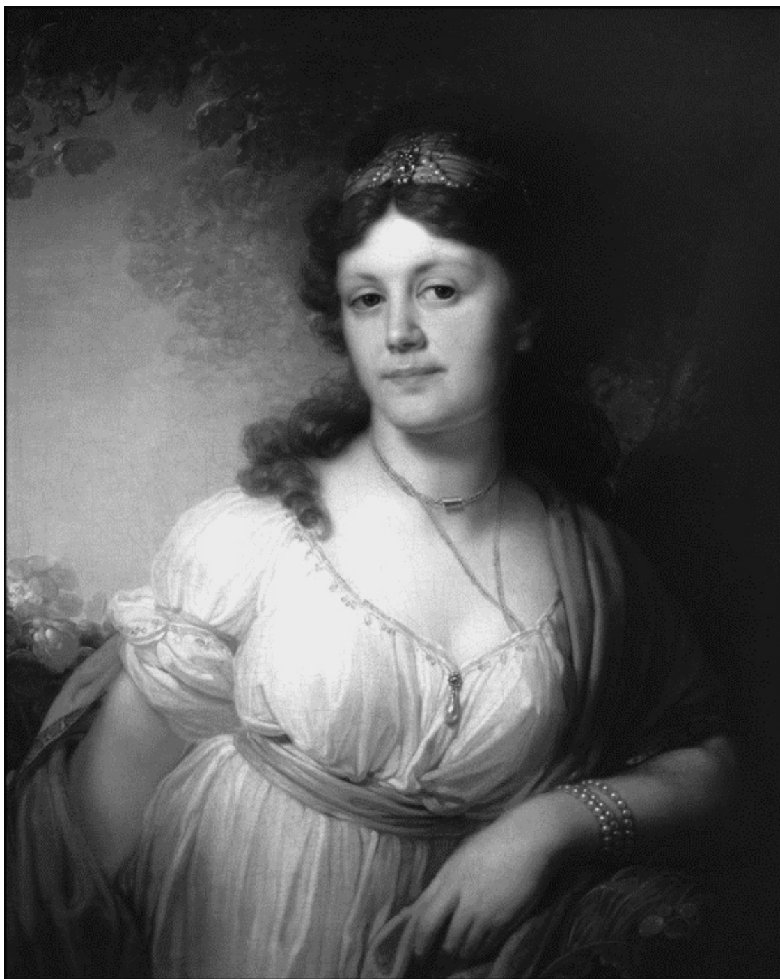
Портрет Елизаветы Григорьевны Темкиной. Художник В. Л. Боровиковский

Елизавета Григорьевна Тёмкина умерла на 79-м году жизни 25 мая 1854 года. Дата кончины её супруга неизвестна. В Википедии говорится лишь, что умер он не ранее 1841 года.