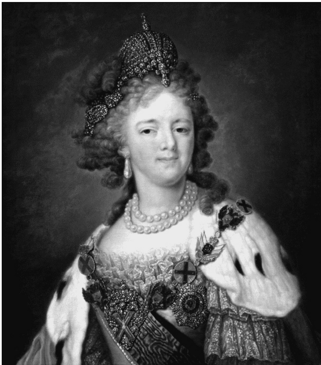
Портрет императрицы Марии Фёдоровны. Художник В. Л. Боровиковский